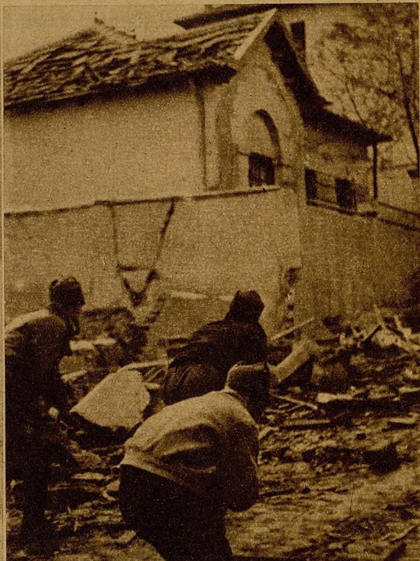
Nuestros soldados atacan esta casa ocupada por los fascistas y desde la cual se hostilizaba a las tropas republicanas

Bajo el fuego feroz ha caído el insigne escultor, gloria del arte español, Emiliano Barral, autor, entre muchas obras ejemplares, del monumento a Pablo Iglesias. Barral, que diariamente compartía los peligros de la guerra en las líneas avanzadas con las Milicias segovianas, que fundó y dirigía, fué alcanzado por la metralla cuando exaltaba a los suyos al esfuerzo guerrero. España ha perdido un gran artista, un valor singular. Los que tratábamos íntimamente a Barral hemos perdido un gran hombre y un gran amigo. Así como la gloria del arte, la gloria del luchador cubre sus restos