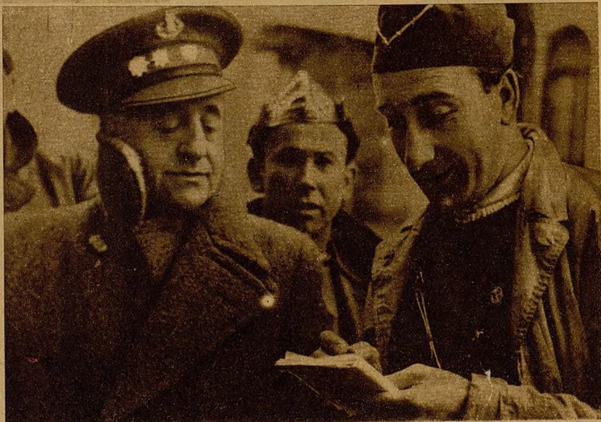
Uno de los jefes que dirigen las operaciones en el sector del Centro dando órdenes a uno de sus colaboradores

Bajo el fuego feroz ha caído el insigne escultor, gloria del arte español, Emiliano Barral, autor, entre muchas obras ejemplares, del monumento a Pablo Iglesias. Barral, que diariamente compartía los peligros de la guerra en las líneas avanzadas con las Milicias segovianas, que fundó y dirigía, fué alcanzado por la metralla cuando exaltaba a los suyos al esfuerzo guerrero. España ha perdido un gran artista, un valor singular. Los que tratábamos íntimamente a Barral hemos perdido un gran hombre y un gran amigo. Así como la gloria del arte, la gloria del luchador cubre sus restos