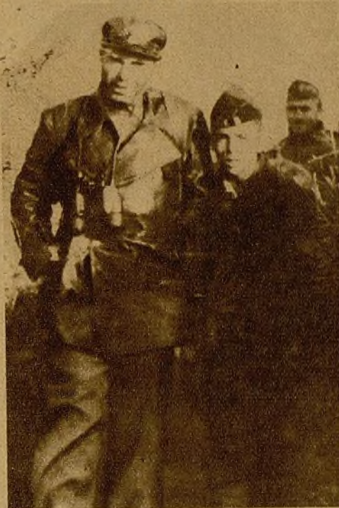
El gran luchador Buenaventura Durruti, revolucionario puro, valor neto y preclaro de nuestro movimiento popular, recordando el frente con varios compañeros, días antes de su muerte

Desde aquel instante renació la tranqui-