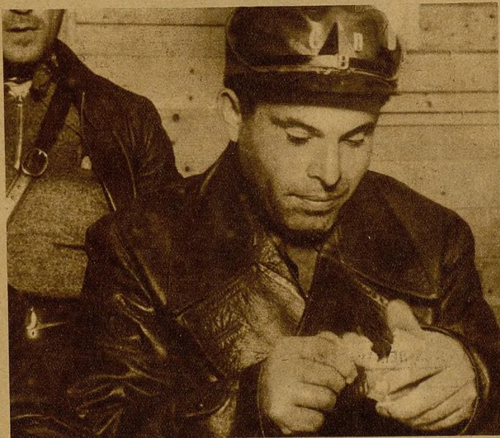
Las balas fascistas nos han quitado un gran jefe, un ejemplar camarada, un luchador de iniciativas magníficas, un organizador de primer orden. Buenaventura Durruti, cuya pérdida ha de sentir en sus entrañas todo el pueblo revolucionario, aparece aquí durante su frugal comida en las líneas avanzadas

lidad en todos. Durruti estaba a nuestro lado, traía a sus nombres. En Madrid no entraría el fascismo. No perdimos su contacto. Le seguíamos, sugestionados, por las alamedas de la Casa de Campo, donde su bravura inigualable se destacaba siempre en primera línea. Dos horas antes de caer herido, nos dijo: