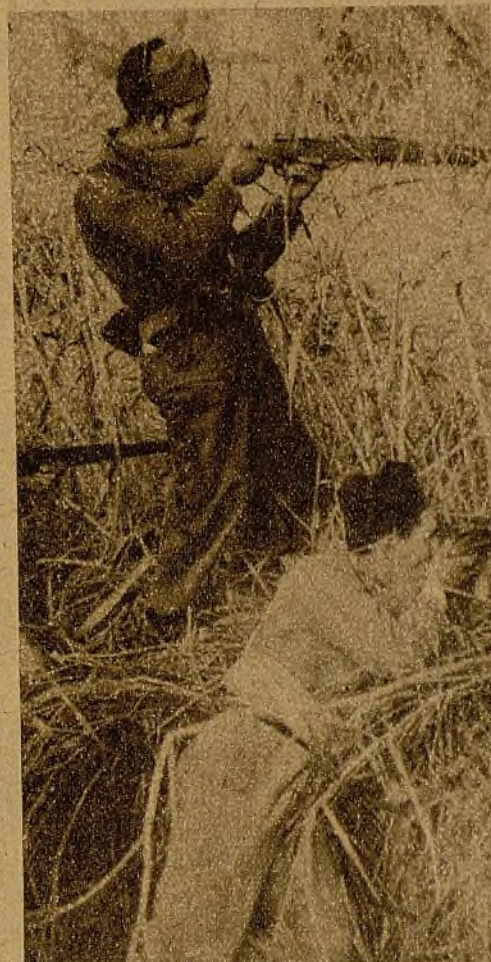
Protegidos por el ramaje, prestos a reprimir cualquier sorpresa, los soldados de esta avanzadilla no desvelan un momento en su labor de vigilancia

Esto con respecto a la labor de infantes leales. No hablemos de la Artillería republicana, que merece la gratitud de España en-