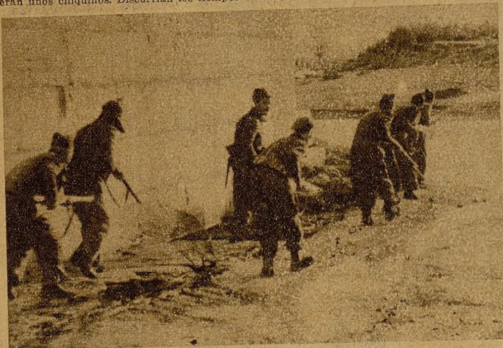
Obligado por el fuego de nuestras ametralladoras, el enemigo se ha visto precisado a pasar el río. Nuestros milicianos avanzan, al amparo de una tapia, para acabar de ahuyentarlo con sus tiros

tera. Nada más magnífico, nada más eficaz, nada más potente. Durante las últimas cuarenta y ocho horas, sus expertísimos servidores han realizado una labor genial. Sus tiros, sabiamente dirigidos, desmontaron varias baterías enemigas. Han triturado sus fuegos. Ayer, cuando a voleo disparaban los fascistas sobre objetivos inocentes, nuestra Artillería localizó sus piezas, y algunas, a los pocos instantes, volaban hechas pedazos.