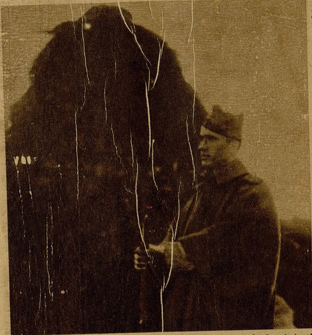
Junto a su garita, perfectamente construída para que le sirva de cómodo refugio, el centinela vigila las líneas enérgicas, situadas a corta distancia

liares o para gozar del positivo avance de nuestras fuerzas nacionales, es interesante; repetimos, advertir que a pesar de haber transcurrido quince días de cerco y gravitar sobre la cintura de Madrid lo mejor de nuestros hombres, todavía no pudo realizarse la operación definitiva que ponga en manos de nuestro sabio y bravo caudillo el Ministerio de la Guerra y, por tanto, el Gobierno de España.