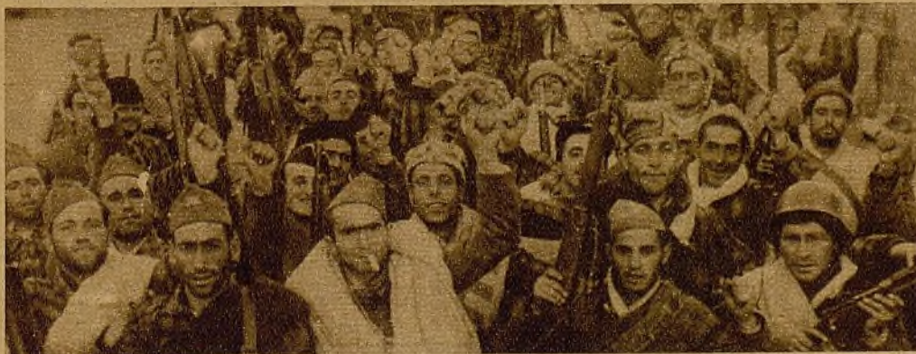
Un grupo de milicianos saluda entusiásticamente a sus compañeros al llegar a una de las avanzadas del sector Centro

Esperemos, lector. Esperemos y tengamos fe en la bondad maravillosa del ideal que nos ha movido a sacrificarnos por la República.