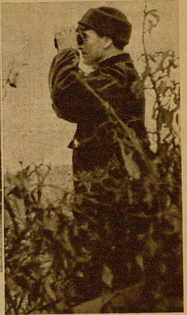
Un jefe de Milicias observando el curso de un avance de nuestras fuerzas de primera línea