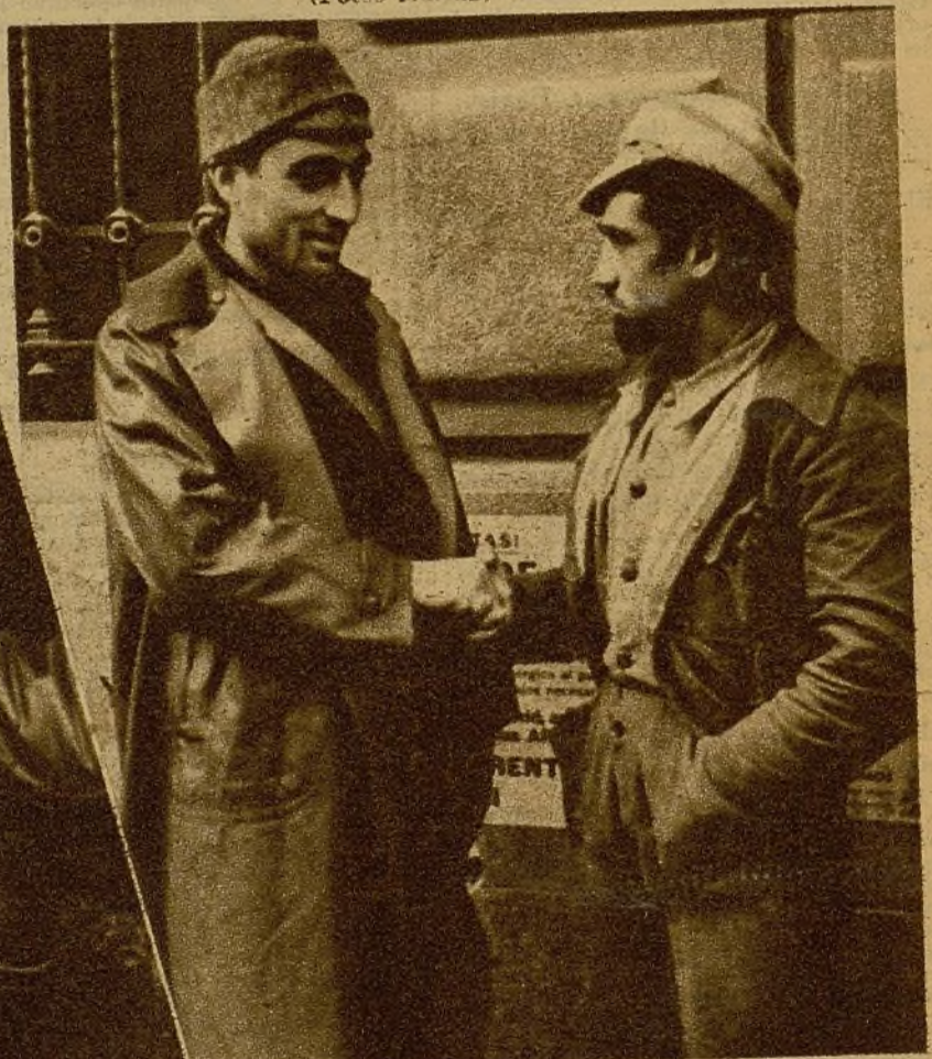
Un jefe de Milicias felicitando a uno de sus soldados, que con extraordinaria bravura hizo retroceder a los tanques enemigos arrojando bombas de mano