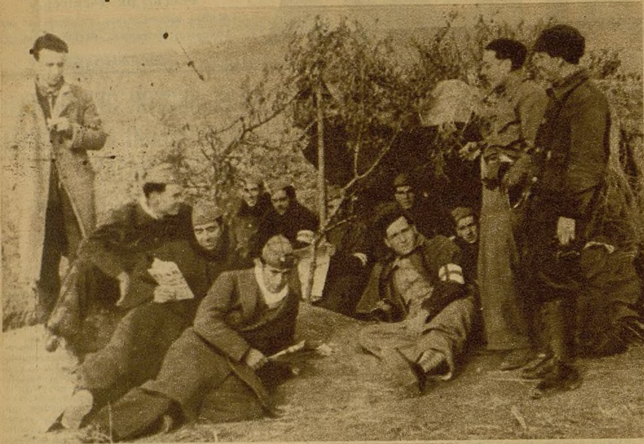
Los soldados de la Columna Internacional, heroicos colaboradores en la causa del pueblo español, están dando ejemplo de sus posibilidades guerreras. He aquí a un grupo de ellos descansando después de unas horas de actividad combativa