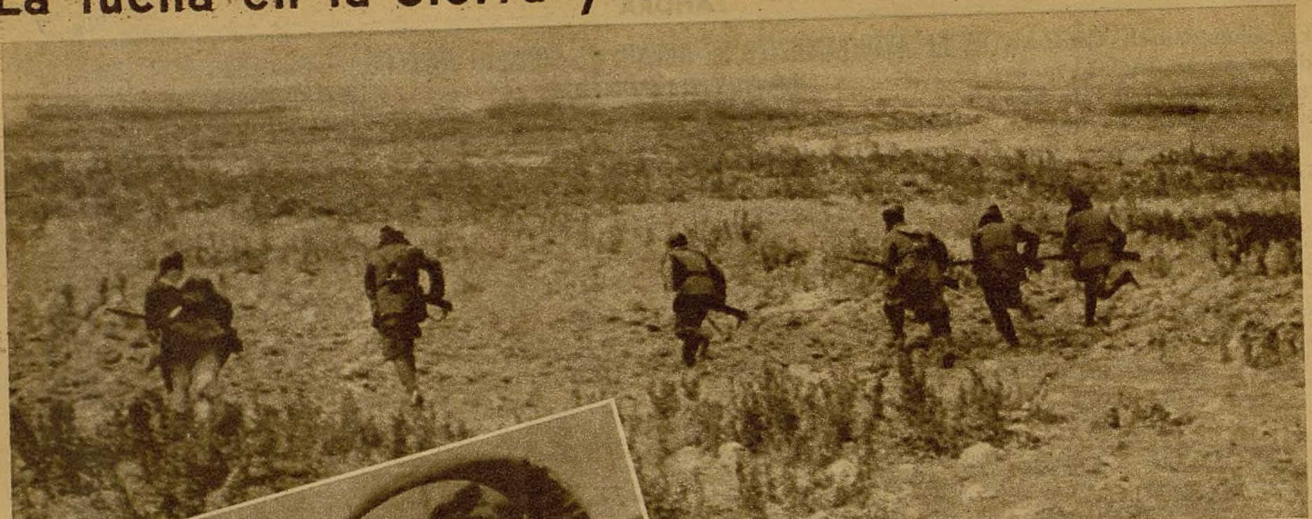
El avance de una guerrilla hacia posiciones que despejó eficazmente la Artillería. Una amplia extensión de terreno ha quedado abierta a nuestro dominio