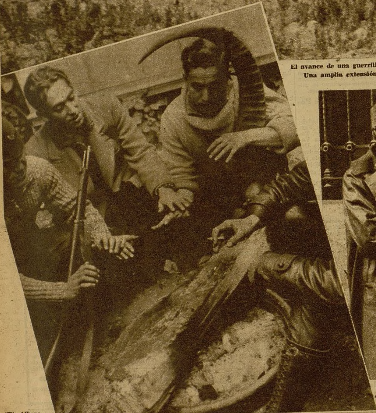
(Ft. Albero y Segovia)

Cuando la tarde, el frío se deja sentir intensamente en la Sierra. Los defensores de retaguardia, que gozan de un breve reposo, bien ganado en rudas horas de combate, se confortan en grata tertulia y al amor del fuego