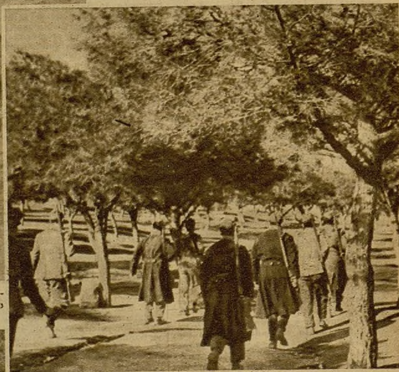
Después de un afortunado reconocimiento, en el que nuestras tropas hallaron abandonadas las posiciones del enemigo, que había batido intensamente la artillería, un grupo marcha a ocupar su puesto en las nuevas avanzadas