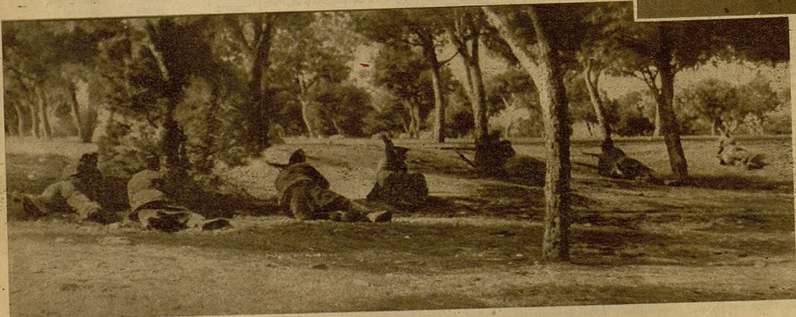
Soldados de una avanzada inutilizando con su fuego un intento de sorpresa de una concentración facciosa