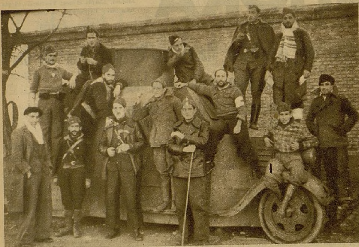
Estos soldados pertenecen a la columna de la Federación Española de Trabajadores de la Enseñanza. Son dinamiteros. Y se han comportado heroicamente en los recientes combates