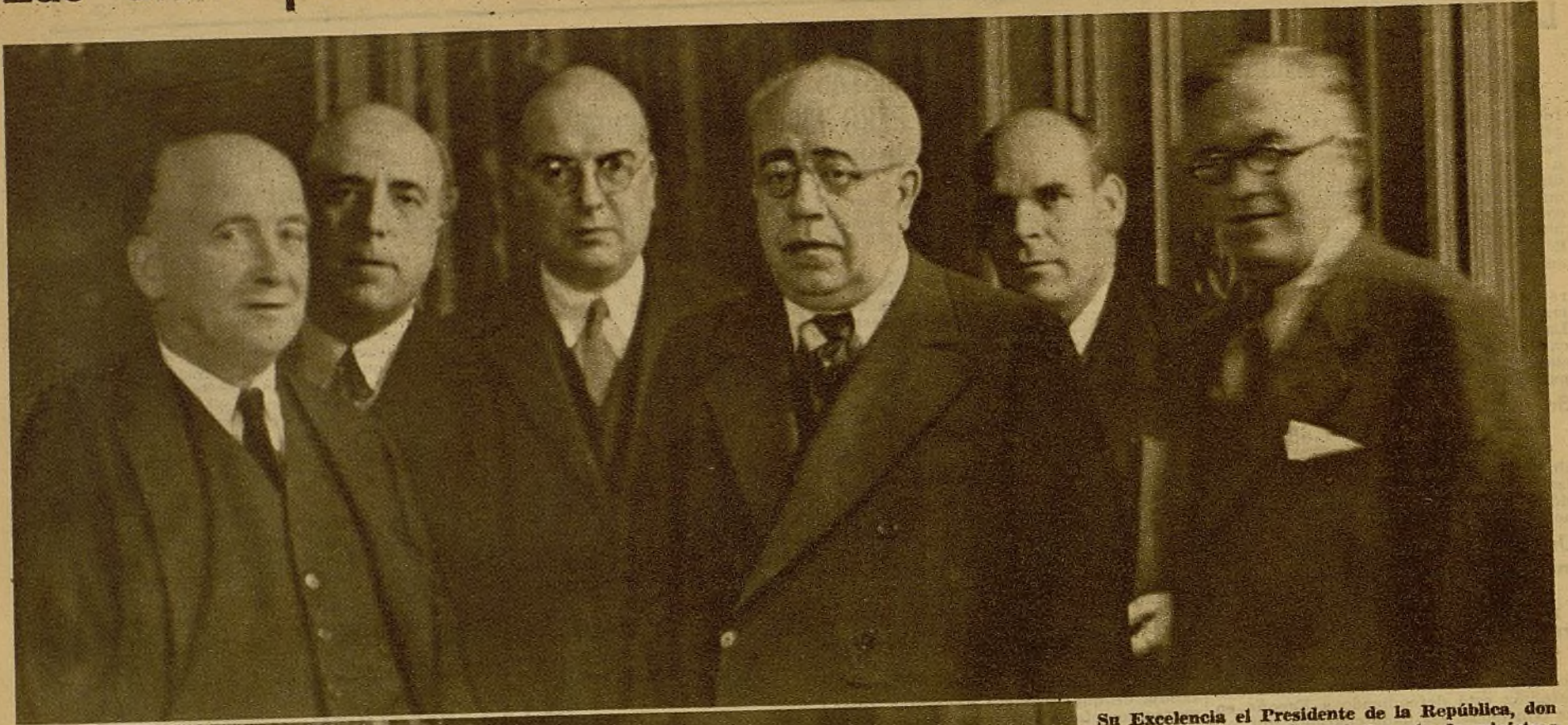
Su Excelencia el Presidente de la República, don Manuel Azaña, después del Consejo de ministros celebrado en el palacio de Benicarló, en Valencia, acompañado del jefe del Gobierno, señor Largo Caballero, y de los ministros señores Just, Esplá, De Gracia y Alvarez del Vayo