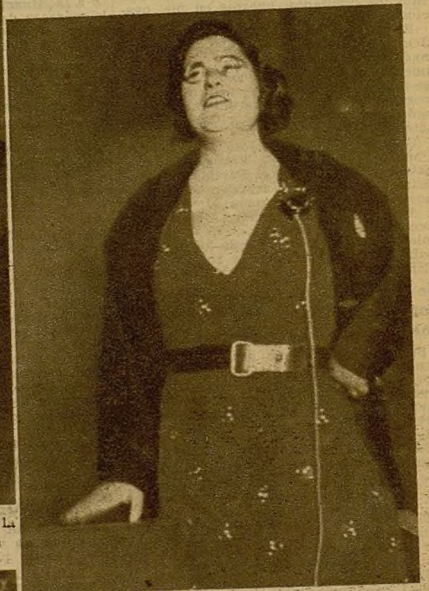
El ministro de Sanidad y Asistencia Social, Federica Montseny, ha dado una interesantísima conferencia en el teatro Apolo, de Valencia, sobre el tema "Los problemas de la revolución española". Concurrió al acto numerosísimo público, que aplaudió con entusiasmo a la ilustre oradora. He aquí a ésta en un momento de su disertación