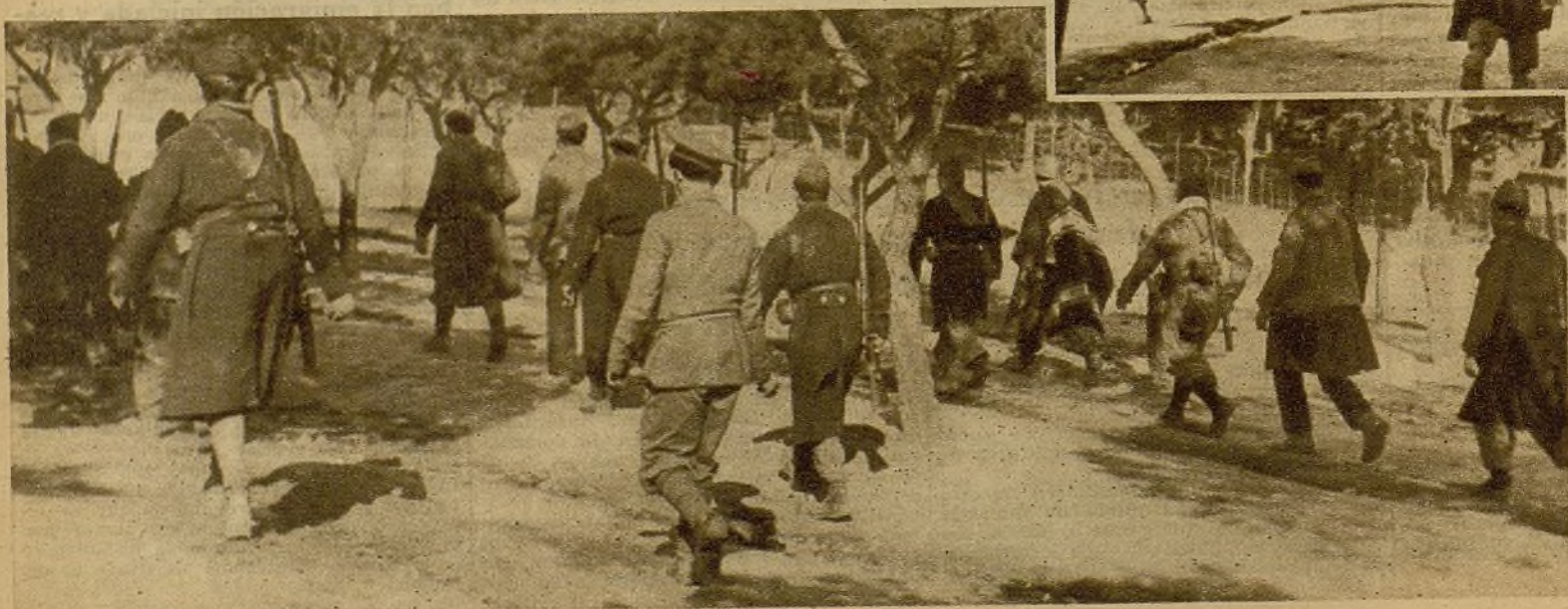
Un grupo de milicianos marcha a sustituir a sus compañeros, para relevarlos en su servicio de avanzada