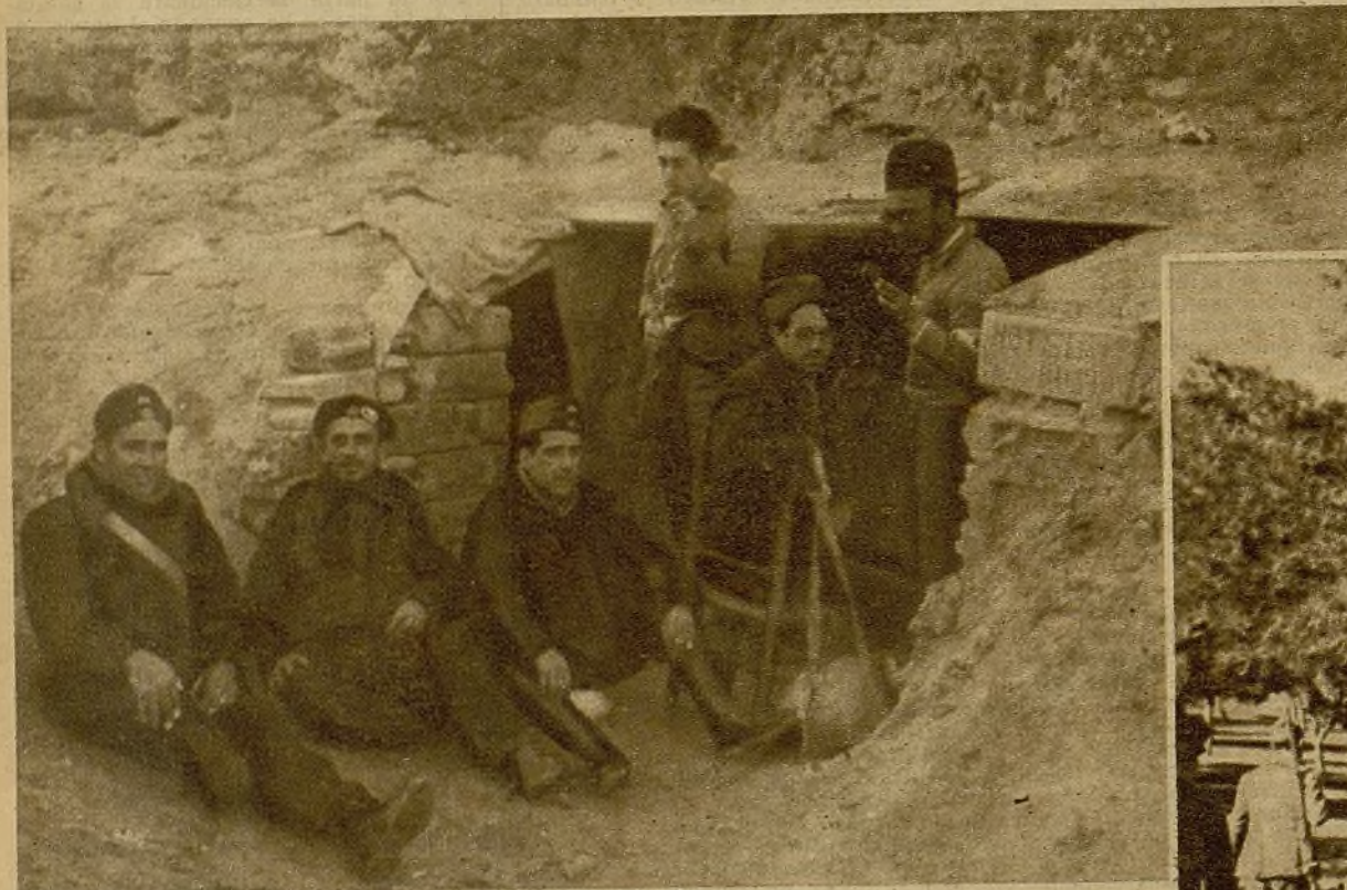
No se dirá que nuestros soldados se dejan vencer por las incomodidades del tiempo desahagible. Su iniciativa y su buen humor bastan y sobran. Ved, si no, de qué modo confortable han instalado el "Hotel Rusia"