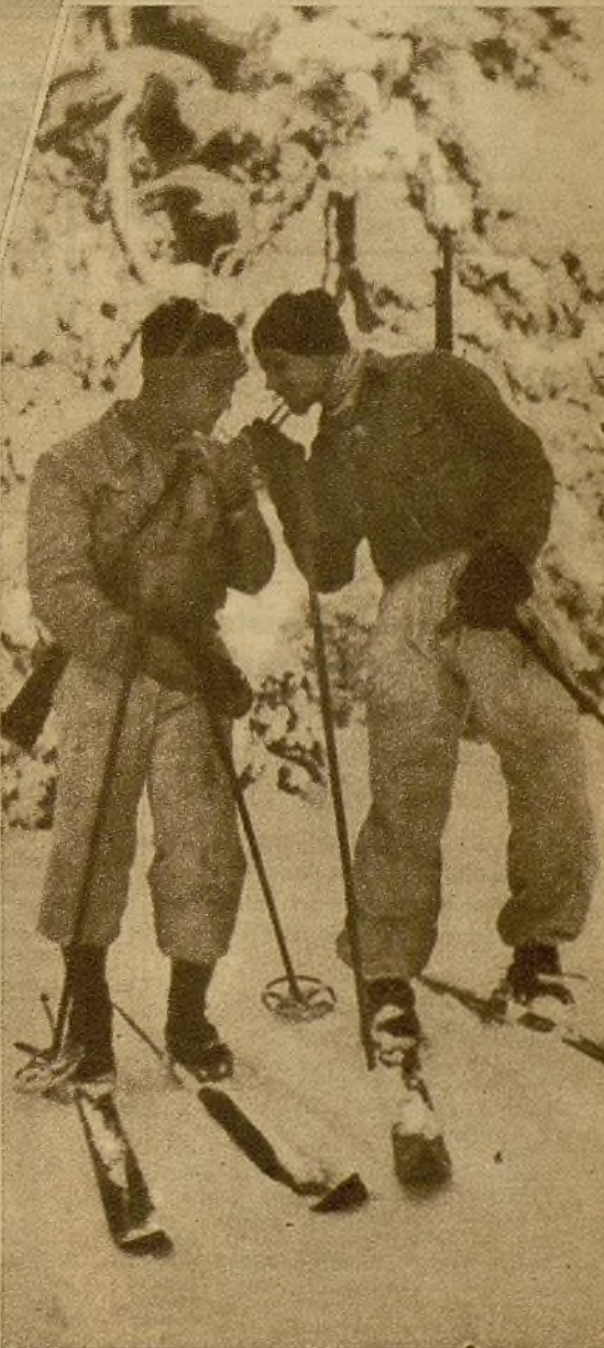
● Durante la marcha hacia las posiciones de primera línea, una pareja de guerreros alpinos, a la que sólo el fusil desvirtúa el aire de pacíficos excursionistas, se detiene un momento para encender sus "cachimbos" ➡