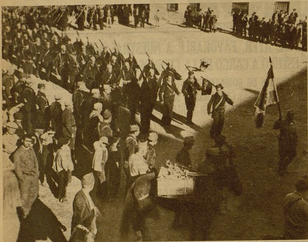
En el lugar en que se encontraban ayer acampadas las fuerzas del heroico teniente coronel Uribarri tuvo lugar la entrega de una bandera que regala a aquella unidad la Guardia Nacional Republicana. Las tropas desfilando con la nueva enseña