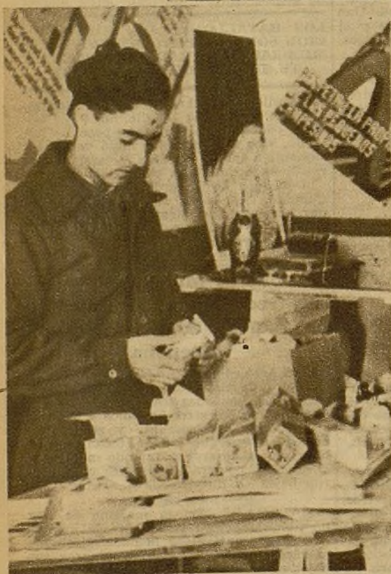
La Comisión del Socorro Rojo Internacional cuida de la provisión de los milicianos, lo mismo en artículos de primera necesidad que en el suministro de elementos de comodidad y aseo. Un miembro del Comité preparando un envío de pasta dentífrica y útiles para afeitar