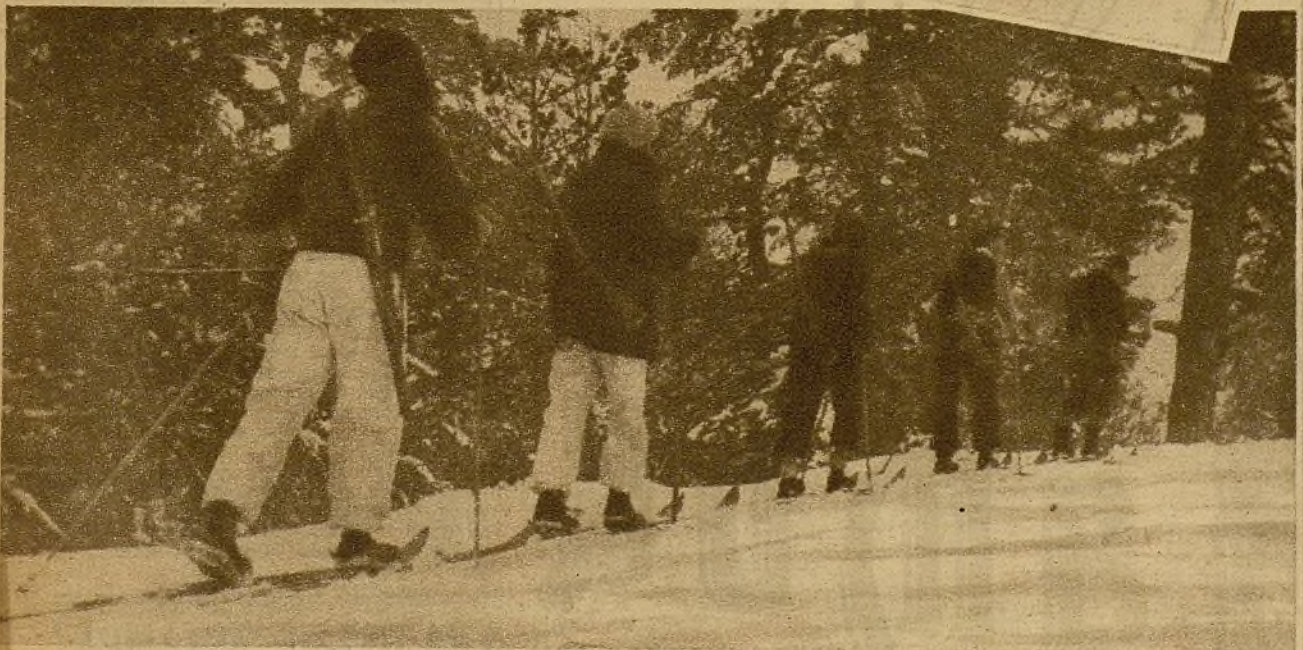
● Por el bosque nevado, resguardados por las tupidas filas de árboles, un grupo de soldados alpinos marcha a ocupar su puesto en una avanzadilla