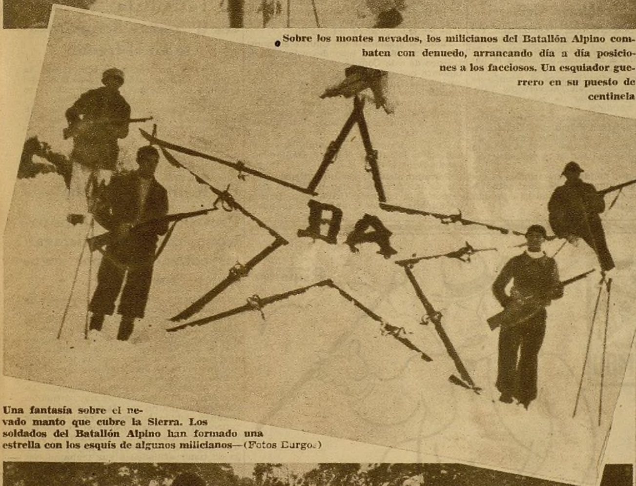
Una fantasía sobre el nevado manto que cubre la Sierra. Los soldados del Batallón Alpino han formado una estrella con los esquís de algunos milicianos