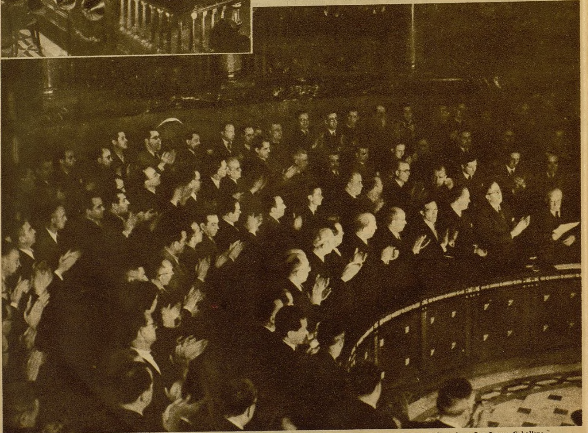
Ministros y diputados aplauden calurosamente el discurso leído en la sesión de Cortes por el presidente del Consejo, señor Largo Caballero