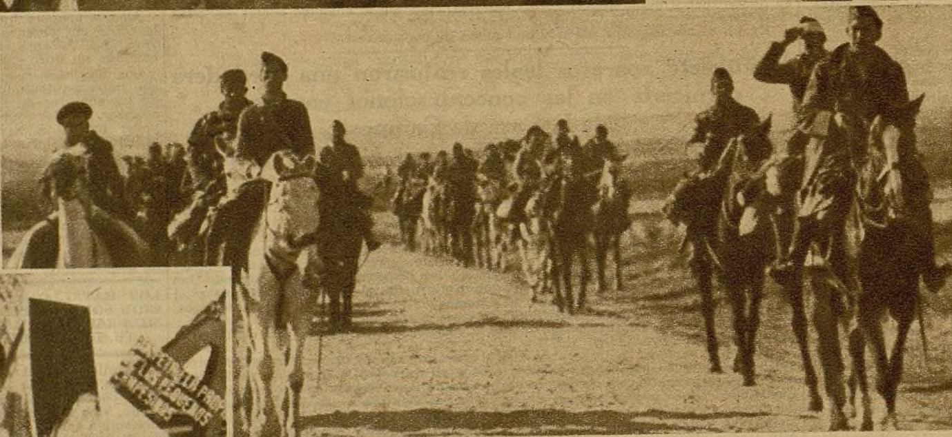
Una columna de Caballería en las proximidades de uno de los frentes del sector del Centro, dirigiéndose hacia las avanzadas