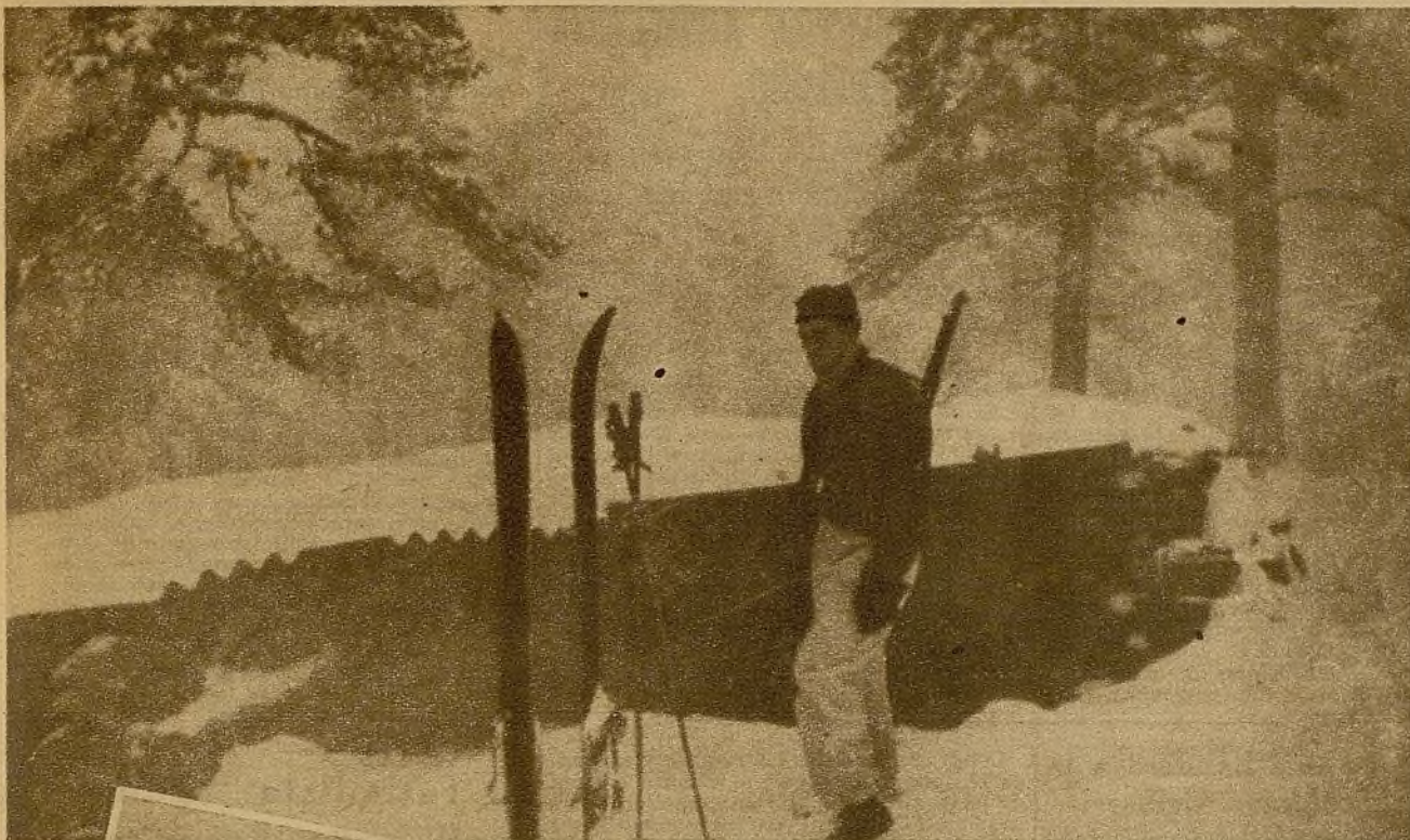
● Sobre los montes nevados, los milicianos del Batallón Alpino combaten con denuedo, arrancando día a día posiciones a los facciosos. Un esquiador guerrero en su puesto de centinela