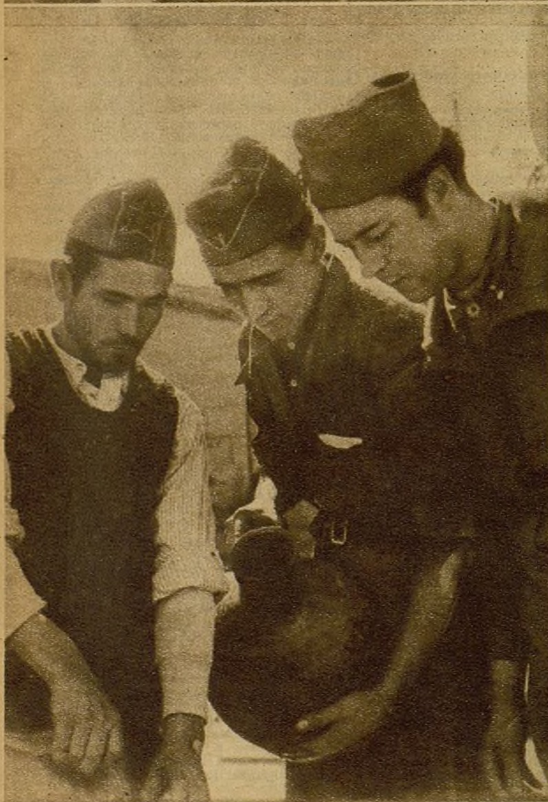
Estos milicianos han sido sorprendidos por el objetivo a la hora precisa de "aprovisionarse" de sus raciones de aperitivo. El cantarillo de vino tiene una generosa capacidad