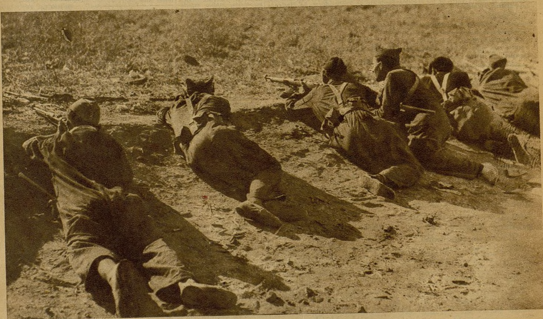
Sigue la rudísima lucha en el sector del Centro, siendo el empuje de nuestras tropas motor continuado y violentísimo de la marcha de la lucha. Varios soldados de una avanzada disparan, pegados a la tierra, contra el enemigo