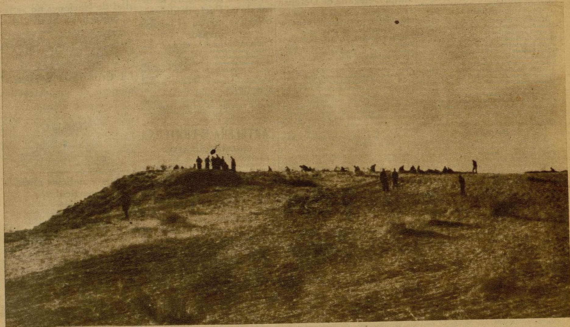
Denodadamente, con el arrojo propio de quien lucha por el triunfo de un ideal hondamente sentido, ocupan nuestros milicianos esta loma, desde la que se dominan posiciones enemigas