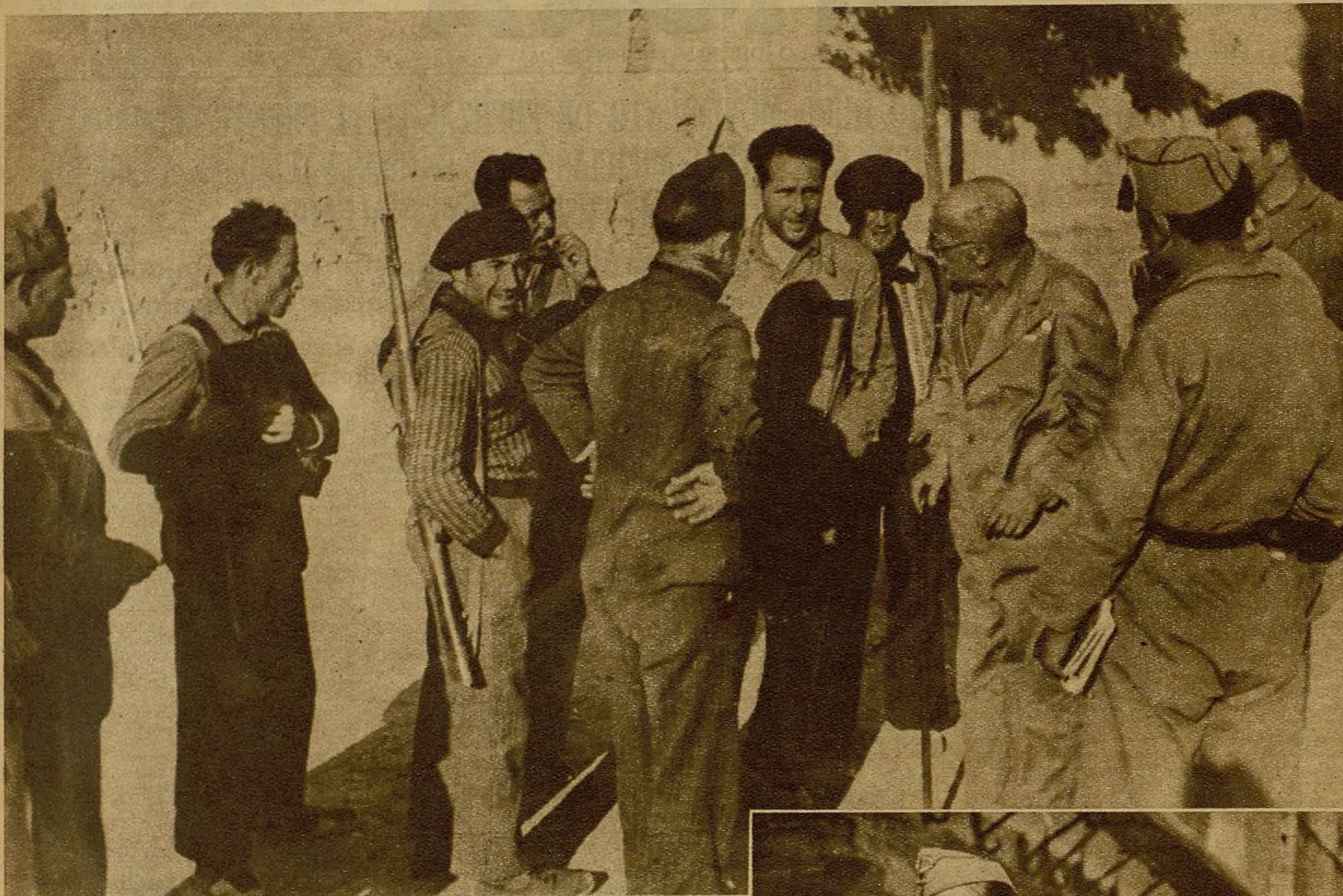
Uno de los jefes del sector Centro de Madrid cambia impresiones con oficiales y milicianos