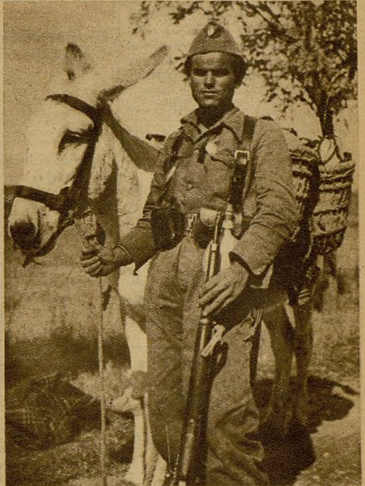
Una labor tan importante como la del combatiente: la del soldado que, bajo el fuego enemigo, lleva los aprovisionamientos a primera línea