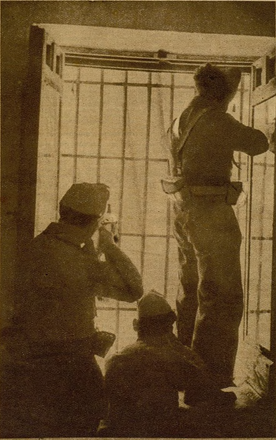
Tras la ventana de una casa, de la que fueron expulsados los facciosos, los milicianos enfilan sus tiros hacia las afueras del pueblo, por donde se retiran los rebeldes