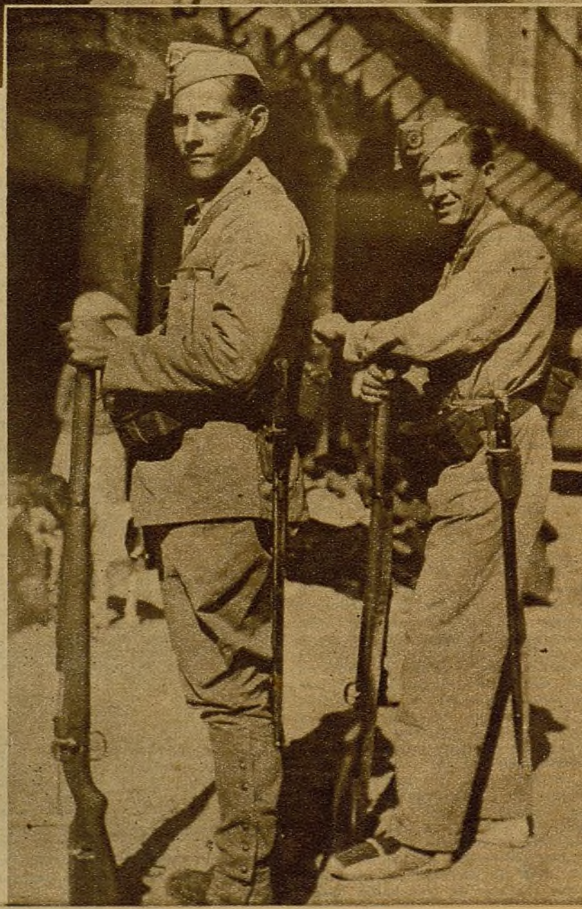
En todos los lugares avanzados la vigilancia se ejerce con estricto celo. Los soldados de guardia cuidan del campamento mientras los compañeros reposan