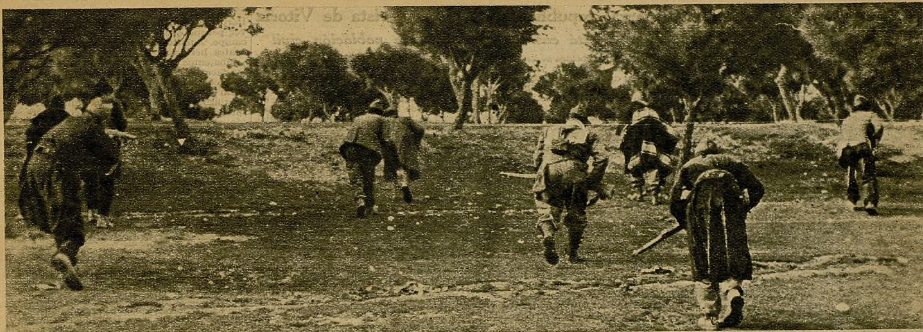
Después de haber mantenido durante toda la mañana un nutridísimo tiroteo con las vanguardias facciosas, y una vez inclinado a nuestro favor el desarrollo del combate, soldados de una avanzadilla del Ejército popular se adentran en el terreno, al amparo del arbolado, para ocupar nuevas posiciones