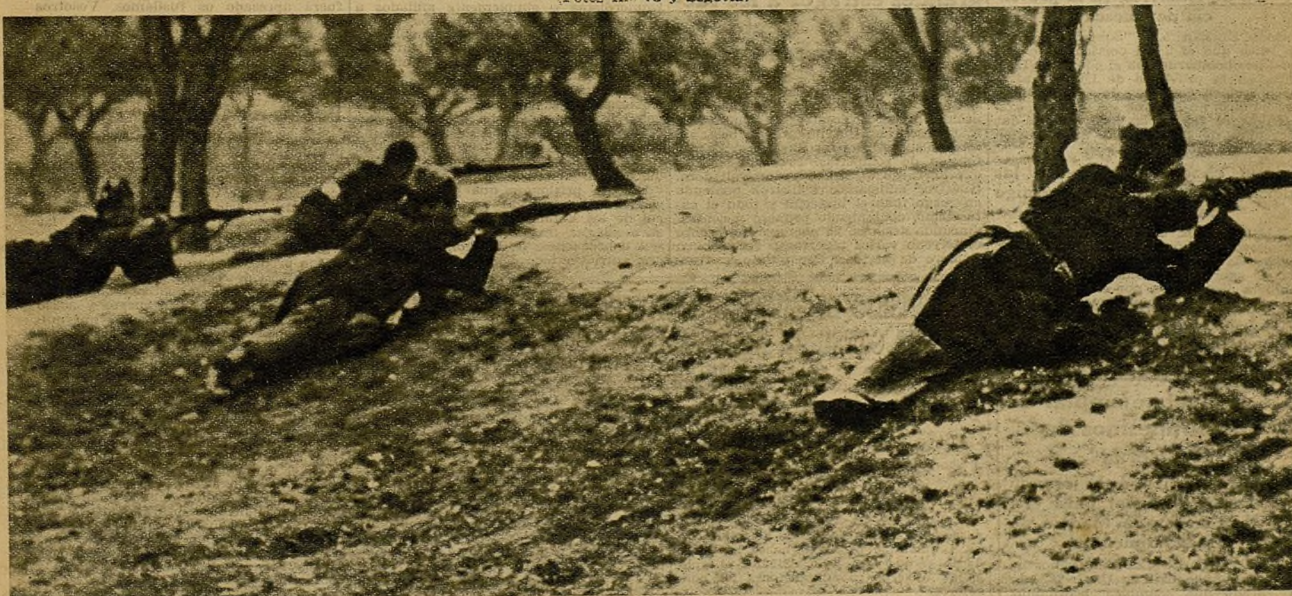
En el desarrollo de un combate, los milicianos, pegados a la tierra, mantienen un fuego incesante, haciendo infranqueables sus posiciones a las vanguardias facciosas que intentaban una sorpresa