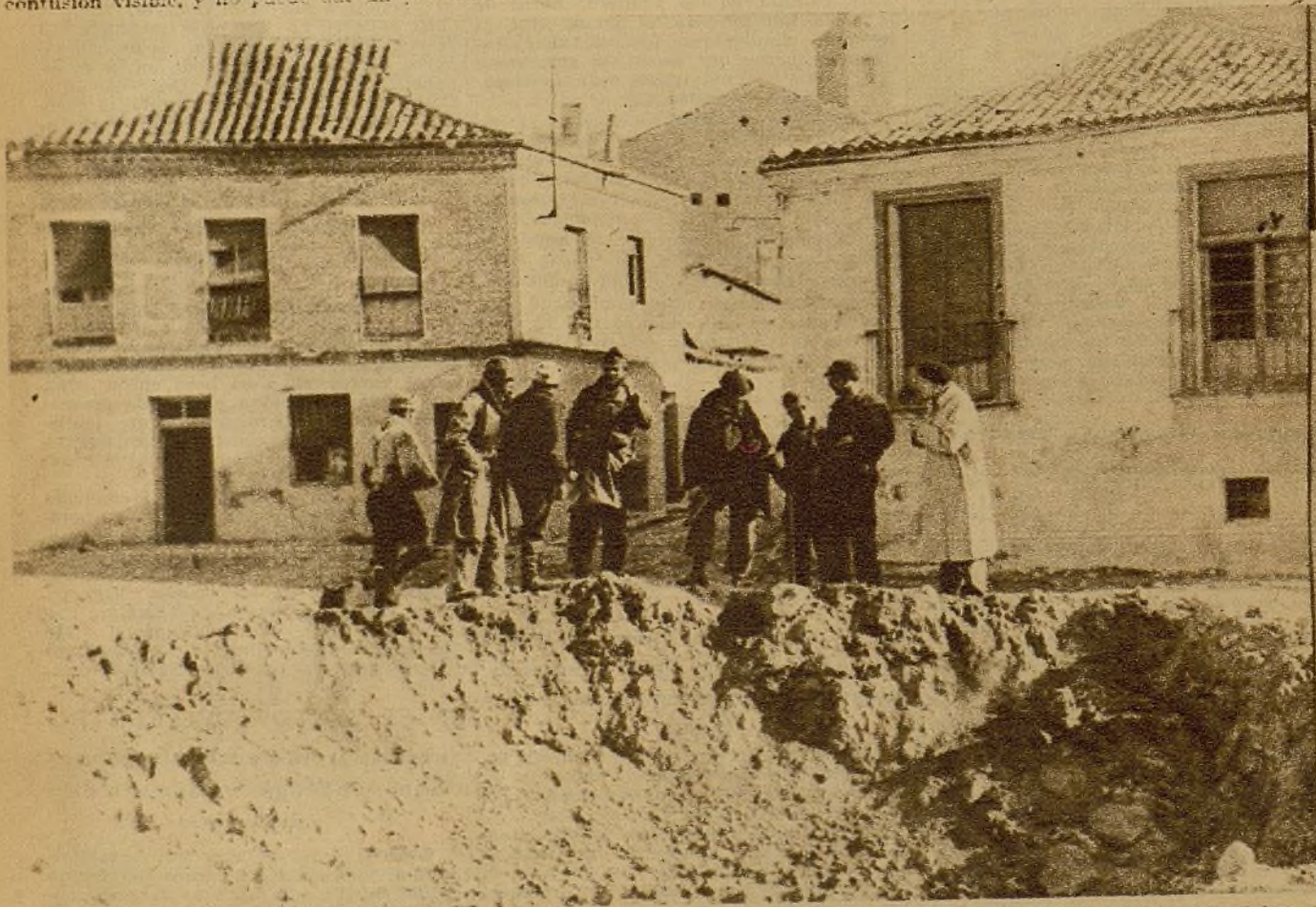
Estos son los efectos de uno de los bombardeos que han sufrido con singular entereza nuestros milicianos, dueños del pueblo de Pozuelo