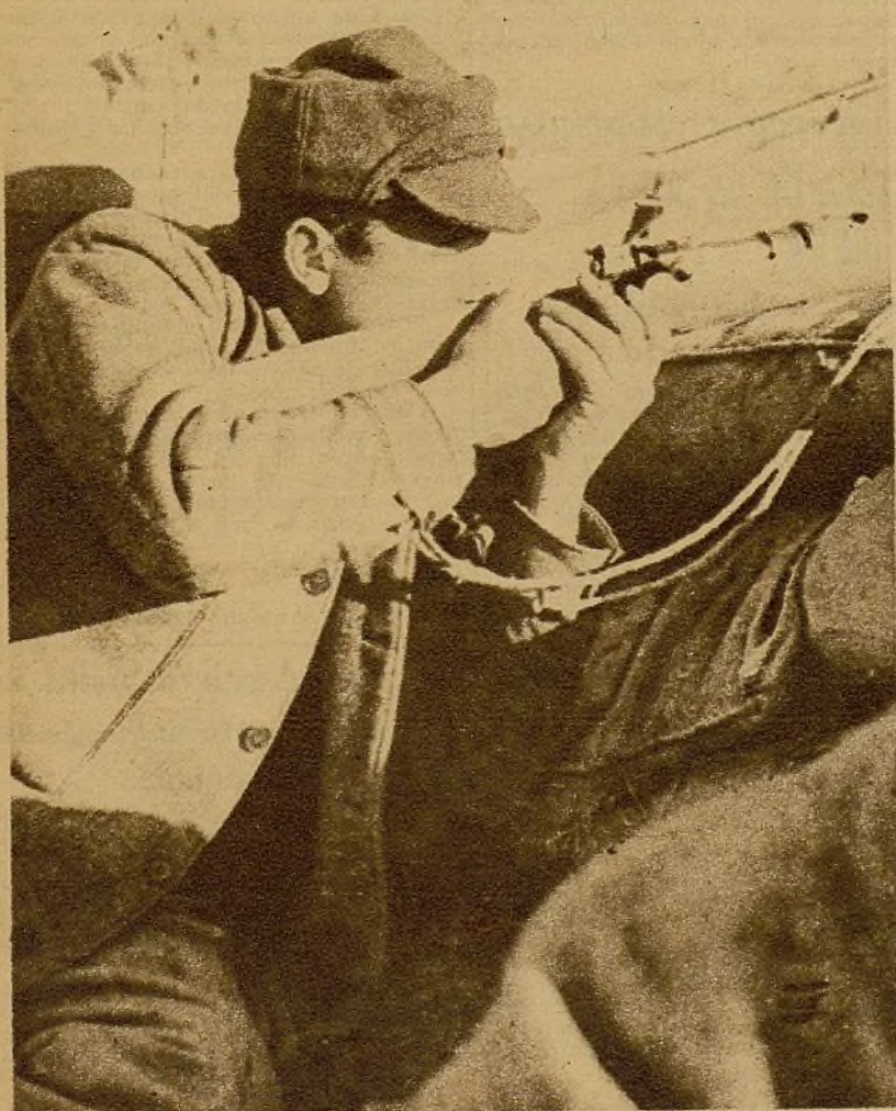
Indeflexible, sin temor alguno, puesto en su lugar, este fusilero, con sus camaradas, prohíbe absolutamente el avance de las avanzadillas facciosas