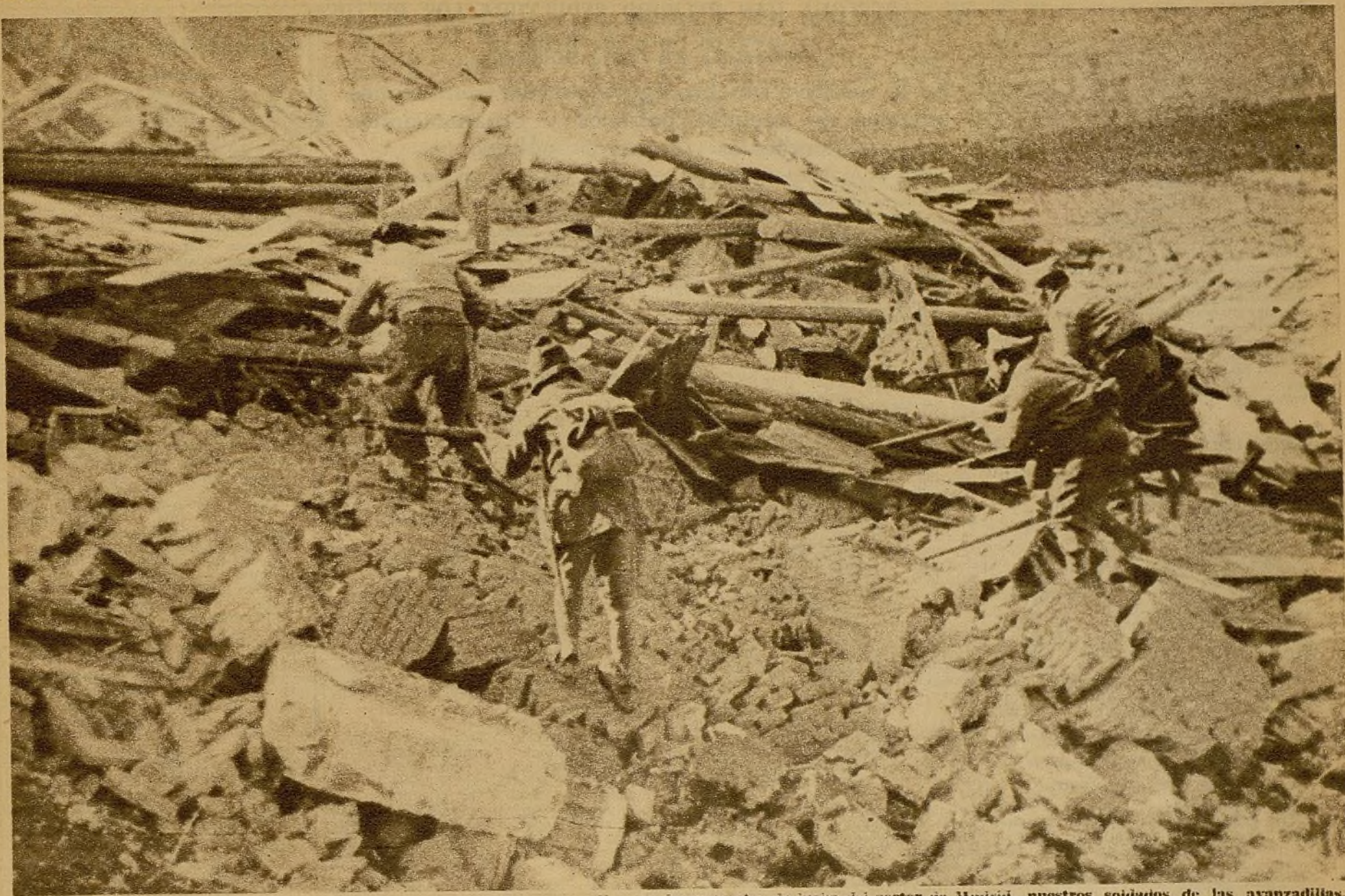
En uno de los puntos de lucha del sector de Madrid, nuestros soldados de las avanzadillas, después de haber hecho retirarse a los facciosos, se dirigen, en combinación con otras fuerzas, a las posiciones dominadas por su fuego, saltando entre los escombros de una casa que los rebeldes volaron en su huida