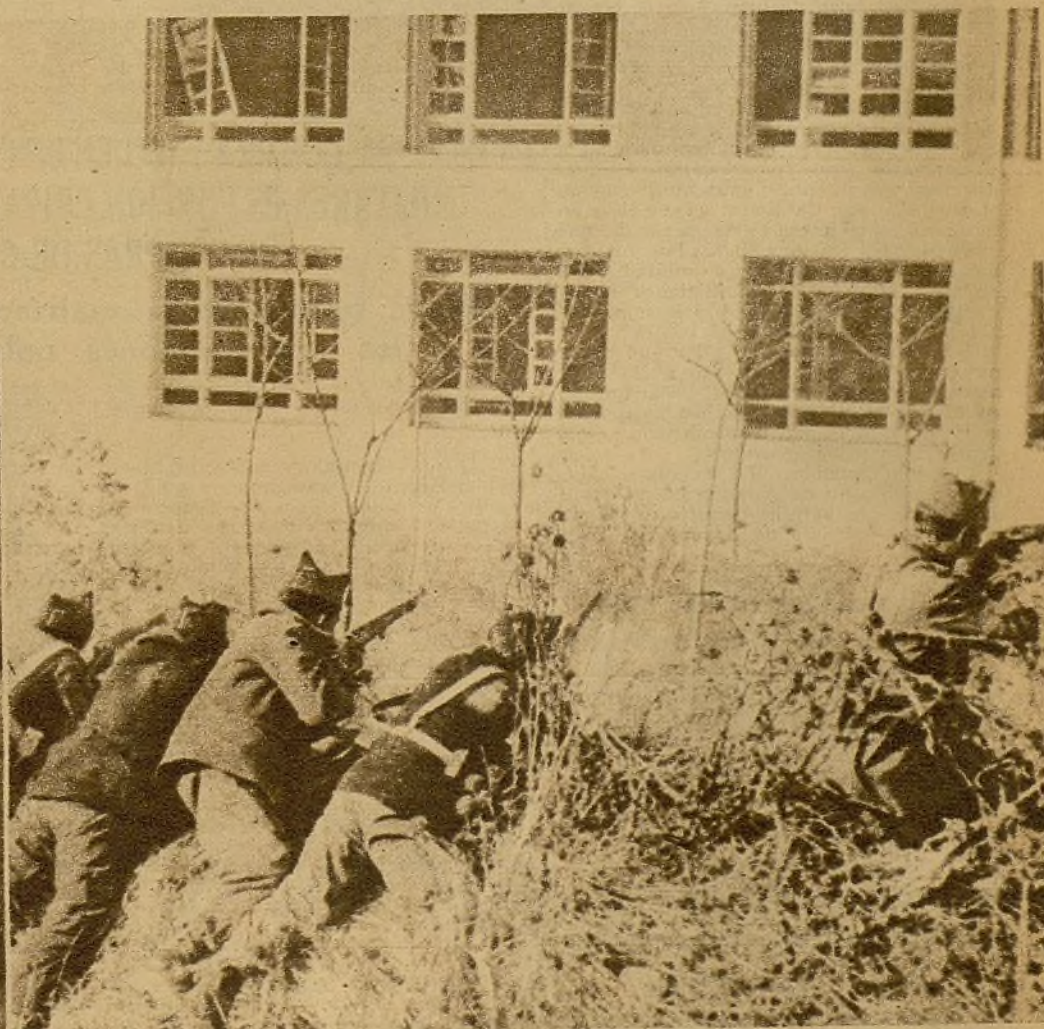
Nuestras fuerzas de choque tiroteando bravamente una casa del sector central, donde había quedado cercado un grupo enemigo que hubo de entregar las armas