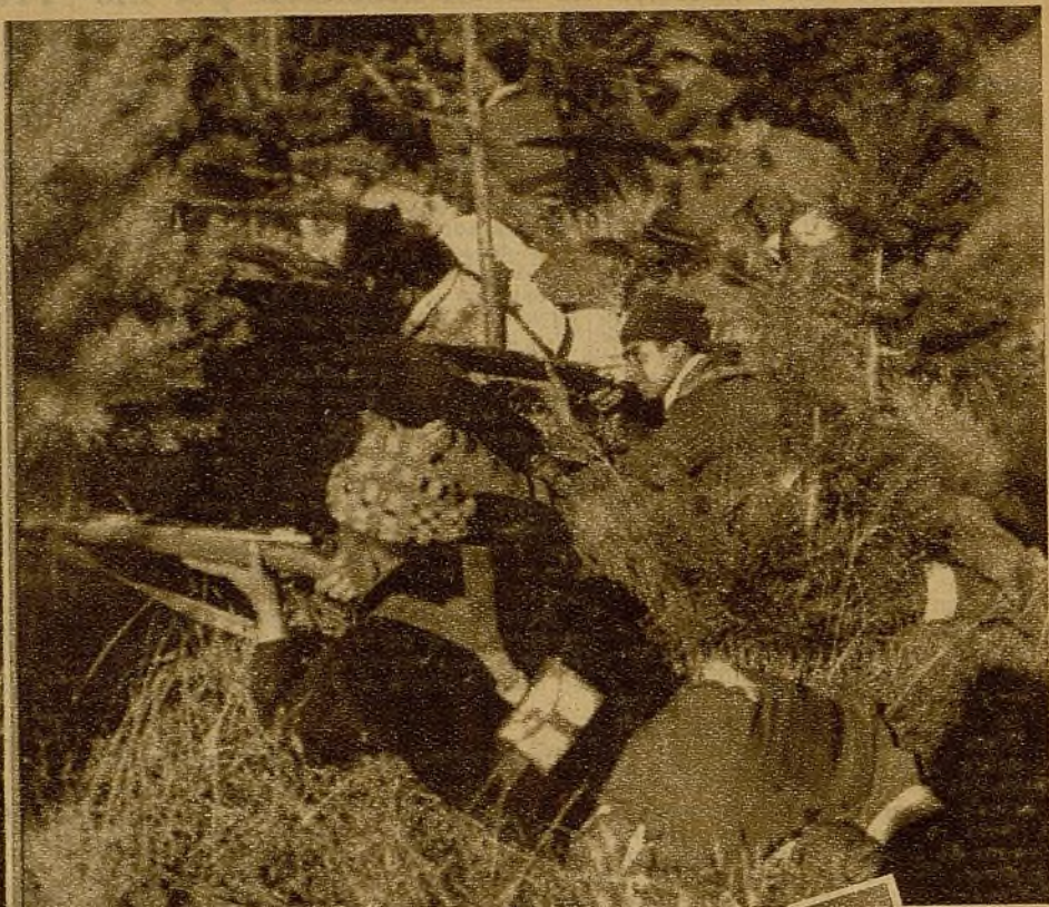
Protegidos por el espeso ramaje, pero con vision perfecta de las posiciones enemigas, nuestros tiradores enfilan al enemigo. (F. Yabero y Benítez)