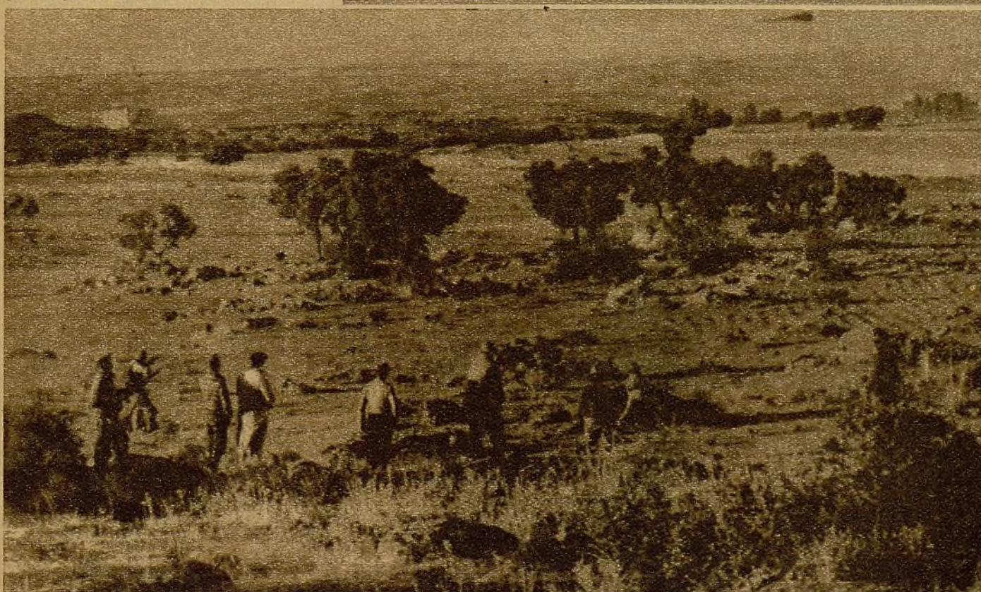
En la casa de la izquierda se encuentran ya las avanzadillas del enemigo...