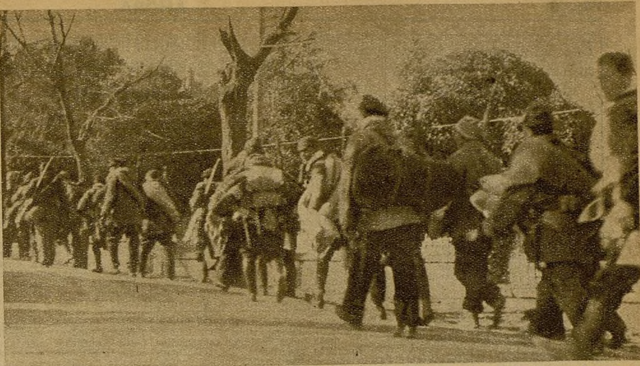
Una de las muchas columnas que salen de los lugares cercanos a Madrid para engrosar las filas de combatientes, que constituyen la muralla infranqueable para el fascismo, en los sectores del Centro