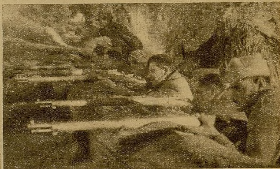
Los milicianos de una trinchera de primera línea conteniendo con sus nutridos disparos a una avanzadilla facciosa, que a primera hora de la mañana intentó un avance por sorpresa