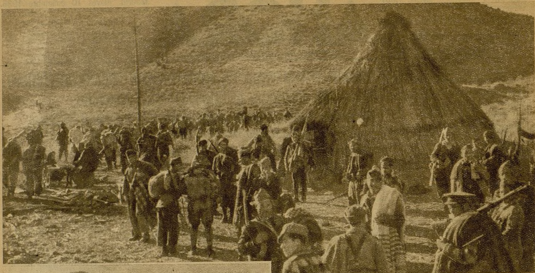
En este campamento se hallaban horas antes de ser impresionada la foto las avanzadas rebeldes. Un impulsivo avance de nuestros milicianos lo puso en su poder, después de una lucha en la que el enemigo sufrió duro quebranto