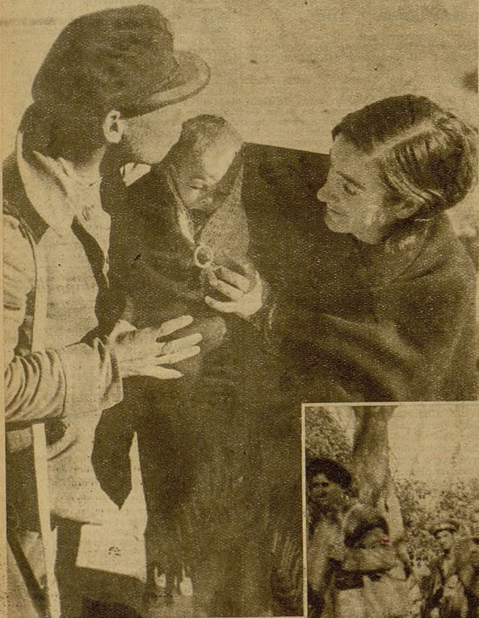
Después de una larga temporada en el frente, el miliciano vuelve a la ciudad para gozar unos días de descanso. En el cuartel le espera su esposa con el pequeño hijo que nació durante la ausencia paterna