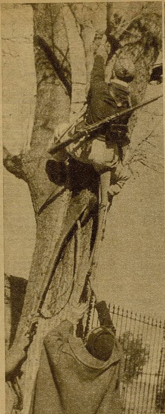
Impulsándolo con las culatas de los fusiles, estos soldados ayudan a su compañero a la escalada de un corpulento árbol, desde el que ha de ejercer vigilancia sobre las líneas enemigas del sector del Tajo