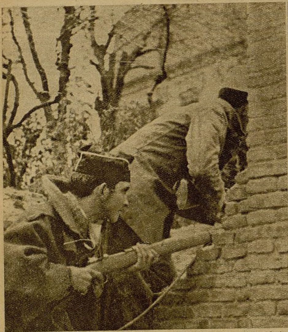
En tanto nuestras Milicias atacan de frente un edificio donde había buscado refugio un núcleo faccioso, otros soldados vigilan la parte posterior de la casa para evitar que los rebeldes se fuguen