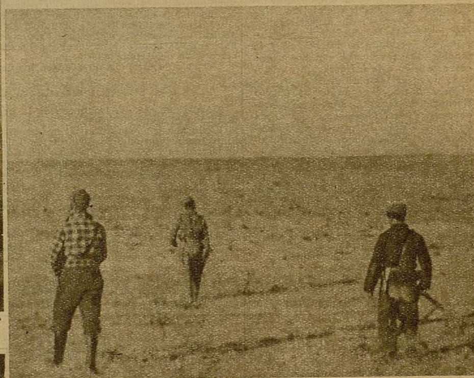
La descubierta al amanecer... Las escuadras de milicianos avanzan, fusil al brazo