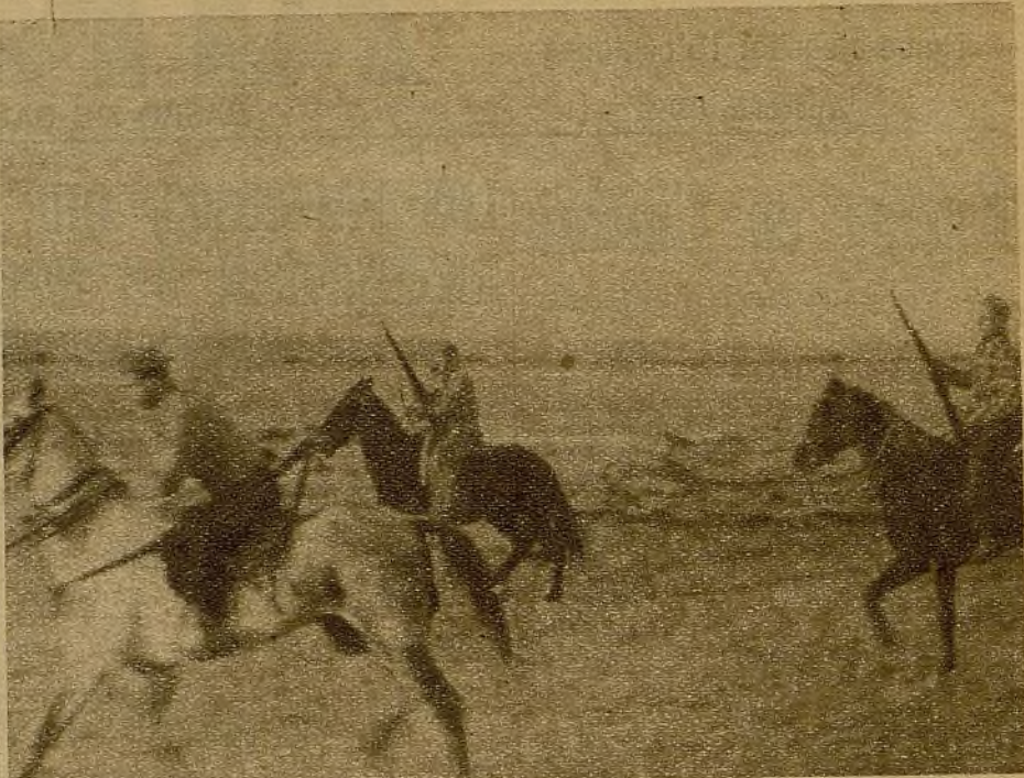
Una sección de Caballería de las Milicias extremeñas en un reconocimiento por los campos de Toledo