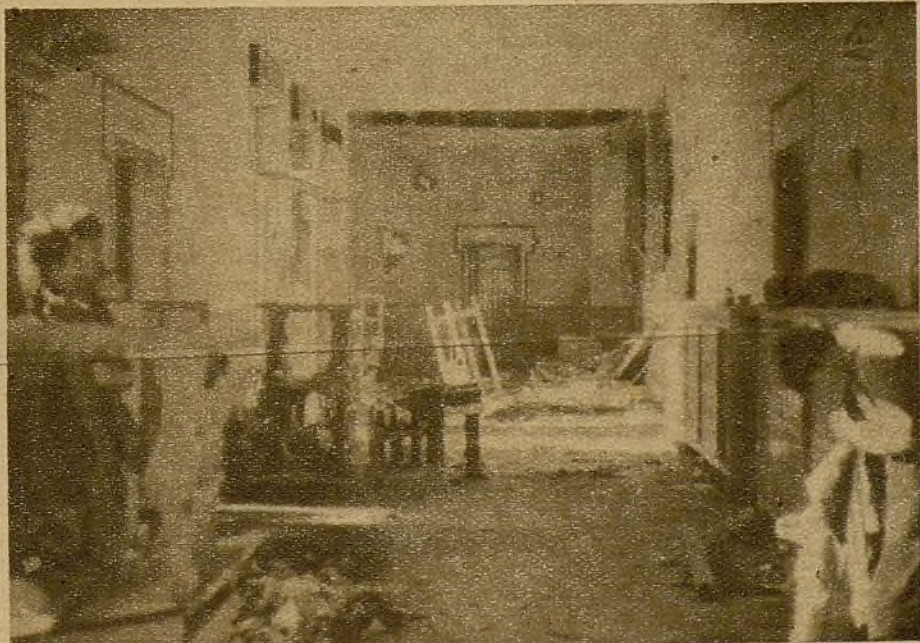
La barbarie fascista no respeta ni las escuelas. Un grupo escolar, dentro del casco de Madrid, destrozado por la metralla

—Ustedes creerán que aquí estamos defendiendo a España. Pero en realidad, nosotros, franceses..., defendemos aquí a Francia. Si España fuese dominada por el fascismo, Francia dejaría de existir