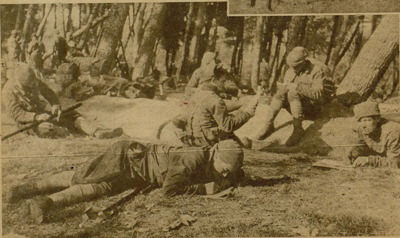
Nuestros bravos milicianos aprovechan una tregua en la pelea para entregarse a la tarea de comunicarse con los familiares que, allá lejos, esperan con ansiedad noticias de los ausentes