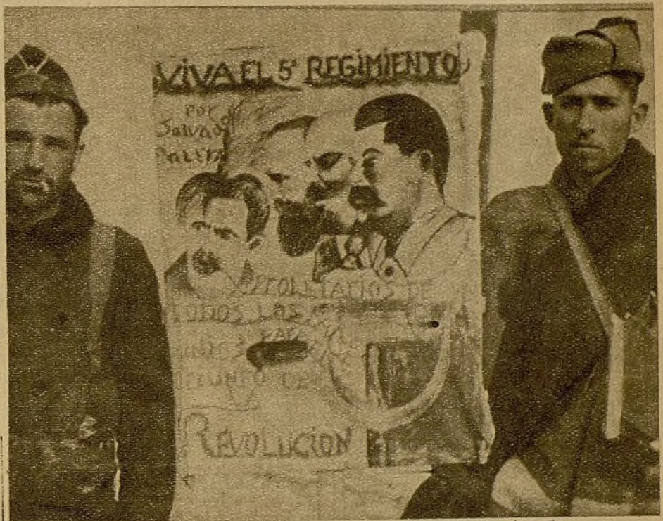
Nuestros milicianos no olvidan la propaganda de los idearios que defienden en las trincheras. Aquí tenemos un alusivo cartel de las Milicias del 5.º Regimiento

no los supera el enemigo. Con el coman- dante Lizárraga hemos recorrido todo el sector, y allí, a doscientos metros de las avanzadillas, los cadáveres de unos le- gionarios, que llevan allí algunos días, son muestra evidente de sus fracasos. Es- te sector es estampa auténtica de la ho- rrible guerra. Apenas queda otra cosa en pie que el miliciano impasible. En sus ataques, el enemigo ha empleado la avia- ción, que ha lanzado con la trilita bom- bas fumíferas para localizar las trínche- ras; la artillería, que aprovechó bien pronto la referencia del humo para ba- tir las trincheras; los tanques y, al final, las oleadas de moros y legionarios... To- do lo han resistido nuestras tropas. Pe-