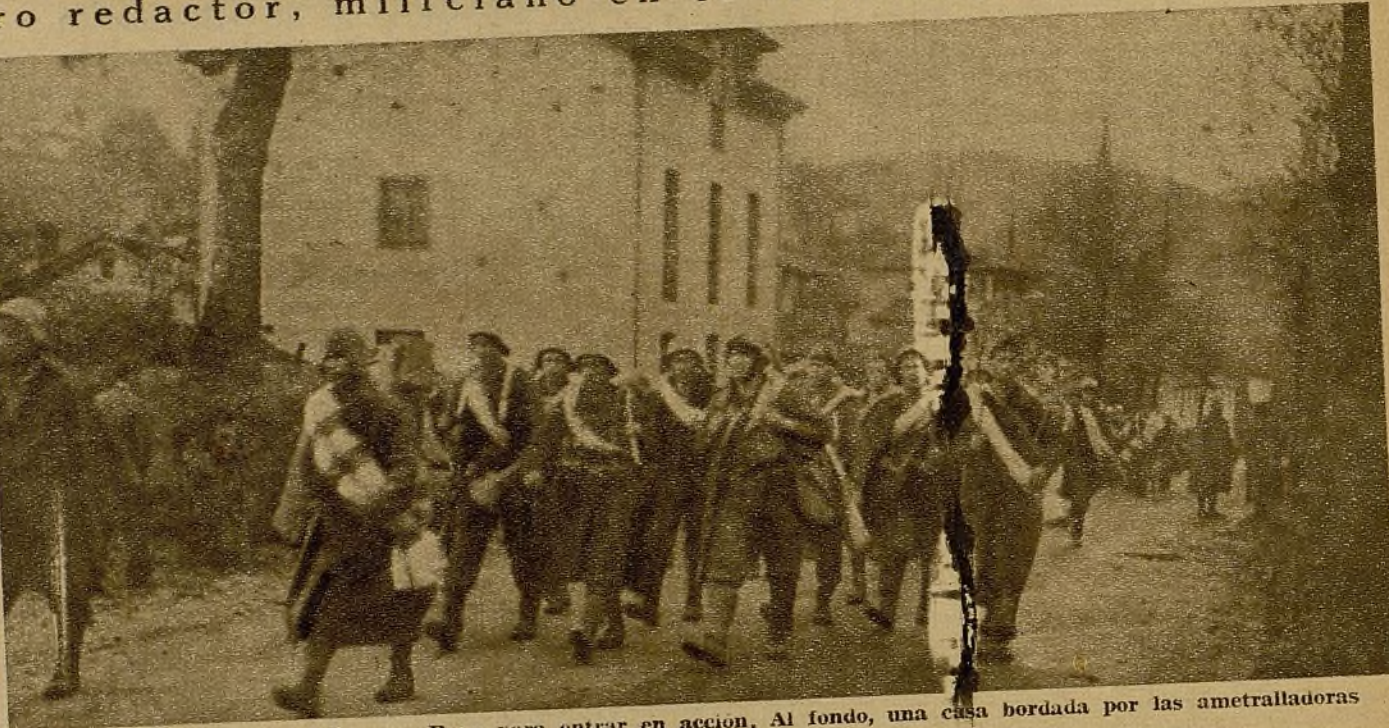
El batallón Bázana al llegar a Bayo para entrar en acción. Al fondo, una casa bordada por las ametralladoras

Ya van algunos días que se siente roncar por entre las nubes a nuestros pá-