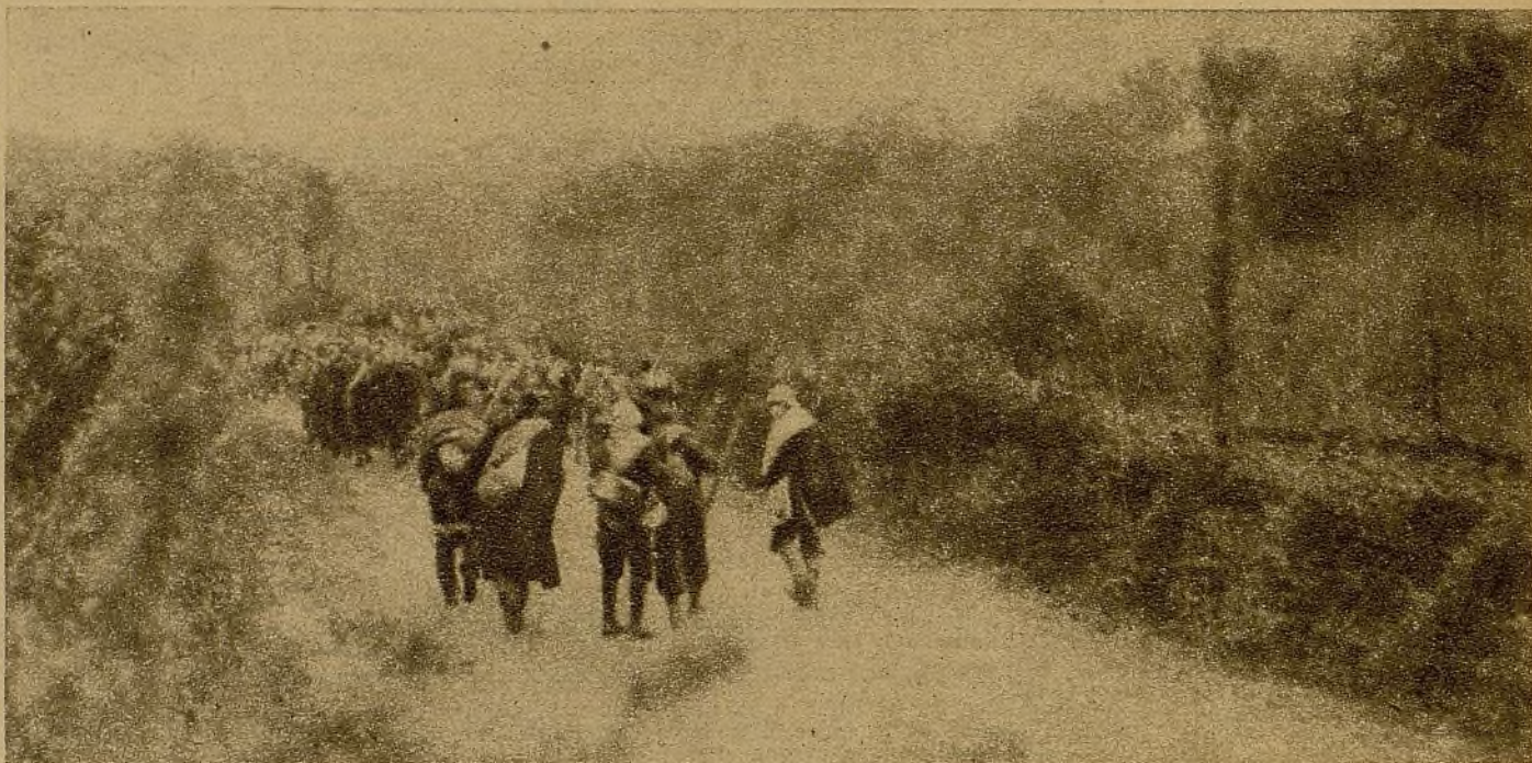
El batallón Otero avanzando en columna de marcha para tomar parte en la acción de la Loma de los Pinos

Lo que resultó bien fué la persecución de los piratas que realizaron los aviones. En cuanto llegaron, el "España" comenzó a soltar cortinas de humo para proteger su retirada y la de sus acompañantes y todos juntos huyeron a toda máqui-