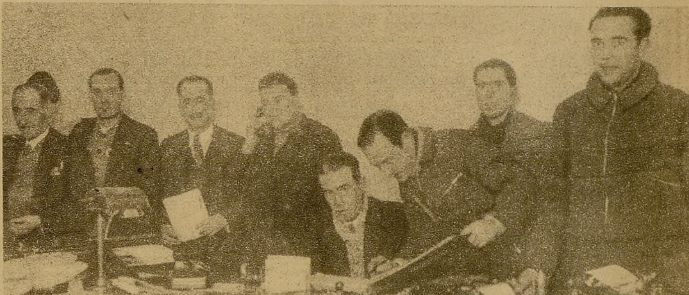
Responsables de Investigación y Vigilancia del distrito de Buenavista

Así ha transcurrido un mes. En estos treinta días en que Madrid vive las más angustiosas páginas de su historia de pueblo amante de la Libertad, sólo los que por imperativo del deber profesional estamos en contacto con las autoridades gubernativas sabemos de la gigantesca labor realizada por Santiago Carrillo. Y no era tarea sencilla. Tenía mil complicados reductos donde se agazapaban, prestos a saltar al primer descuido, enjambres de fascistas, de monárquicos, de gentes, en fin, desafectas al régimen, que no tenían más que ojos para mirar y oídos para escuchar cuándo era llegado el momento de entrar en sus funciones perturbadoras y coautoras del bárbaro atropello que las falanges de moros y aventureros de Franco y Mola trataban de realizar sobre Madrid. Nada de esto ha pasado. Desde el primer instante, Santiago Carrillo establece a rajatabla lo que pudiéramos llamar vigilancia única. No se ven cumpliendo tan delicada misión más que a las fuerzas gubernativas y a las Milicias de Retaguardia, nombradas y controladas por el Ministerio de la Gobernación. Otro de los magníficos aciertos de Santiago Carrillo fué unificar los servicios de investigación. Automáti-