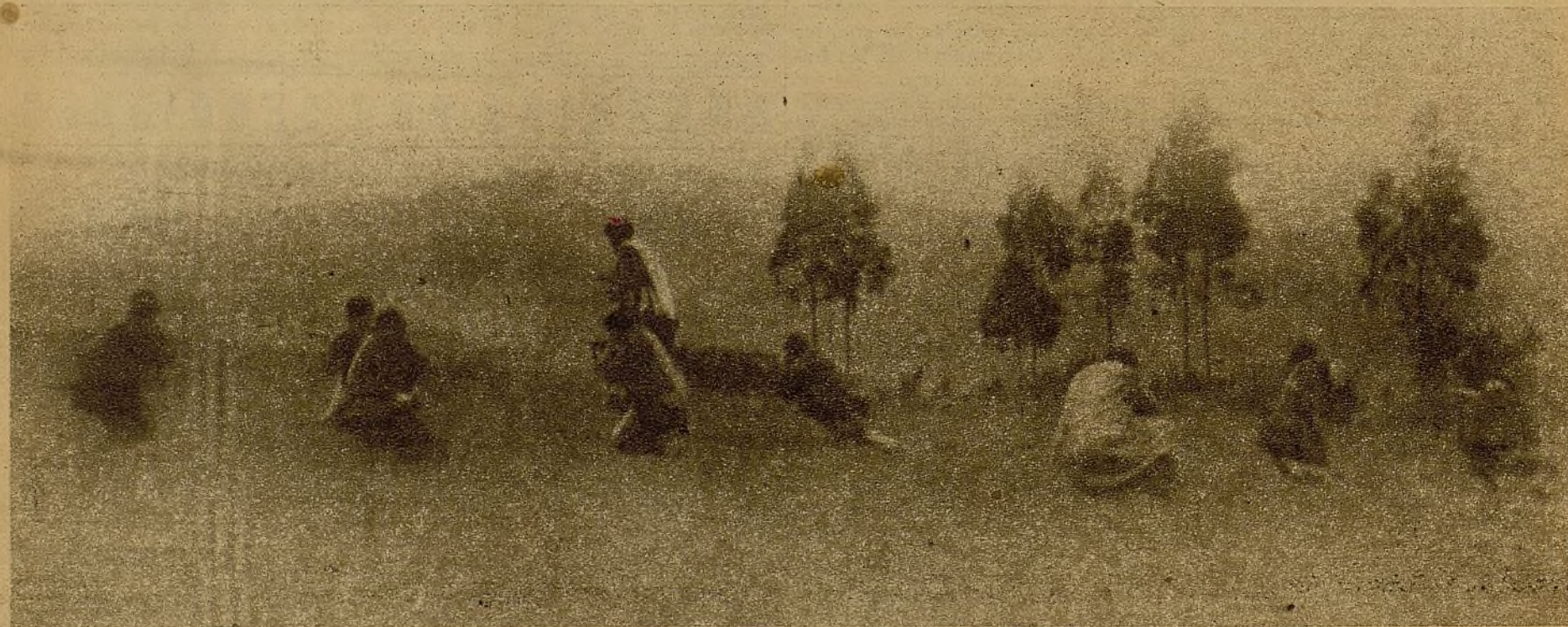
Desplegándose en guerrilla hacia la Loma de los Pinos

ciones de volver a realizar estos viajes. Este bombardeo o conato de bombardeo más bien, ha sido hecho, sin duda, para simular un desembarco. Pensaban