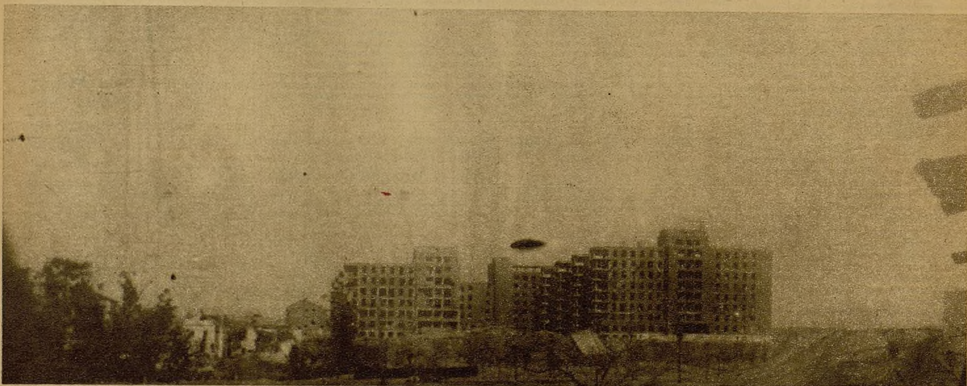
El Hospital Clínico, en la Ciudad Universitaria. También aquí los facciosos han sufrido tremendas bajas, cada vez que han intentado salir de él