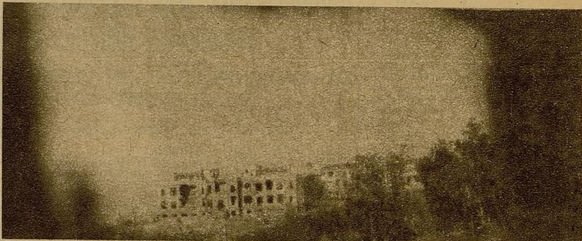
Una de las zonas El Instituto Rubio, en la Ciudad Universitaria. En su interior han quedado sepultados numerosos facciosos... (Fotos Marina)

Una de las zonas del Parque del Oeste donde se han estrellado, sucesivamente, todos los ataques iniciados por el enemigo → (Foto Marina)