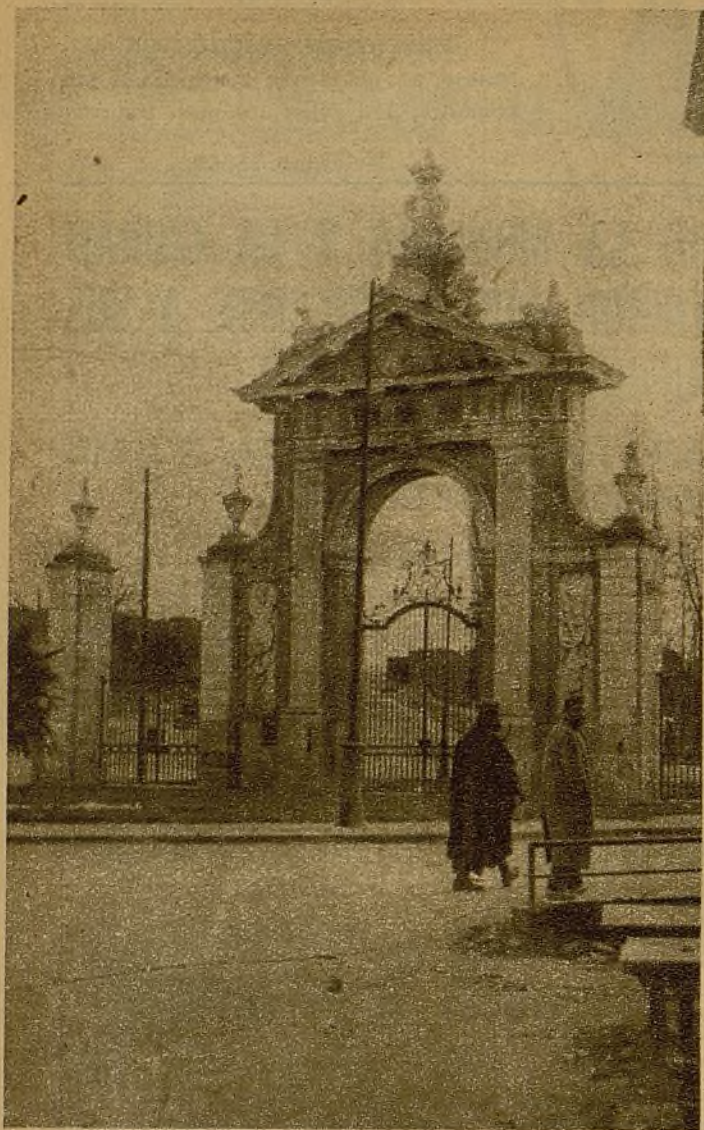
Puerta de Hierro. Por aquí no pasará el enemigo. Las Milicias tienen el paso bien defendido...