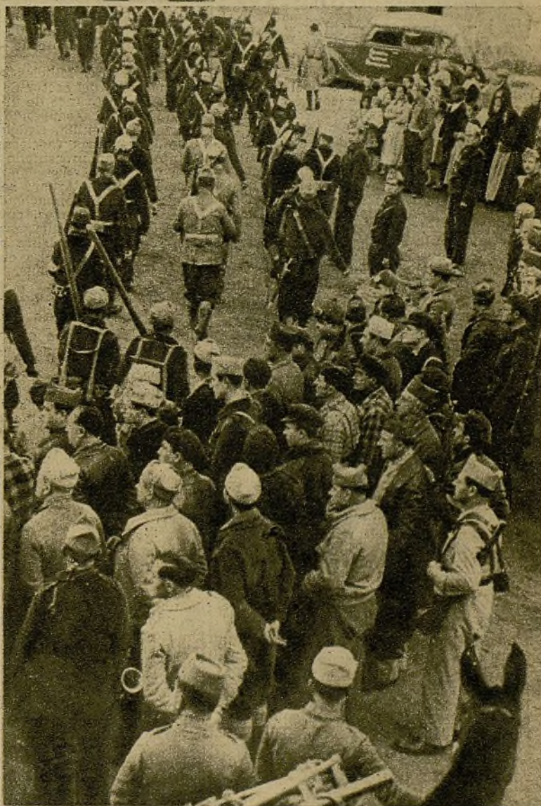
Fuerzas de una columna que ha operado con gran bravura y eficacia en uno de los sectores del Centro desfila ante sus jefes al regreso a su base

No hacen falta muchos requisitos en los "comedores" improvisados del frente. En ellos no hace falta más que una circunstancia, que se da invariablemente: el apetito. Ved a este grupo haciendo cumplido honor al contenido de su caldera