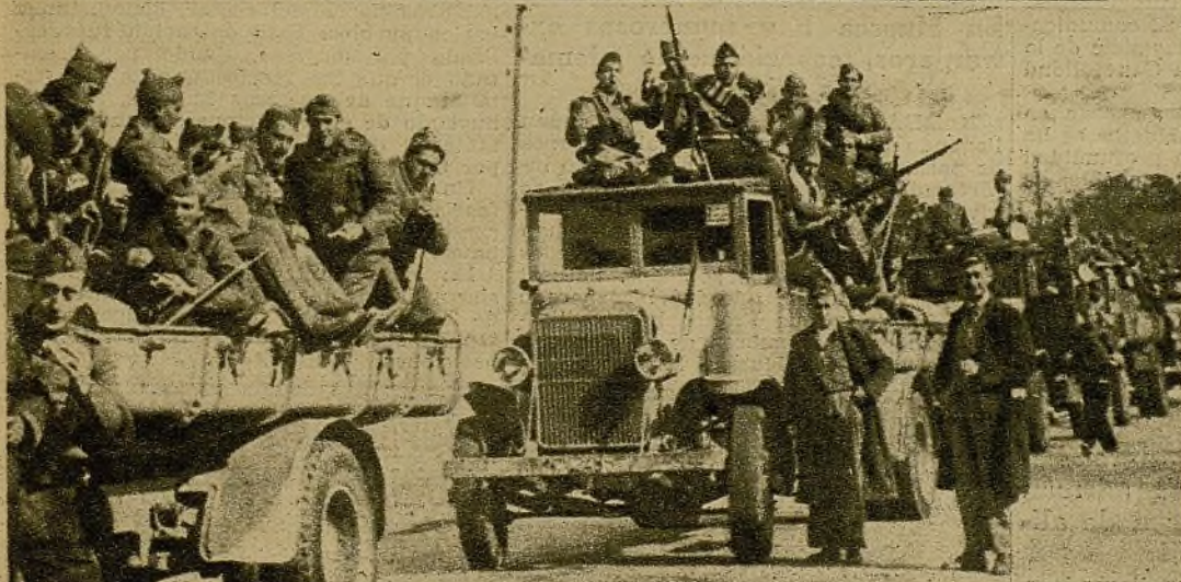
Una expedición militar destinada a uno de los lugares de los frentes del Centro, preparada para emprender la marcha

La benemérita labor de la mujer en la retaguardia es digna de los más altos elogios. Centenares de talleres como este que aparece en la foto funcionan en Madrid con febril actividad para la confección de prendas de abrigo destinadas a los milicianos