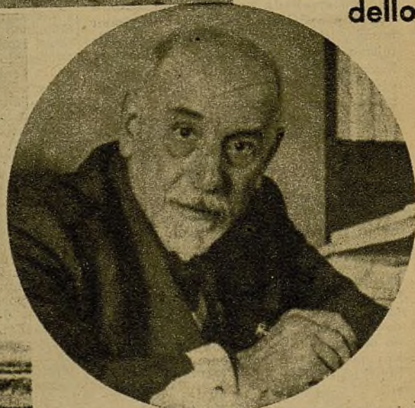
En Roma ha fallecido el insigne escritor, de fama mundial, Luigi Pirandello. Contaba sesenta y nueve años. Literariamente era un valor excepcional, por su fecunda concepción, su agudeza de ingenio y su gran maestría y originalidad de procedimiento. Sus obras han sido traducidas a casi todos los idiomas