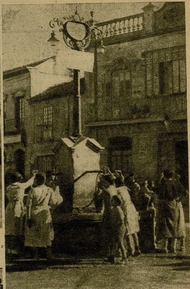
La tranquilidad en los pueblos del sector del Tajo que han sido reconquistados por nuestras tropas se ha restablecido por completo. Mujeres y niños, reintegrados a sus hogares, llenan de agua sus cacharros en la fuente pública