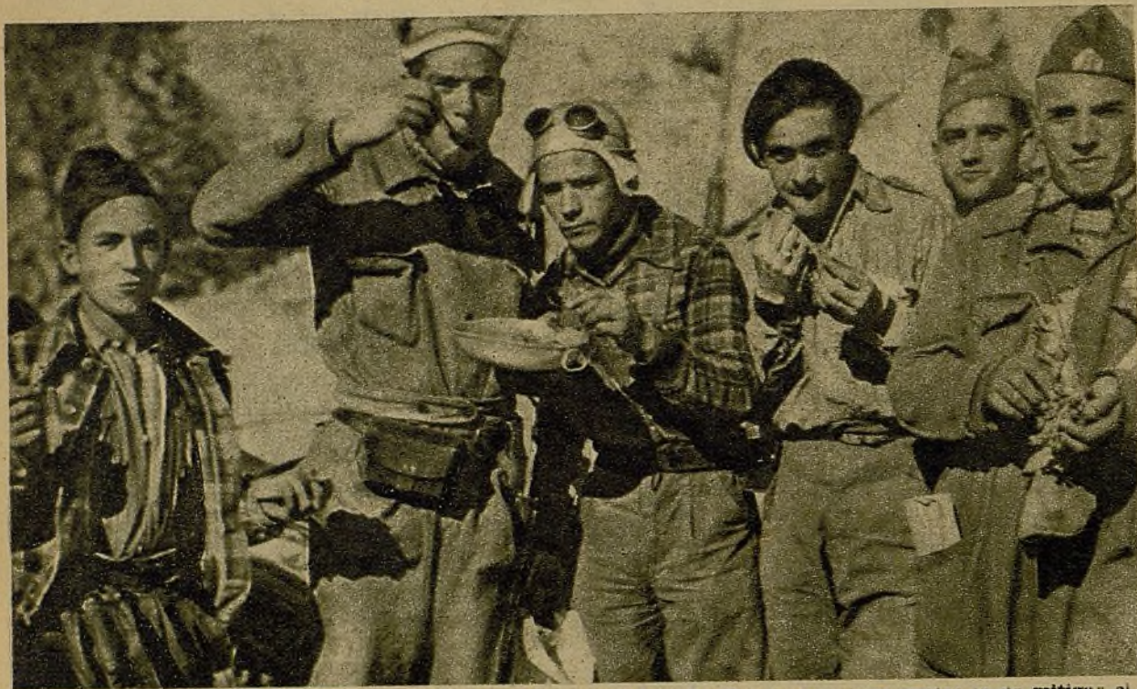
Tras la jornada dura ha llegado una hora grata: la de mitigar el apetito, que se manifiesta ya acusadamente. Y no lo hacen mal los milicianos...