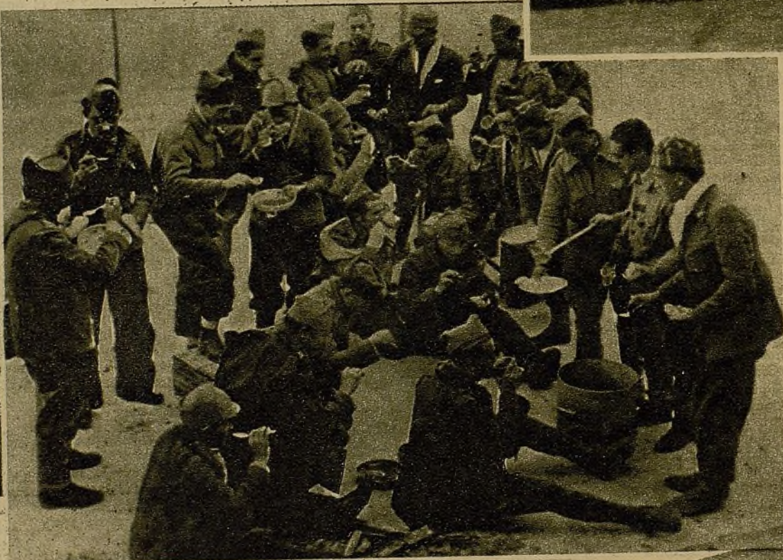
La hora del rancho en un lugar del frente. Los soldados forman su "cola"—también allí las hay, aunque mucho menos prolongadas de personal y de tiempo—para recoger el plato, rebozante del sabroso guiso