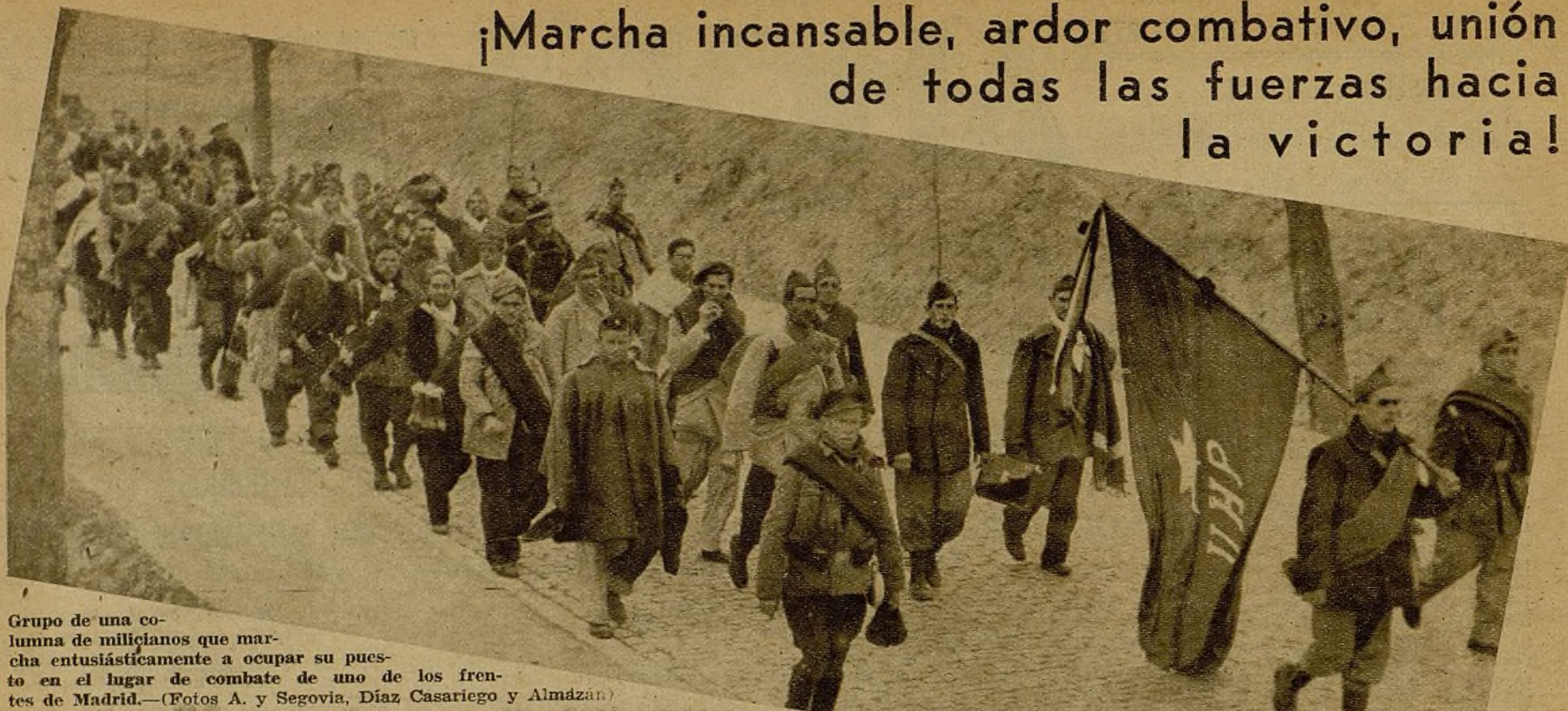
Grupo de una columna de milicianos que marcha entusiastamente a ocupar su puesto en el lugar de combate de uno de los frentes de Madrid.

¡Marcha incansable, ardor combativo, unión de todas las fuerzas hacia la victoria!