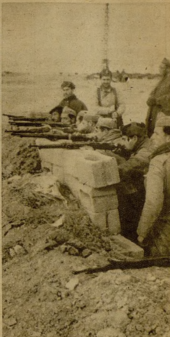
Tras del parapeto, soldados de una avanzadilla enfilan con sus armas la línea de vanguardia de los facciosos