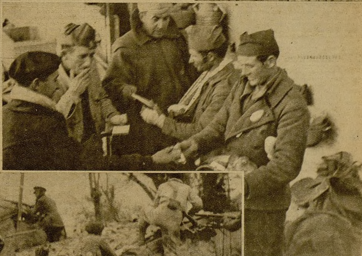
De regreso de las avanzadas, los combatientes reciben el obsequio de unos pasteles, unas cajetillas de tabaco y unos libros, de los que en gran número se remiten desde Madrid por las diversas organizaciones