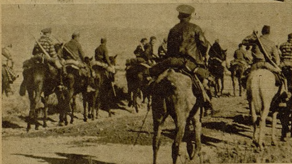
Fuerzas de una columna de Caballería en avanzada hacia el frente para incorporarse a los compañeros que defienden las primeras líneas