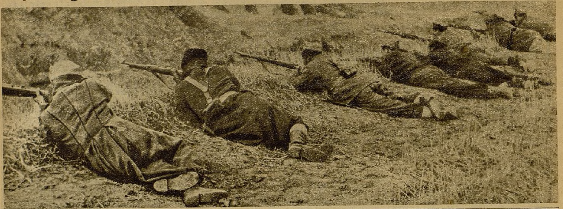
Al amparo de una loma, en tiroteo abierto, los soldados de la República, cubiertos perfectamente, buscan el objetivo inmediato de su fusil