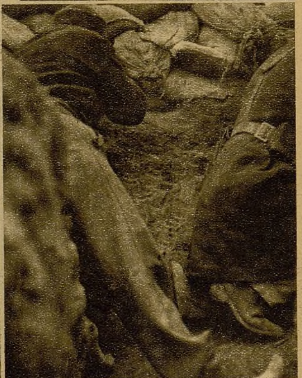
Certeros en el tiro, tras la salvaguardia de sus sacos terreros, estos milicianos mantienen el tiroteo hasta hacer replegarse al enemigo

Un grupo de los artilleros que tan eficaz servicio prestan en los frentes