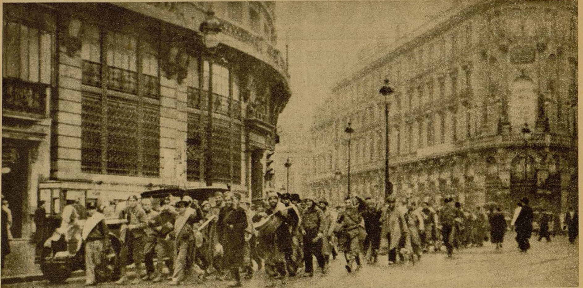
Fuerzas al desfilar por la calle de Alcalá