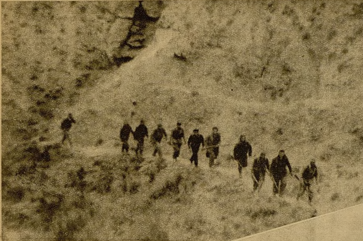
Un grupo de milicianos rodeando una eminencia para cortar el paso a un grupo enemigo que intentaba una incursión en nuestras posiciones