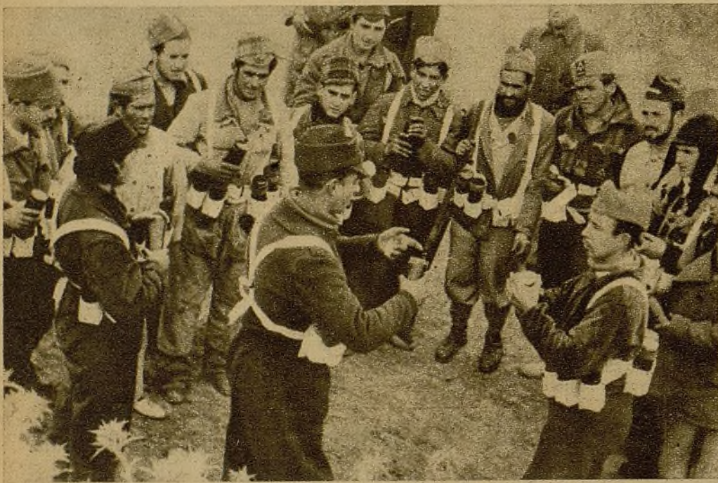
El jefe de una sección de dinamiteros dando instrucciones a un grupo de soldados para el empleo de las bombas de mano en la lucha contra los tanques