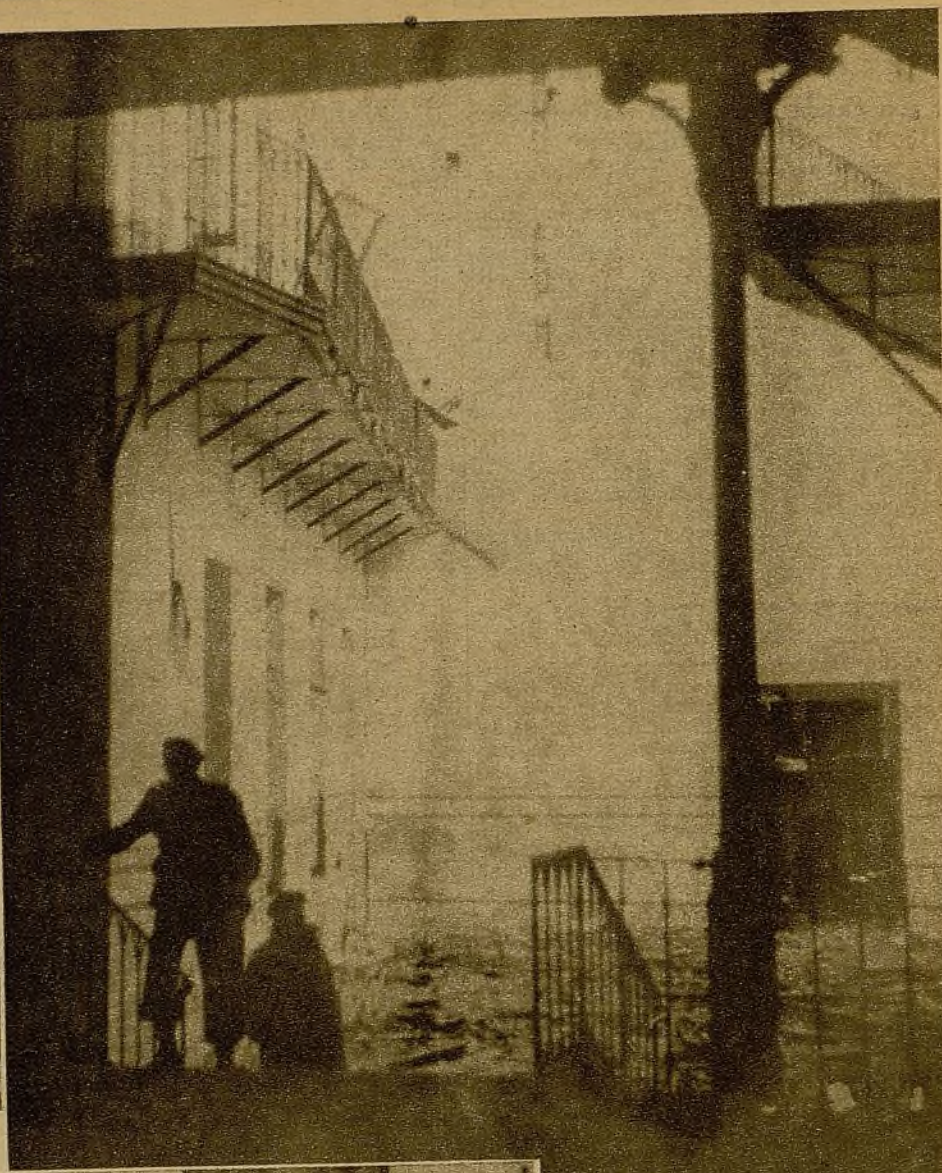
Arriba: El interior de la Carcel Modelo, cuya ocupación habían anunciado las radios facciosas, es un reducto inexpugnable : A la izquierda: Desde una trinchera que fué tomada al enemigo, después de ruda lucha, nuestros soldados persiguen certeramente con sus tiros a los rebeldes en retirada