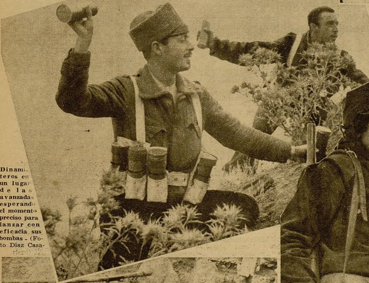
Dinamiteros en un lugar de las avanzadas esperando el momento preciso para lanzar con eficacia sus bombas.