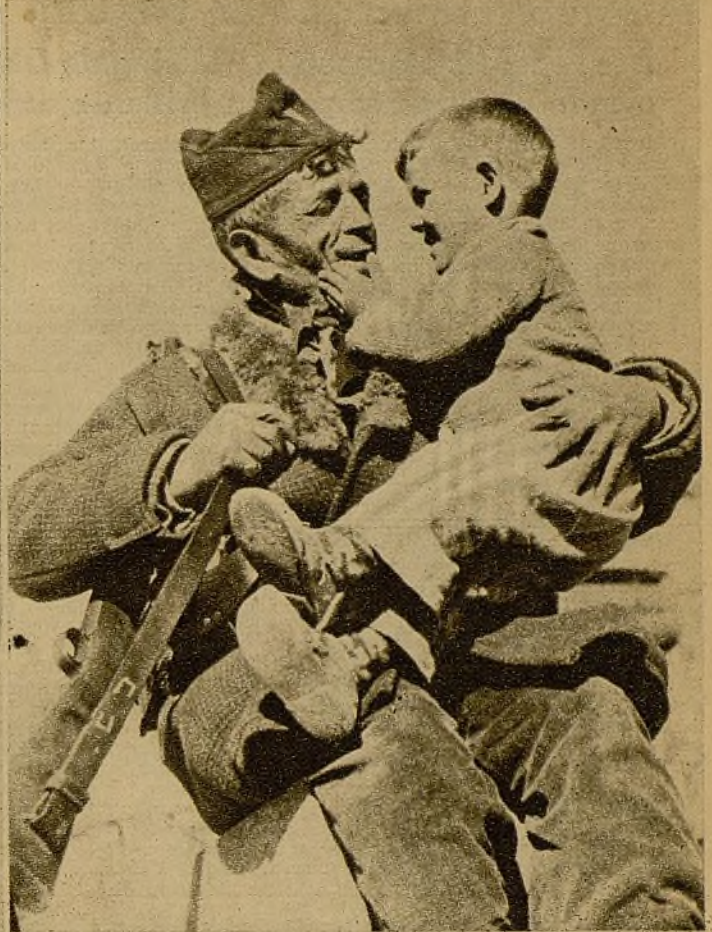
Después de una larga estancia en el frente, en valerosa y constante lucha contra los enemigos de la causa del pueblo, el esforzado anciano recibe, al llegar para gozar del bien ganado descanso, las caricias de bienvenida del nietecillo