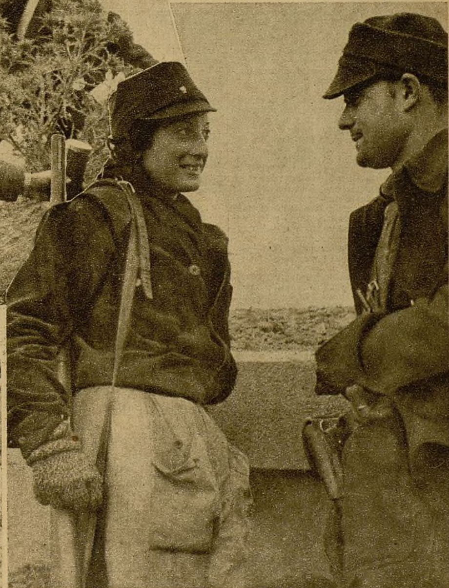
Una pareja de milicianos que pasan en grato coloquio las horas que le corresponde en el servicio de vigilancia. Es seguro que no se le hará larga la jornada...