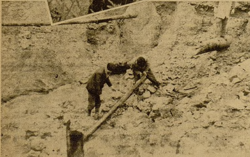
En el lugar en que hizo explosión una bomba lanzada por la Aviación facciosa, obreros voluntarios realizan trabajos de relleno y reparación