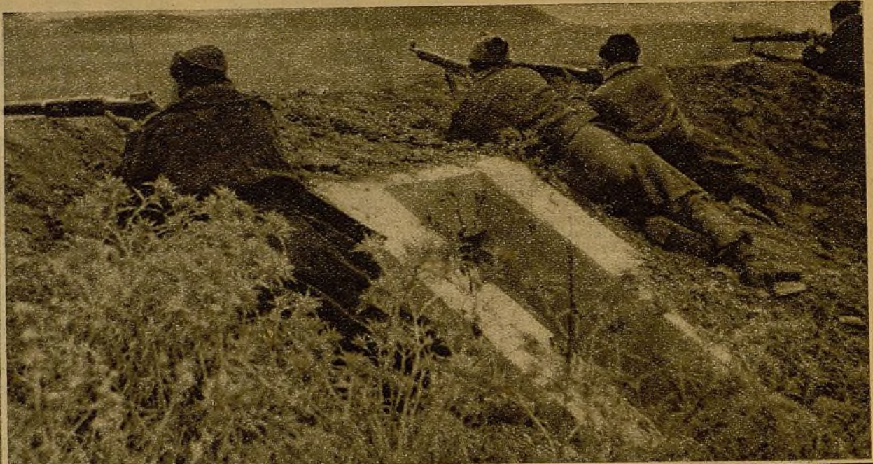
Milicianos de una avanzadilla sosteniendo tenaz tiroteo contra los ocupantes de una loma fronterá, que hubieron al fin de abandonar el campo