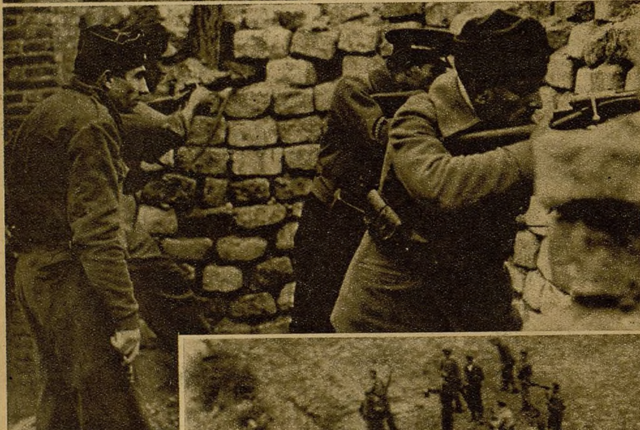
Todos los frentes del sector del Centro, en sus líneas de avance, están defendidos por sólidos parapetos, desde los que nuestros bravos milicianos realizan una invencible defensa. He aquí a varios de ellos hostilizando sin cesar al enemigo