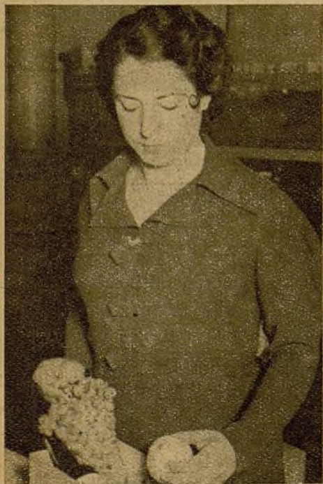
Cognac, turrón, frutas... El regalo que recibirán los milicianos en la fecha de la Nochebuena, merced a la labor benemérita del Socorro Rojo Internacional

La "Nochebuena del Miliciano", organizada por el S. R. I., vendrá una vez más a afirmar la potencia y alcance de esta Organización, que figura en la vanguardia de las organizaciones antifascistas.