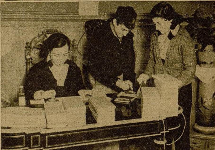
Directivos del Socorro Rojo Internacional ocupados en la organización de los envíos a los diversos frentes

destacados en las poblaciones de Levante elementos de nuestra organización que compran 50.000 kilogramos de turrón, 50.000 kilogramos de embutidos, 50.000 litros de cognac, frutas, peladillas, 100.000 cajetillas de tabaco, 100.000 puros habanos. Con todos estos productos se confeccionan unas cajas con el membrete de la organización y dentro de la misma una carta-manifiesto dirigida a los milicianos.