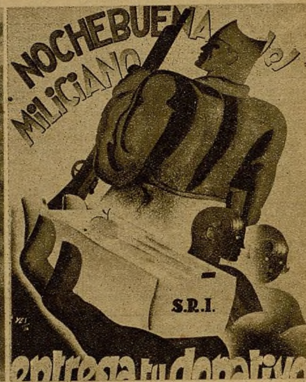
El expresivo cartel en que se demanda la prestación de los ciudadanos antifascistas para los combatientes

El S. R. I. ha montado su aparato orgánico para este acto de solidaridad en Comisiones para poder actuar con más eficacia. Existen las Comisiones de compras, para lo que hay desde hace tiempo