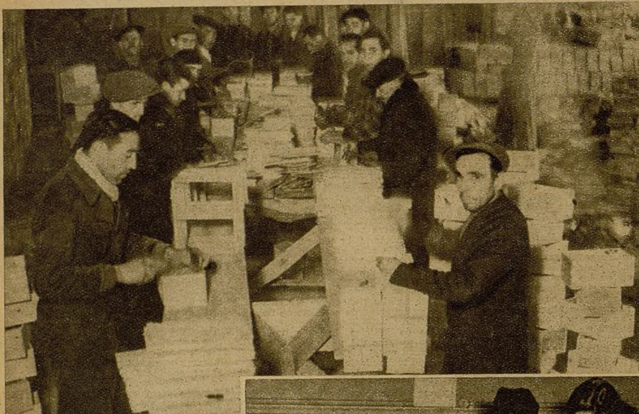
En la preparación de las cajas en que han de empaquetarse los regalos de Nochebuena para los milicianos, se emplean numerosos voluntarios del Socorro Rojo

Así como otros años el Socorro Rojo Internacional tuvo que celebrar las festividades de Navidad en otro estilo y en otras circunstancias harto distintas, como fueron las del año 1934, con el título de Navidad del Preso, el actual las celebra transformando una festividad tradicional en un acto grandioso de solidaridad. Ultimamente se ha conseguido unificar todos los esfuerzos de las organizaciones antifascistas que preparaban también su "Nochebuena del Miliciano" en una organización única, que es la del Socorro Rojo Internacional y con la colaboración directa de las organizaciones antifascistas.