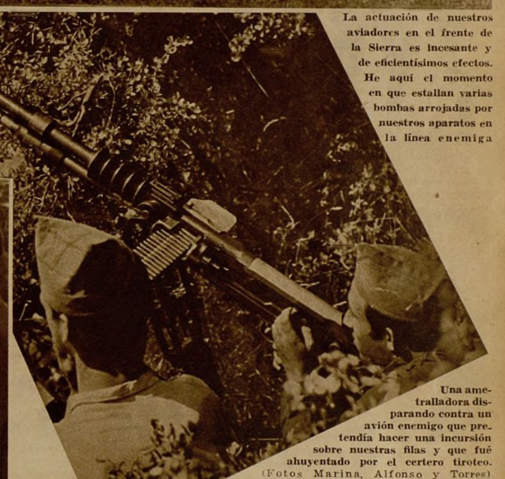
Una ametralladora disparando contra un avión enemigo que pretendía hacer una incursión sobre nuestras filas y que fué abuyentado por el certero tiro.