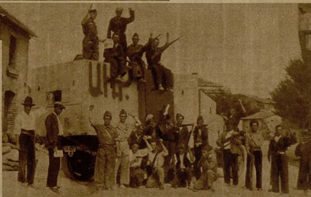
Una sección de ametralladoras, con su coche blindado, que expulsó a los facciosos de varios pueblos de Cáceres. Los bravos milicianos posan unos momentos en Madrigal de la Vega, donde hicieron muchas bajas y prisioneros a los facciosos