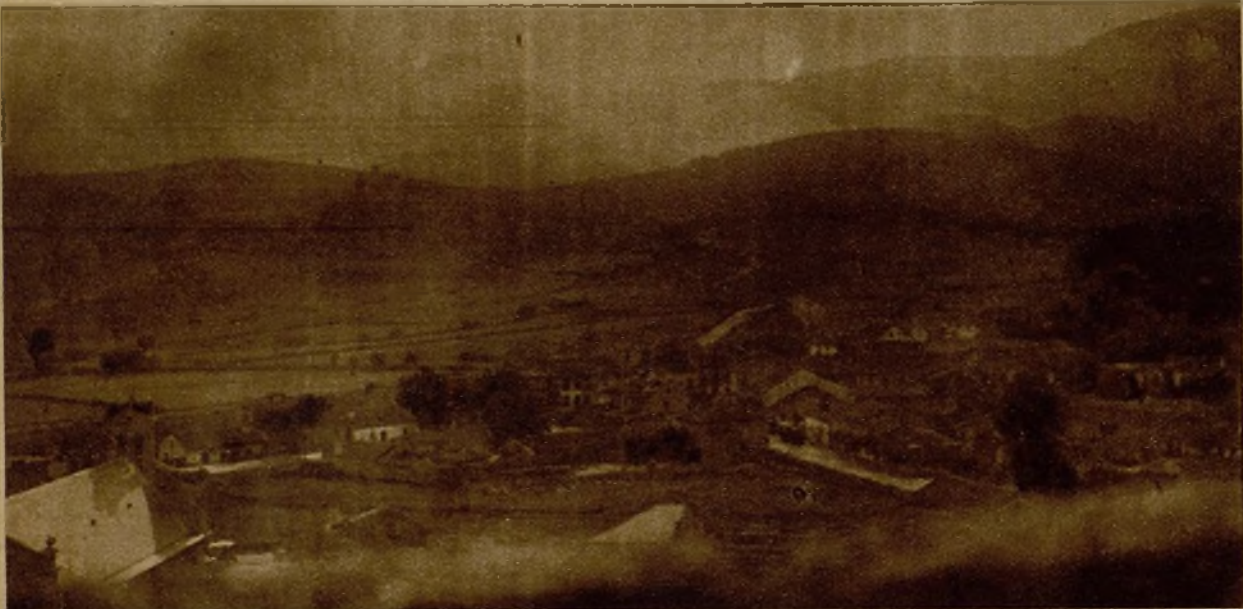
Vista de un sector ocupado por los facciosos durante el bombardeo de nuestra Aviación, que les hizo retroceder con grandes bajas y que facilitó el avance de nuestras tropas a estos lugares