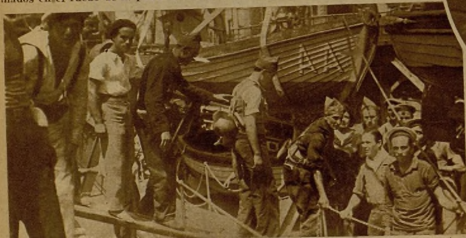
Soldados de la segunda expedición valenciana a las islas Baleares, en el momento del embarque