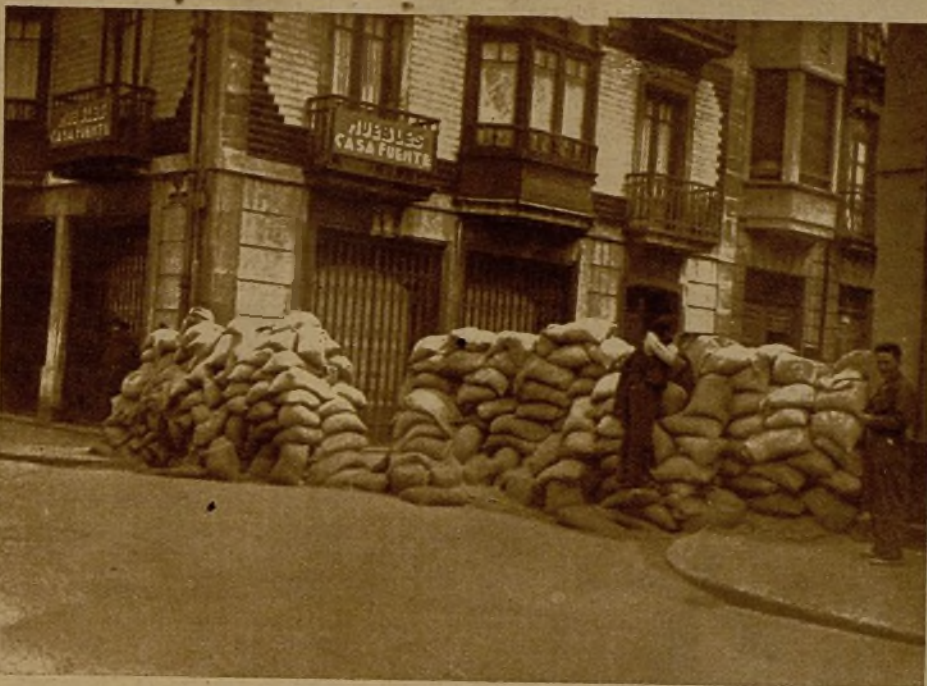
Trincheras para batir el cuartel de Simancas, en Gijón

He llegado, utilizando uno de los coches de enlace que con tan perfecto orden recorren hoy las carreteras de todo el Norte, hasta el vecino pueblo de Somió. Desde allí he venido a pie a Gijón. En el camino, algunos vecinos, cargados con los enseres más indispensables, se dirigen a pie a las aldeas vecinas, donde se creen más seguros. Son pocos y cada día menos. Los últimos bombardeos, los realizados en la noche del día 6 por el feroz pirata, tuvieron por blanco humildísimas viviendas y caseríos del camino de Ceares, y el vecindario se ha convenido de que para la barbarie de los ma-