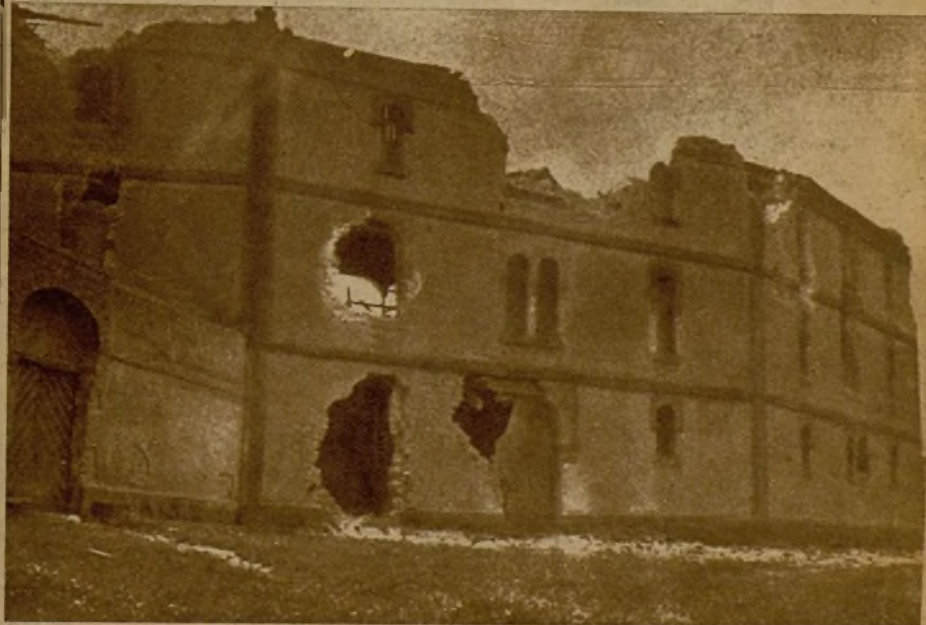
Los efectos del bombardeo en la plaza de toros de Gijón