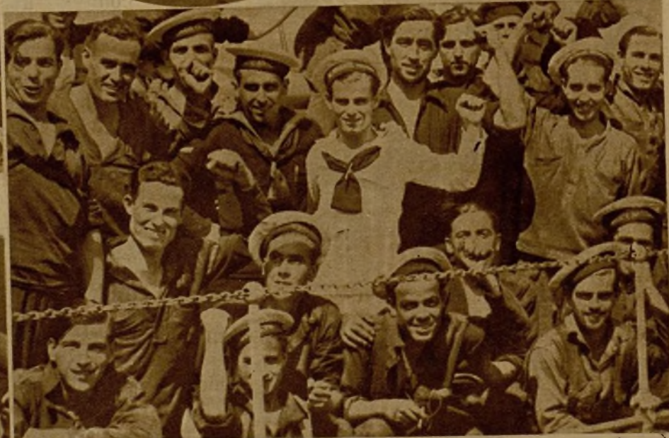
Grupo de marinos del buque transporte que conduce a las fuerzas valencianas a Mallorca, que fueron objeto de una entusiasta despedida, a la que correspondieron con vibrantes vítores a la República