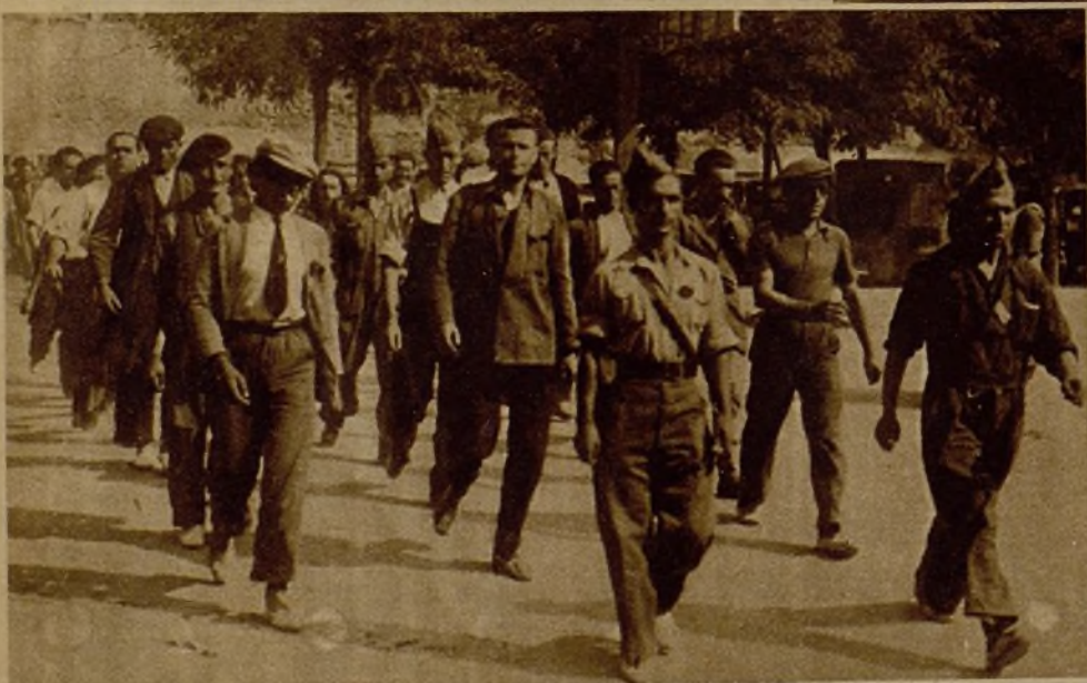
Milicianos del batallón Pasionaria que hacen instrucción en Madrid para su marcha al frente. — A la derecha, la Milicia de los ferroviarios del Norte, que ha salido para la Sierra, a su paso por las calles de Madrid