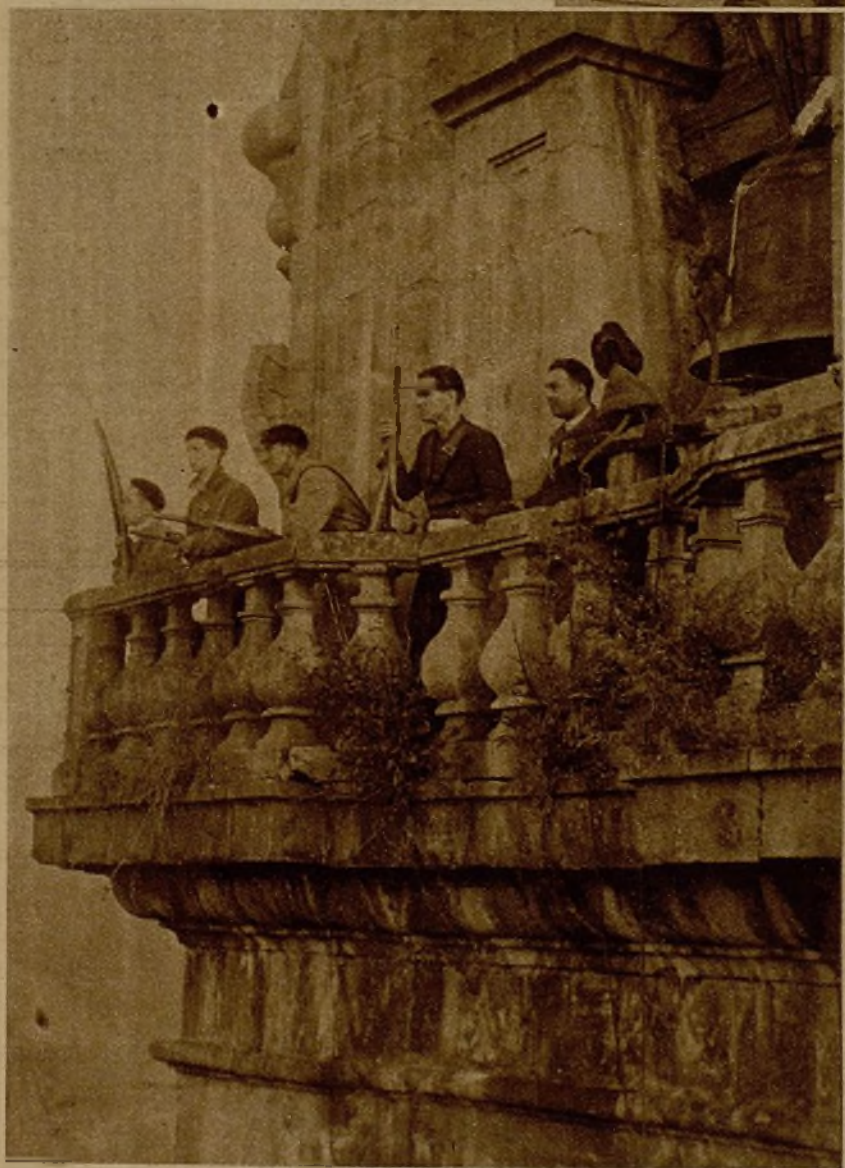
Milicianos de guardia en la torre de la iglesia de Ochandiano (Bilbao), desde la que se lucharon numerosas bajas a una partida rebelde, poniendo en dispersión a los restos de la misma