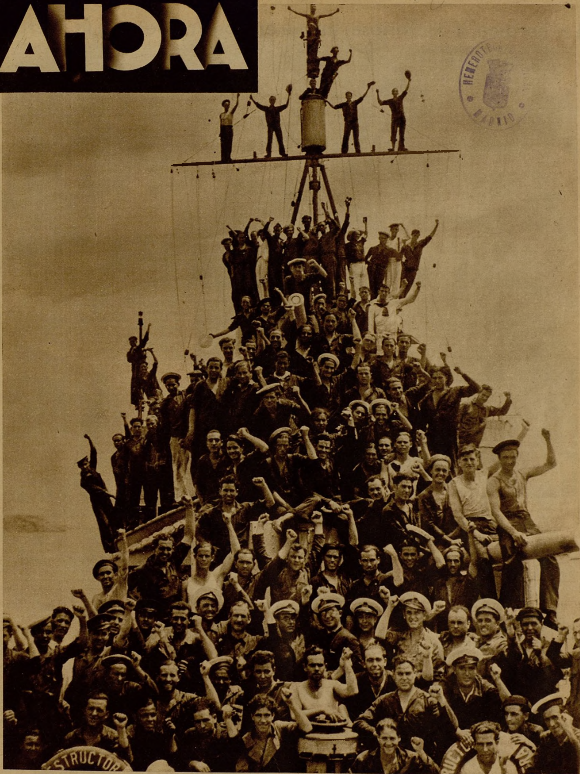
LA TRIUNFAL ENTRADA EN IBIZA DE LOS DEFENSORES DE LA REPUBLICA Y DE LA LIBERTAD.—El victorioso empuje de nuestros marinos y milicianos ha conseguido aplastar en brevísimo tiempo a los facciosos de Ibiza y Formentera, y nuestros efectivos se dirigen ahora sobre Palma de Mallorca, que sojuzgarán prontamente, siguiendo el triunfal avance de las fuerzas de la República, que acumulan sobre los rebeldes descalabro tras descalabro. He aquí el entusiasmo patriótico de la dotación del "Almirante Antequera", después de la victoriosa entrada en Ibiza