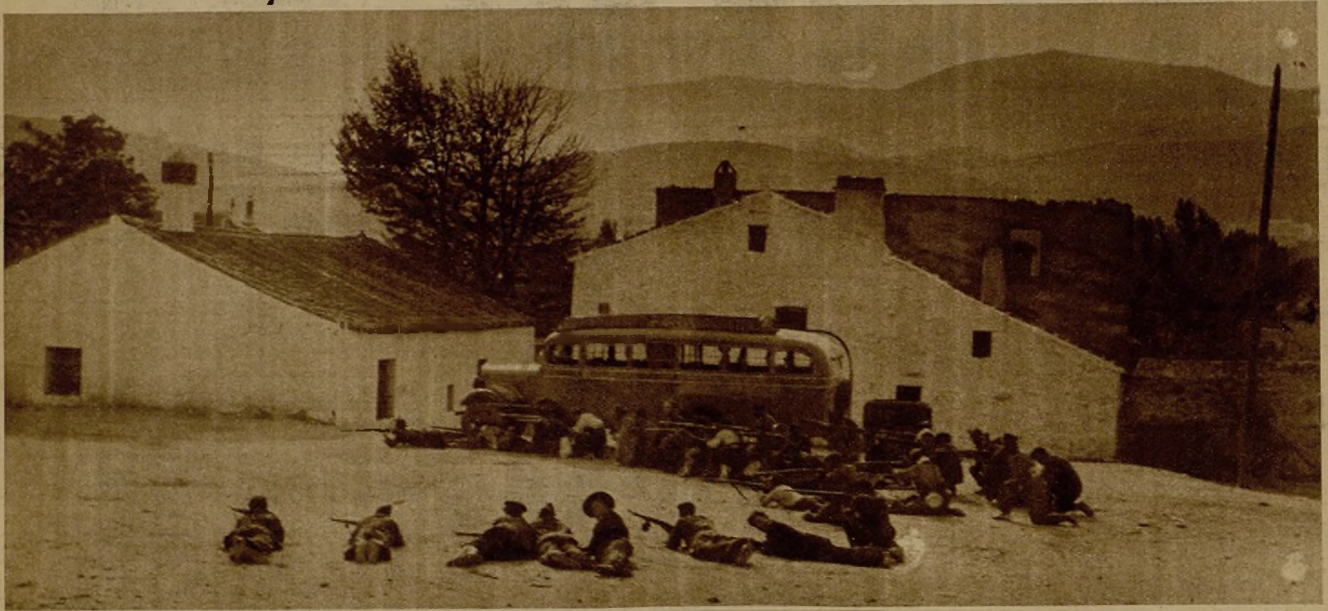
Las avanzadas de milicianos que luchan en el frente de la Sierra dan constantemente admirables pruebas de heroísmo, lanzándose con ejemplar entusiasmo a la persecución del fugitivo enemigo. He aquí una guerrilla despejando de facciosos la entrada de un pueblo que a poco fué tomado por nuestras tropas.