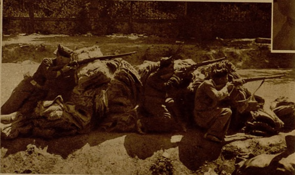
Tres milicianos, parapetados tras un montón de sacos, disparando contra el enemigo