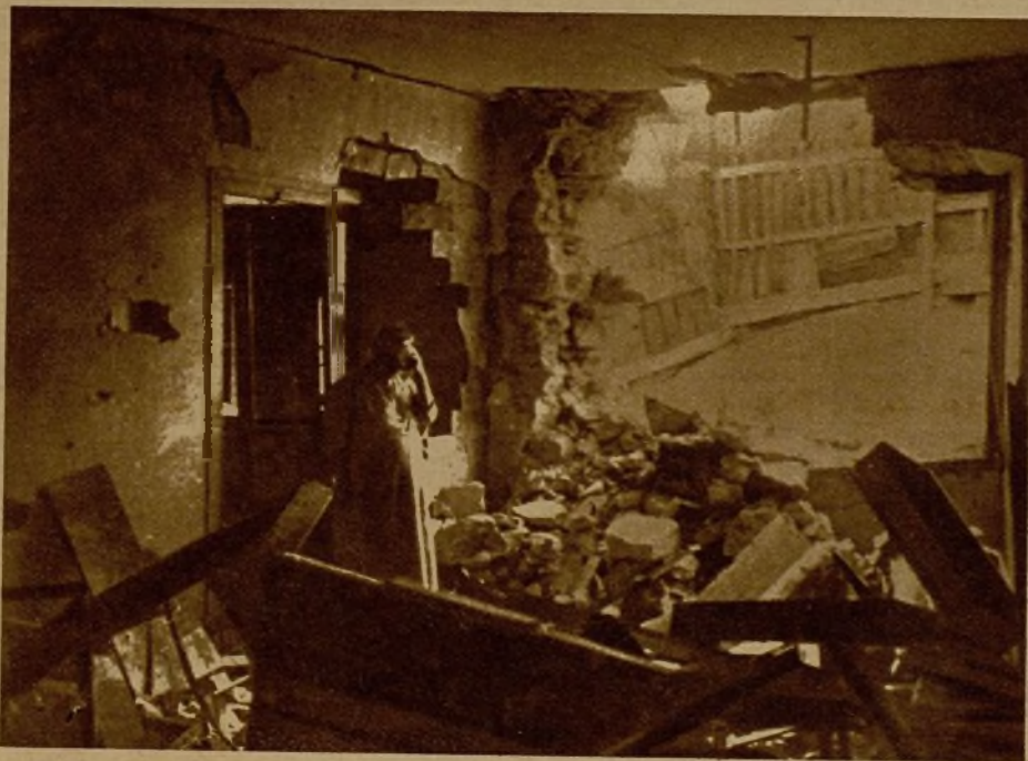
La infeliz mujer de un pobre pescador de Cimadevilla llora ante su ajuar destruido por el estúpido cañoneo de los rebeldes contra los míseros albergues

rios traidores no resulta lugar más seguro la campiña que la ciudad.