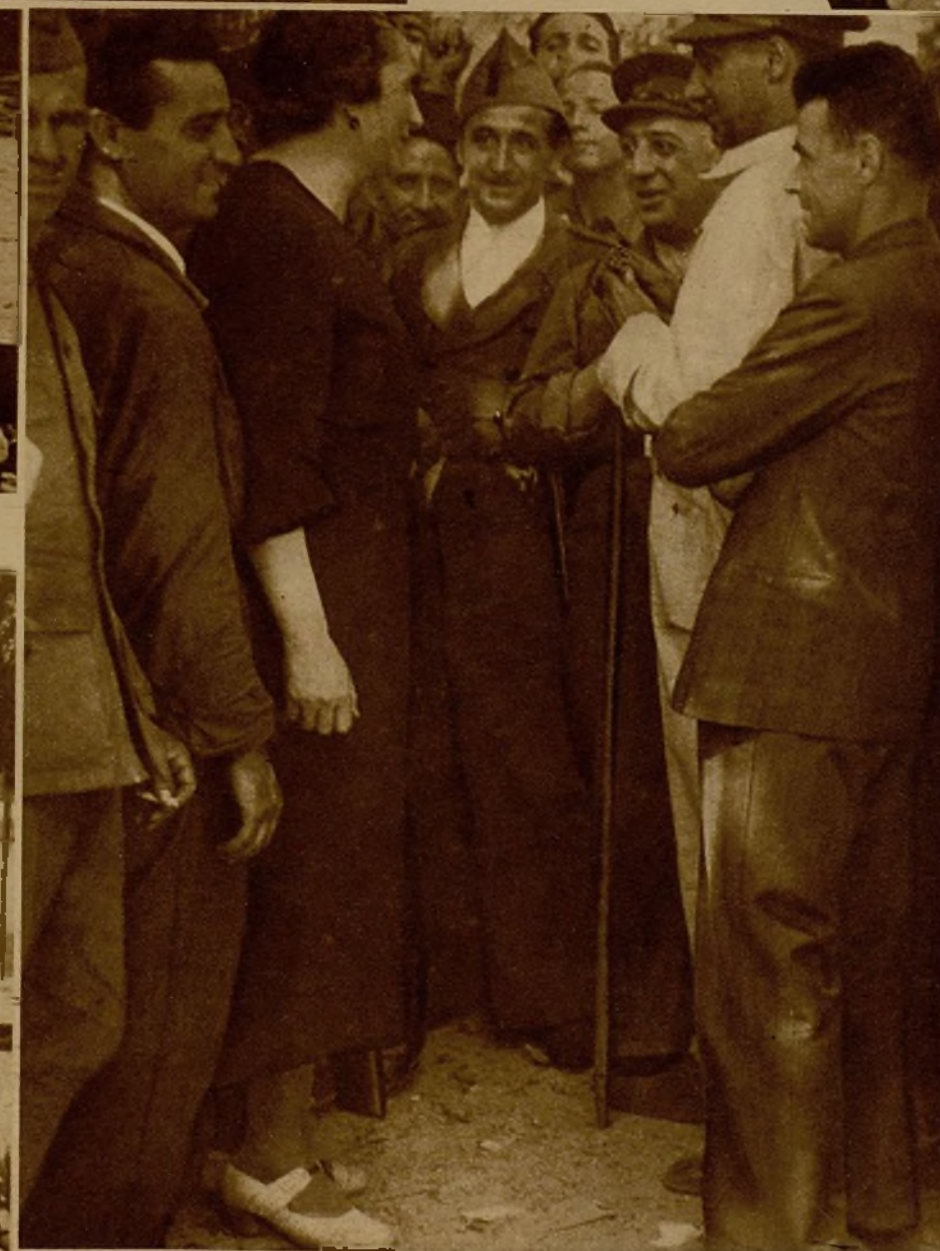
Milicianos de la compañía del 5.º regimiento de Campesinos, que se han distinguido en los últimos avances en el frente de la Sierra