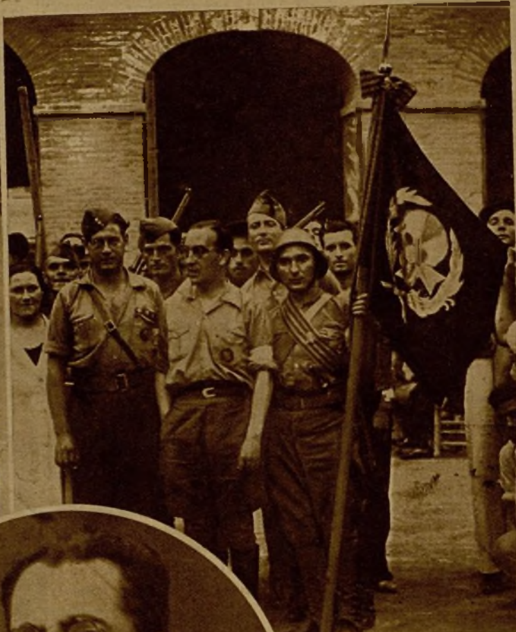
La plana mayor de la sección sanitaria de la segunda expedición salida de Valencia para combatir a los rebeldes de Mallorca, con el banderín del grupo.