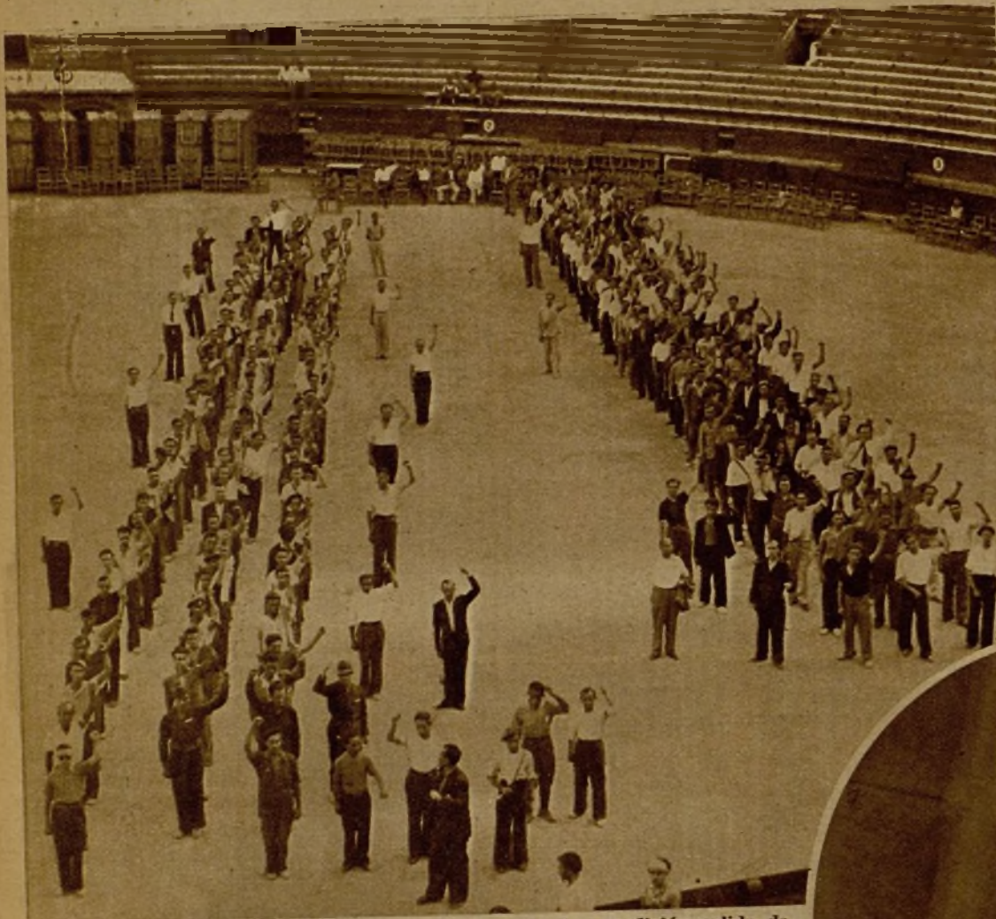
Un grupo de milicianos que forma parte de la segunda expedición salida de Valencia contra los rebeldes de Palma de Mallorca. Los voluntarios están formados en el ruedo de la plaza de toros, donde les fué entregado el armamento