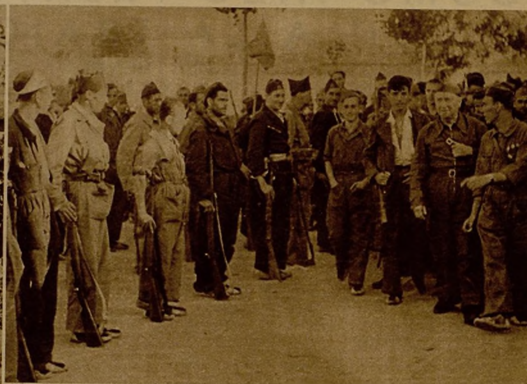
Seis soldados de nuestras filas que fueron sorprendidos por un grupo enemigo, del que lograron evadirse, reintegrándose a las fuerzas