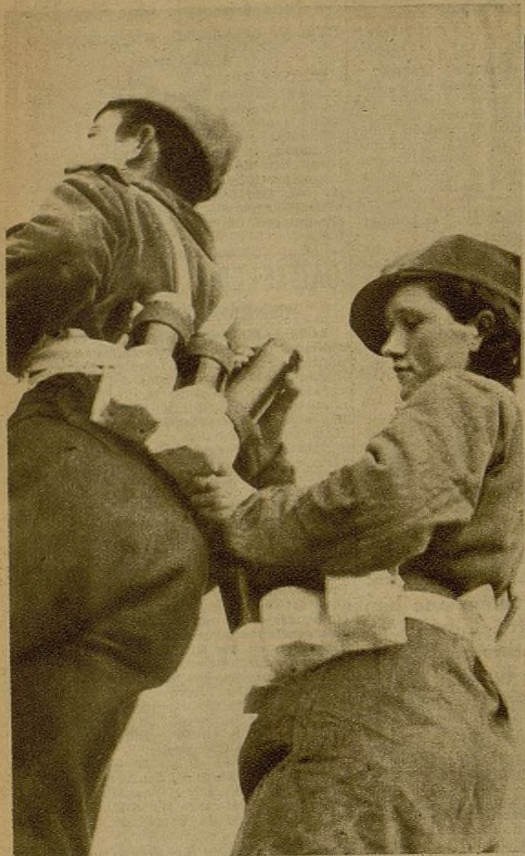
En un momento preparatorio del ataque la brava miliciiana aprovisiona a su compañero de las bombas antitanques