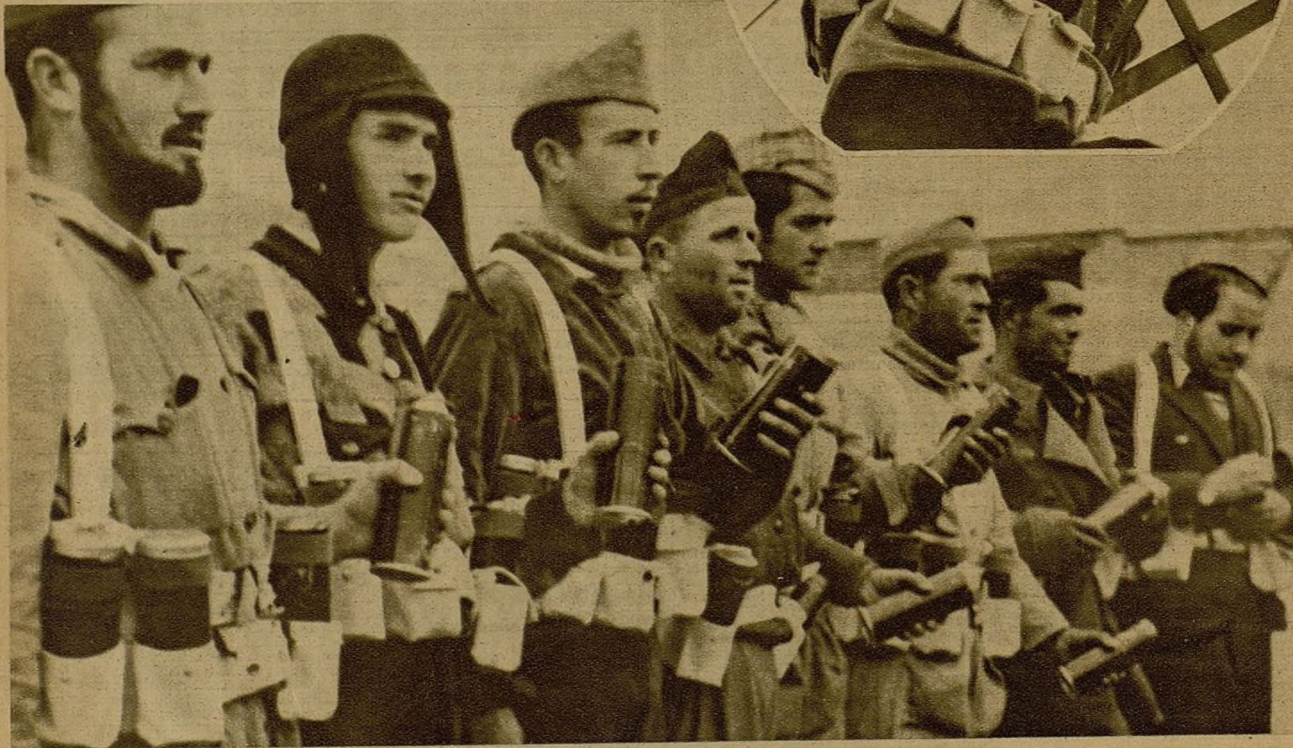
Un grupo de dinamiteros oyendo el curso que acerca del empleo de sus potentes armas desarrolla uno de sus jefes