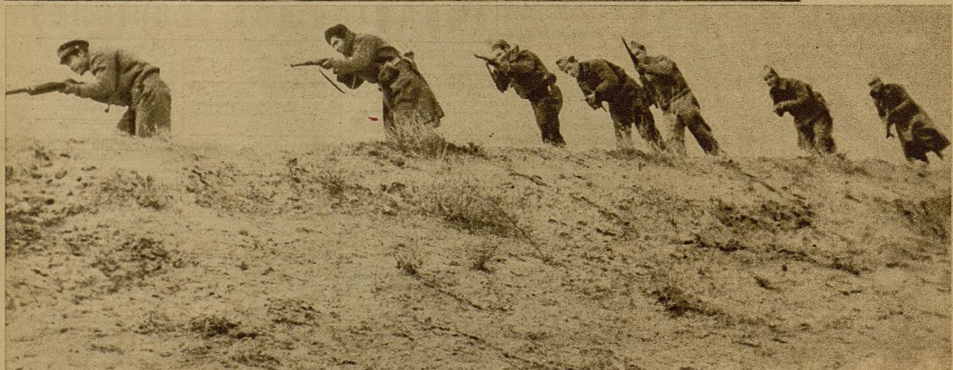
Soldados de una avanzadilla, en marcha para rodear una posición desde la que los rebeldes habían hecho intenso fuego

Milicianos escalando una tapia para penetrar en una casa que fué refugio de facciosos y de la que nuestro fuego de artillería desalojó al enemigo