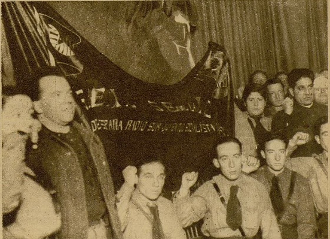
La bandera entregada a la segunda Brigada Internacional, en el acto celebrado ayer, con gran solemnidad y entusiasmo, en el Monumental Cinema