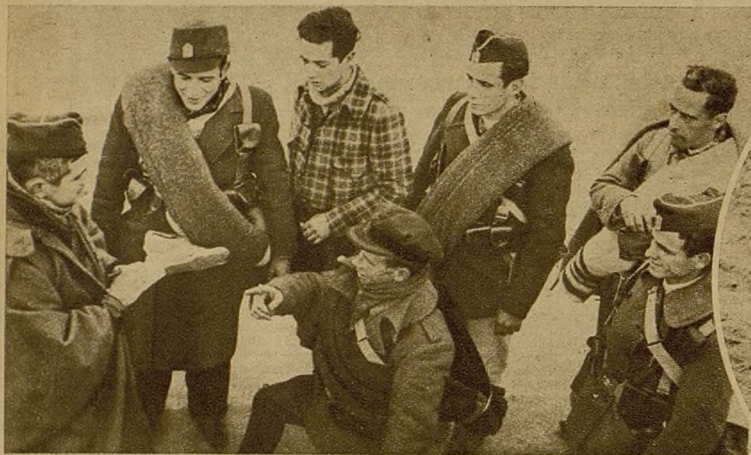
El jefe de uno de los batallones que luchan en los frentes de Madrid dando órdenes a los comisionados para un servicio en la línea de vanguardia

Todos los frentes están a punto para ejecutar la ofensiva en el momento en que lo decida el Alto Mando