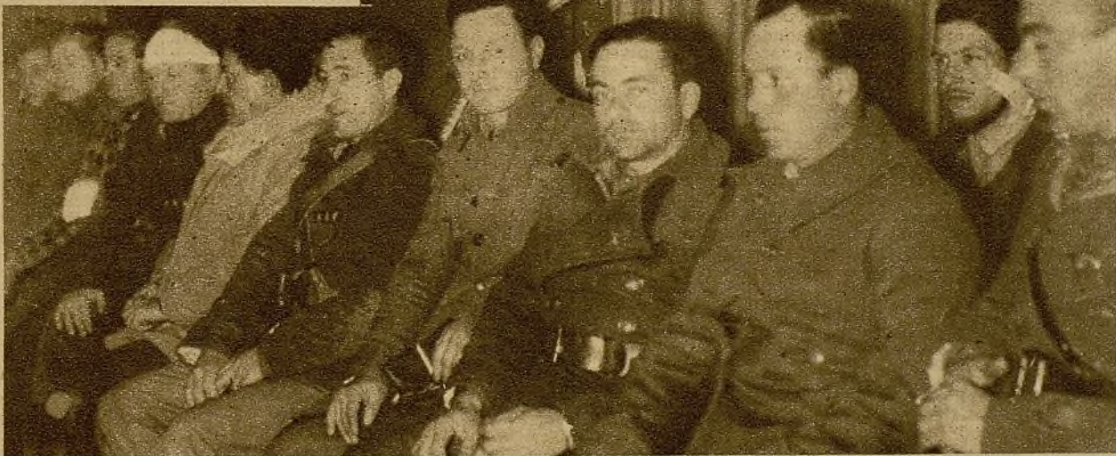
Con gran concurrencia ha tenido lugar ayer, en el Monumental Cinema madrileño, la entrega de una nueva bandera a la segunda Brigada Internacional. He aquí a un grupo de militantes de la misma, convalecientes de heridas sufridas en la lucha, durante el acto