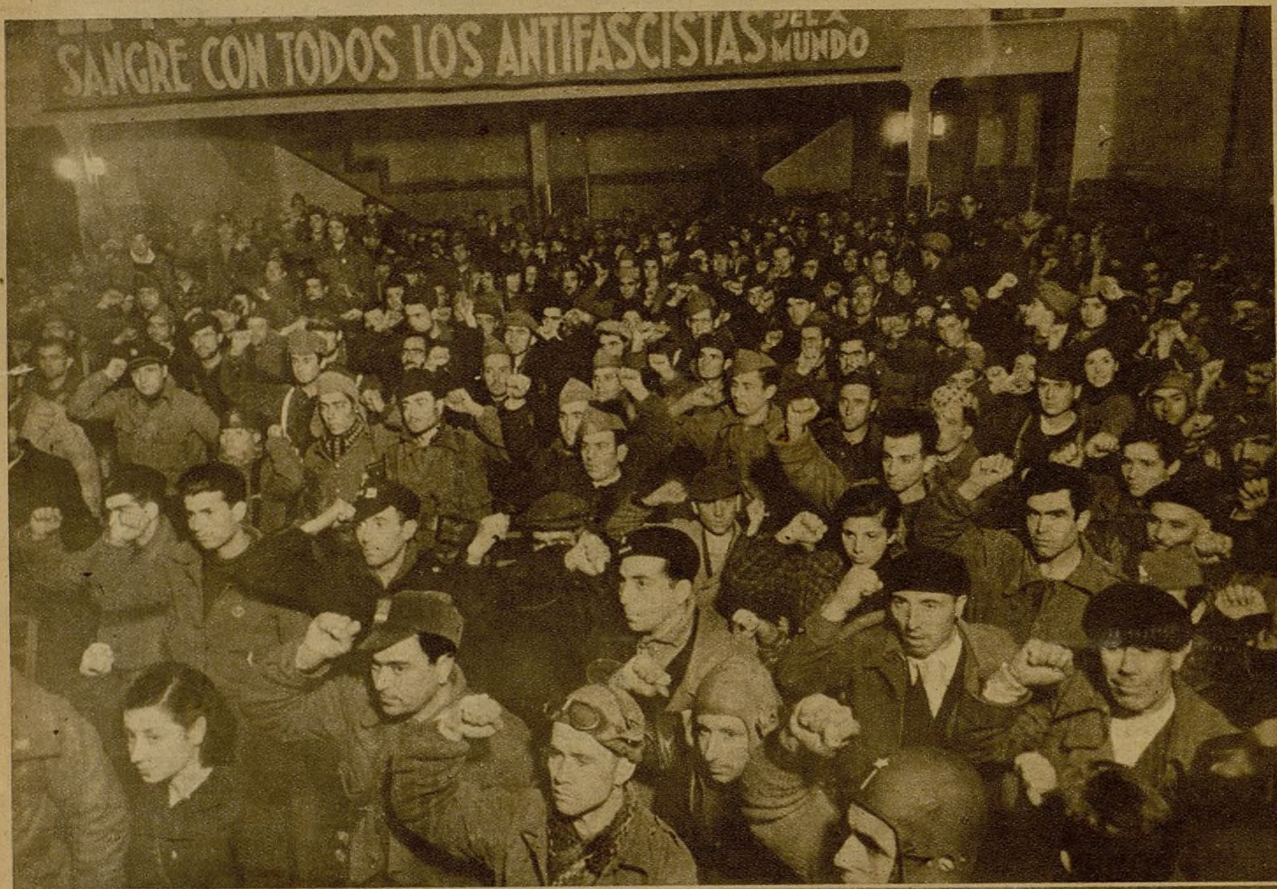
A trescientos metros del frente ha tenido lugar la entrega de una bandera a la primera Brigada del 5.º Regimiento de Milicias. En el acto pronunciaron discursos varios representantes sindicales y leyó bellas poesías el vate proletario Rafael Alberti. Un aspecto parcial del salón donde tuvo lugar la entrega de la enseña