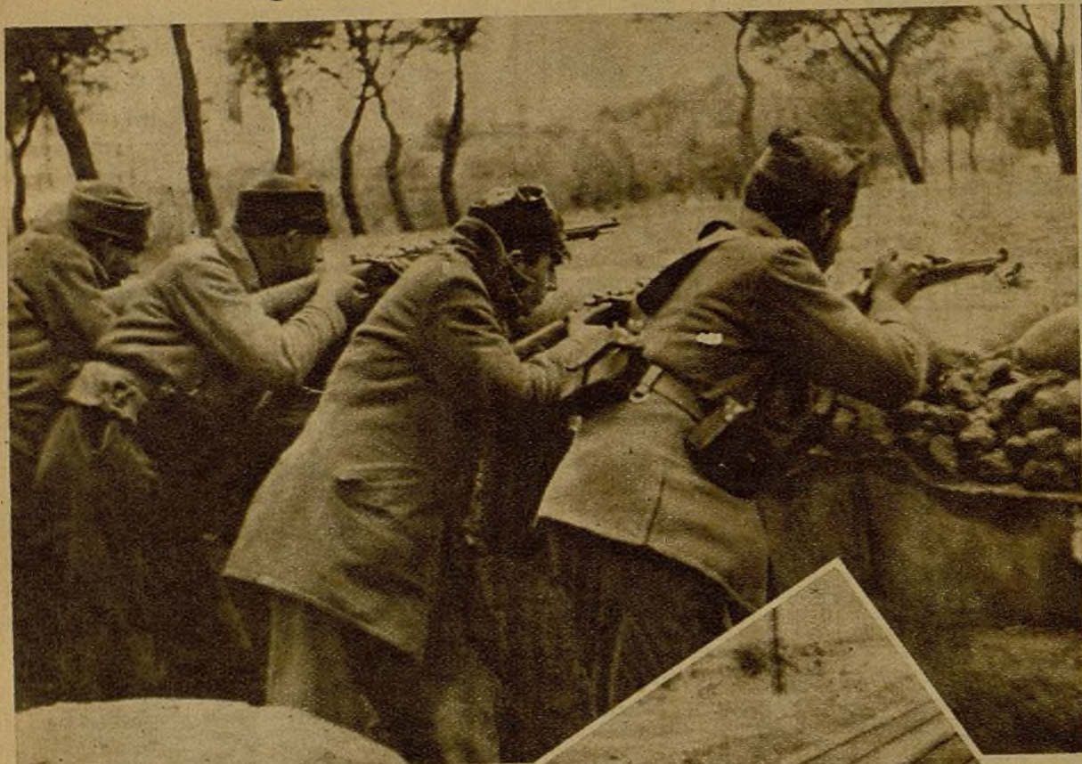
Firmes en sus parapetos, incansables en la vigilancia, hostilizando ante el menor movimiento que se produzca en las avanzadas enemigas, los luchadores de las trincheras mantienen inflexiblemente sus posiciones. A la derecha, soldados en su puesto de vigilancia junto a la línea férrea.