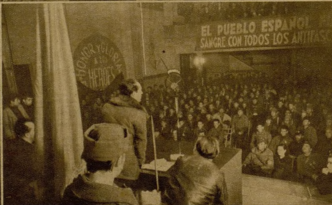
El comandante Lister durante el discurso que pronunció en el acto de entrega de una bandera a la primera Brigada del 5.º Regimiento