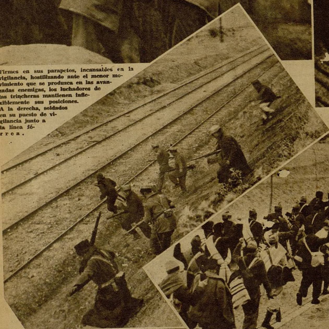
Fuerzas de una columna, en marcha hacia las posiciones avanzadas para relevar a las tropas de vanguardia, en disciplinado cumplimiento de las órdenes del Mando