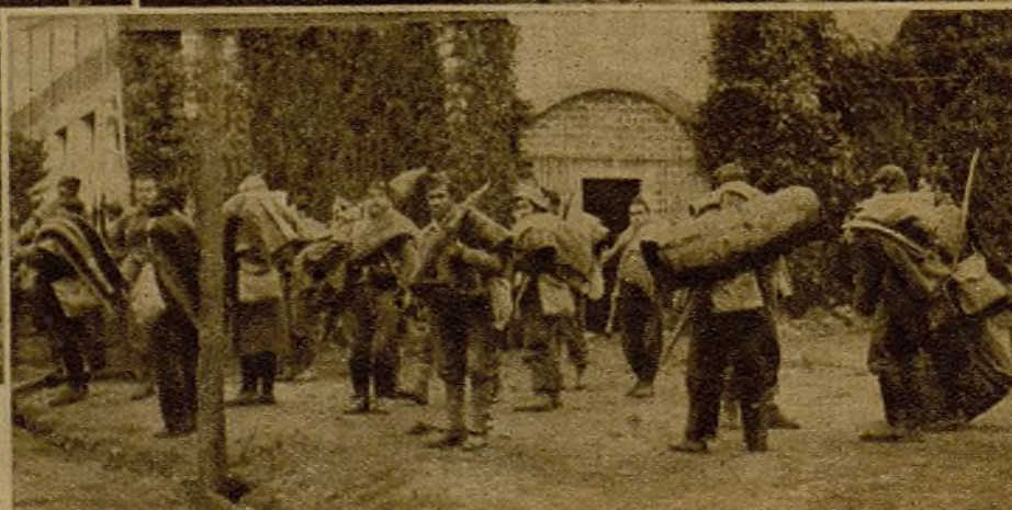
Fuerzas de uno de los lugares cercanos a Madrid prestas a marchar a la vanguardia