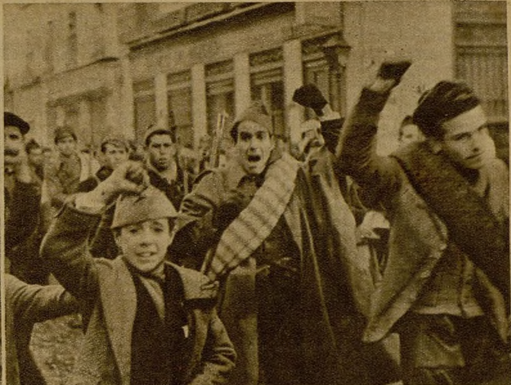
Con vibrante entusiasmo, pleno de deseos de entrar en la lucha, marchan hacia el frente los milicianos