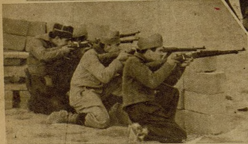
Tras el parapeto, levantado por los mismos luchadores, estos soldados mantienen vivamente el fuego contra el enemigo