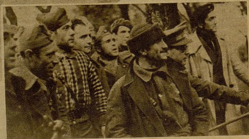
Jefes y oficiales de uno de los grupos de los sectores del Centro presenciando el avance de la columna (F. D. Casariego)