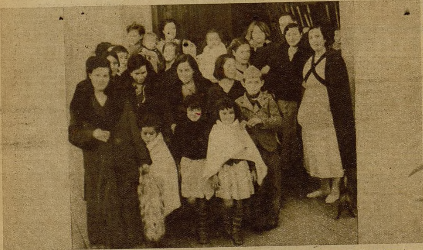
Un grupo de evacuadas al salir de la Maternidad para ocupar los vehículos que las han conducido a Levante