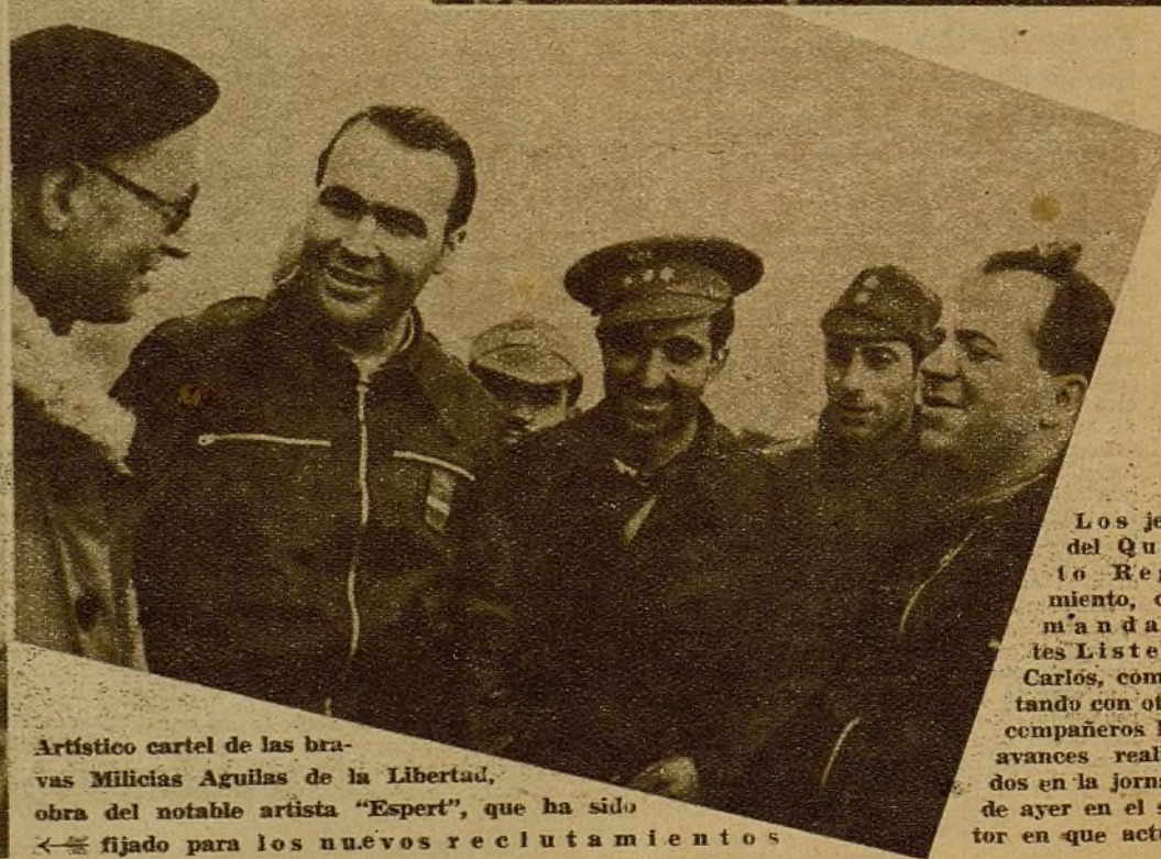
Artístico cartel de las bravas Milicias Aguilas de la Libertad, obra del notable artista "Espert", que ha sido fijado para los nuevos reclutamientos

Los jefes del Quinto Regimiento, comandantes Lister y Carlos, comentando con otros compañeros los avances realizados en la jornada de ayer en el sector en que actúan