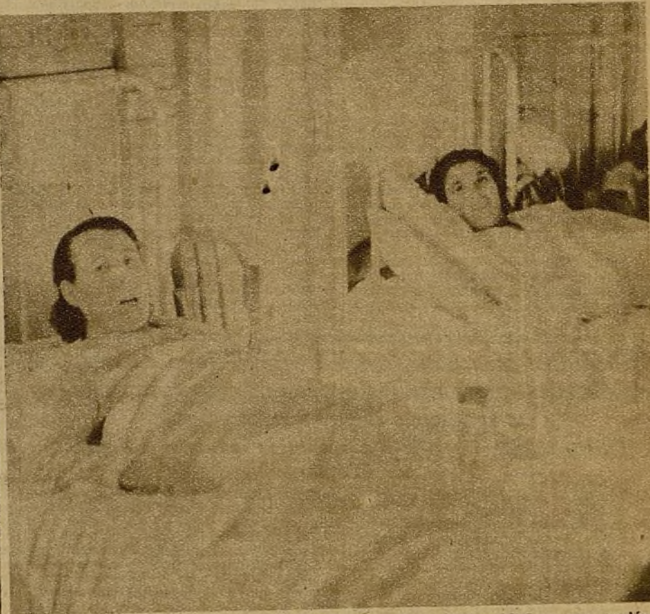
Magnífica instalación realizada por el Patronato de la Maternidad en una espléndida finca de la provincia de Albacete para evacuadas próximas a ser madres

Amplio, maravilloso de orientación, es el refugio de estas futuras madres, que alegres y satisfechas discurren por las amplias avenidas... Sol, luz, aire y extensos pinares por todos los sitios dan a las edificaciones una luminosidad excepcional... Allí no se carece de nada. Agua abundante, calefacción, habitaciones amplias, camas confortables y alimentación sana y de acuerdo siempre con lo delicado de su estado... Hemos recorrido todo el edificio... Nada falta y todo ha tenido que improvisarse; pero en todas estas obras de amor al prójimo siempre se encuentran los espíritus de fraternidad hacia el necesitado... Aquí hay un