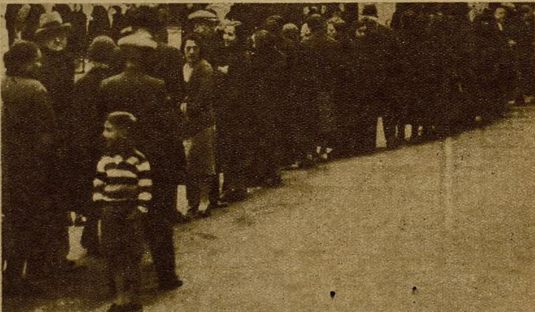
La larga cola formada ante el local donde, por primera vez en la capital levantina, se ha celebrado el sorteo de Navidad

En Valencia despertó gran interés el sorteo de la Lotería de Navidad, que por las circunstancias actuales se celebra por primera vez en aquella capital. He aquí a los alumnos del colegio Ferrer Guardia que sacaron el número correspondiente a los quince millones. El premio "gordo" ha correspondido por esta vez al Estado