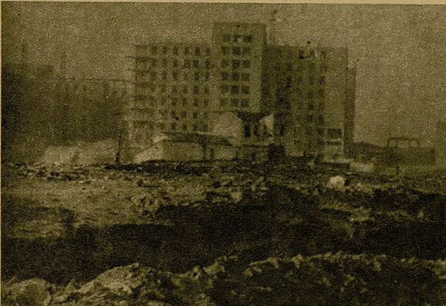
Una nueva fotografía del Hospital Clínico, en el que se observan los efectos de nuestra Artillería

La Nochebuena pasada, Franco envió a estas trincheras a sus mejores oradores sagrados, castrenses y de los otros para que "convenciera" a nuestros milicianos. Repitieron los tópicos que ya expresaban Gil Robles y sus huestes en mítines de menos riesgos. Y, como no con-