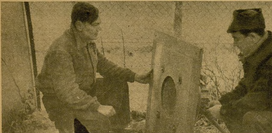
Los milicianos han instalado en primera línea ese altavoz, por el cual oyen los facciosos la palabra de nuestros comisarios políticos

El alférez más pequeño del mundo. Es, además, la "mascota" de uno de los regimientos de la segunda brigada mixta