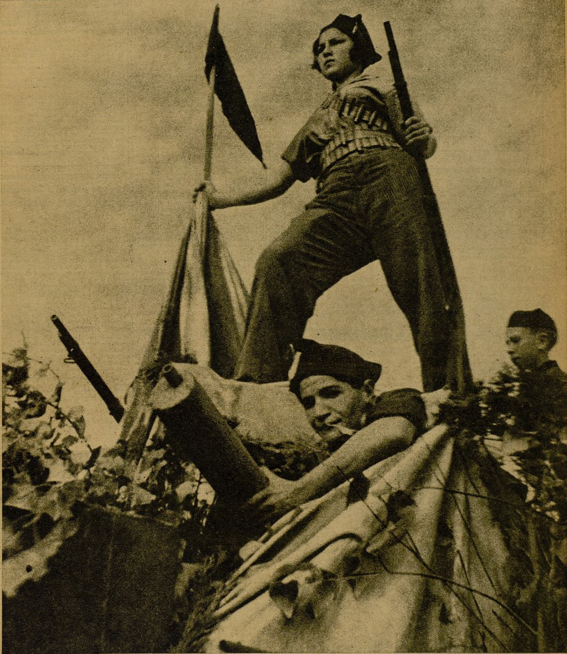
LA HEROICA LUCHA ESPAÑOLA, EXALTADA EN LAS FIESTAS CONMEMORATIVAS DE LA REVOLUCION SOVIETICA. —En uno de los magnos desfiles que han tenido lugar en Rusia, en conmemoración del XIX aniversario de la instauración de los Soviets, ha figurado esta representación viviente de una miliciana española sobre las barricadas, cuyo paso dió lugar a formidables muestras de entusiasmo y reconocimiento de la heroica lucha que sostienen las fuerzas populares de nuestro país contra el fascismo internacional. Centenares de miles de personas vitorearon fervorosamente a España y a las personalidades representativas de nuestra causa