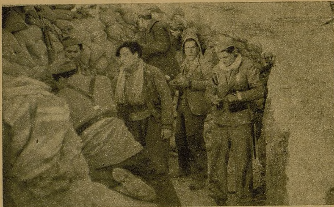
En la trinchera. Los milicianos han terminado la comida. Pero los puestos de observación no se abandonan