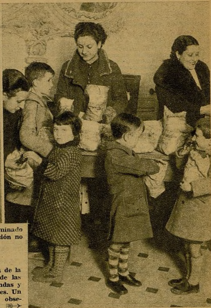
La Federación Española de Trabajadores de la Enseñanza ha organizado, con motivo de las fiestas de Navidad, un reparto de meriendas y golosinas entre los hijos de sus luchadores. Un grupo de pequeñines recibiendo los obsequios