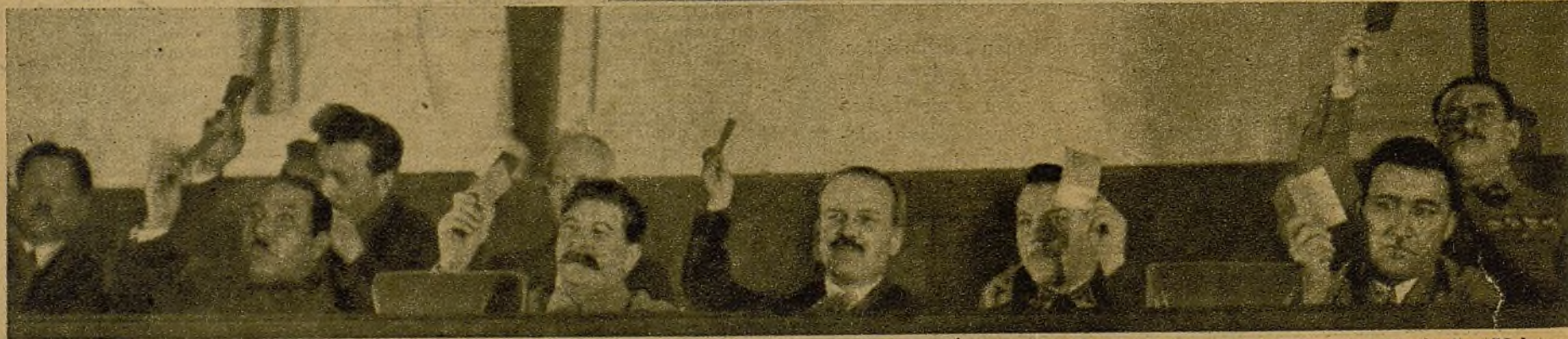
La Mesa presidencial del Congreso extraordinario soviético, en el Palacio del Kremlin, en el momento de votar la Constitución. Figuran en ella Stalin, Molotov, Vorochilov y Blucher