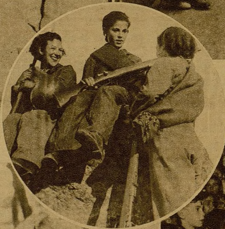
Milicianos de un puesto de vigilancia aprovechan los momentos de tregua para rendir devoto culto al "cotilleo"