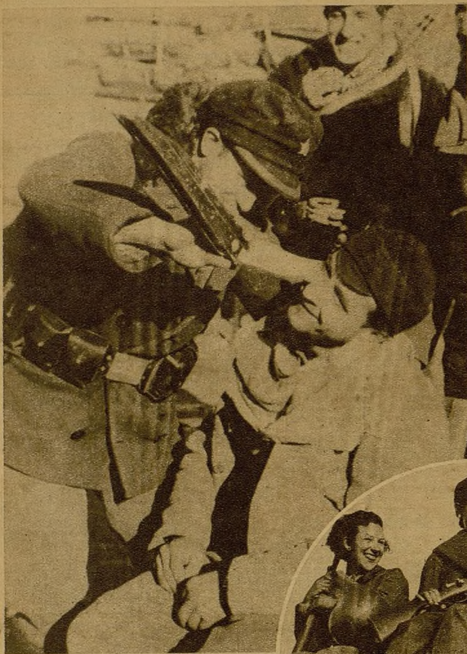
Empleando una navaja gigantesca, de muy dudosa efectividad, este rapabarbas improvisado se dedica a su tarea, teniendo como conejillo de Indias a un compañero que se presta complacidamente al sacrificio...