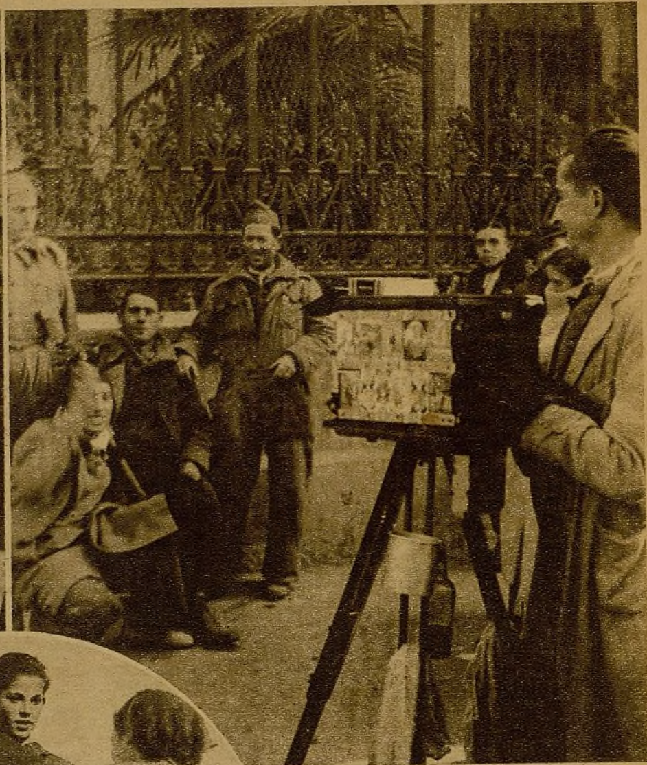
La primera preocupación del miliciano al llegar con permiso a Madrid, es colocarse ante el objetivo para enviar la foto a los familiares. Los "minuteros" están haciendo su "agosto"