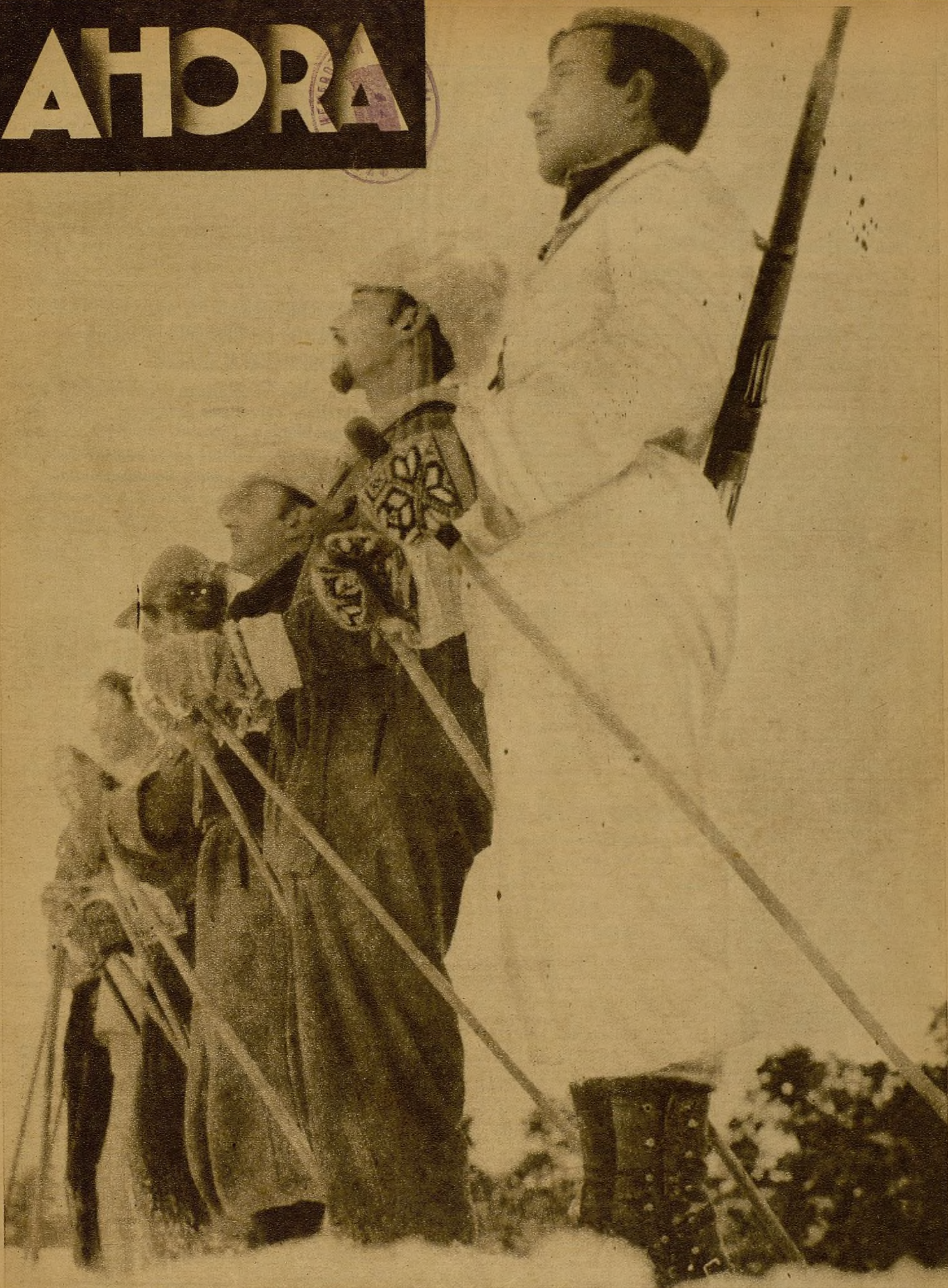
SOBRE LAS CIMAS GIGANTES DE LA SIERRA PROSIGUE INALTERABLE LA BARRERA DE LOS JOVENES LUCHADORES DEL BATALLÓN ALPINO.—Cuanto esfuerzos intentan los facciosos en la Sierra tienen rotunda y efectiva respuesta por los bravos combatientes del Batallón Alpino, que sobre las crestas cubiertas de nieve mantienen sus posiciones con inflexible firmeza. Los "ases" de otro día en los ejercicios de esquí unen, para la defensa de la causa popular, su pericia deportiva con la bravura de decididos fusileros. He aquí un grupo de vigilancia en las blanqueadas cumbres