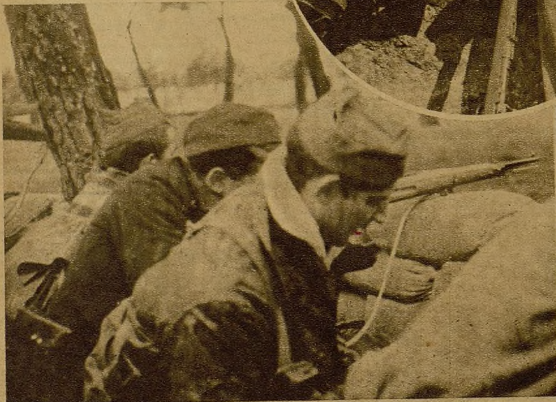
Milicianos de un parapeto en uno de los sectores del Centro, prestando su guardia, alertas a cualquier sorpresa que pueda hacer entrar en actividad a sus fusiles