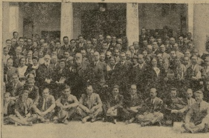
Inauguración de los Cursos de enseñanza agropecuaria, organizados por la Asociación General de Ganaderos

Las autoridades, siguiendo la tradición fascista, están dispuestas a que ninguno de los responsables quede impune. (Fabra.)