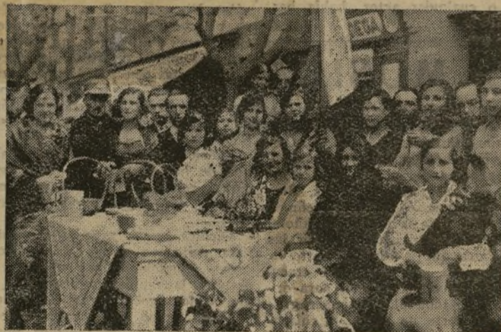
Grupo de señoritas que postulaba para allógar recursos para los pobres del distrito

Por lo expuesto, creemos que el Gobierno de la República se halla en el deber de realizar un severo examen de conciencia. España lo exige así. Es necesaria una declaración formal del mismo acerca del problema catalán. Este hecho tendrá la eficaz virtualidad de moderar los desbordamientos de unos y de alumbrar el horizonte intelectual de aquellos que no tengan formado criterio sobre tan grave problema.