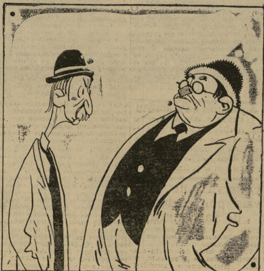
LA VÍCTIMA.—Pérez, está usted preocupado. EL SABLISTA.—Naturalmente; me inquieta la Conferencia del Desarme.

Existiendo una vacante de capitán en los Servicios Técnicos (Laboratorio) de Aviación Militar, se anuncia el oportuno concurso, promoviendo las instancias en el plazo de diez días.