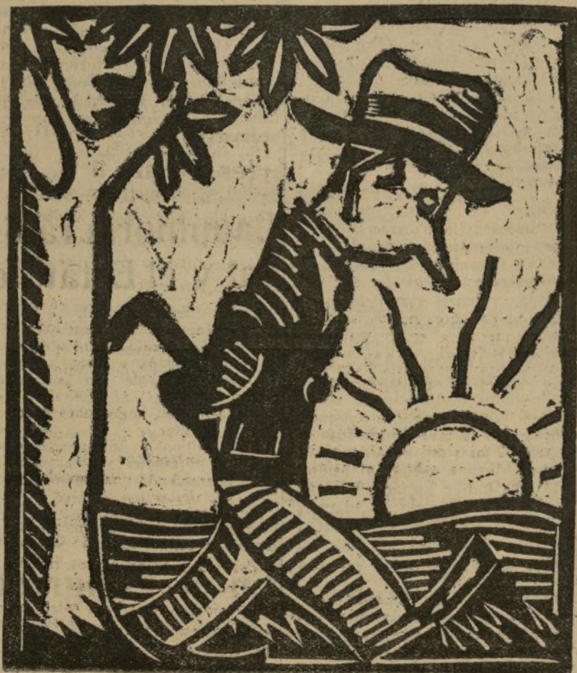
—Lo que no me explica es cómo se las habrán arreglado para conmemorar la fiesta del Trabajo los obreros sin él.