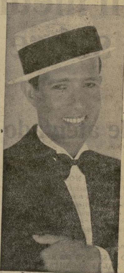
Rafael Rivelles, notable actor, protagonista de muchas películas españolas

También la "C. E. A.", formada por los autores españoles, se aprestan a lanzar su emisión, con el mismo fin que "E. C. S. A.", y seguramente obtendrán el mismo lisonjero resultado, lo que celebraremos muy de veras.