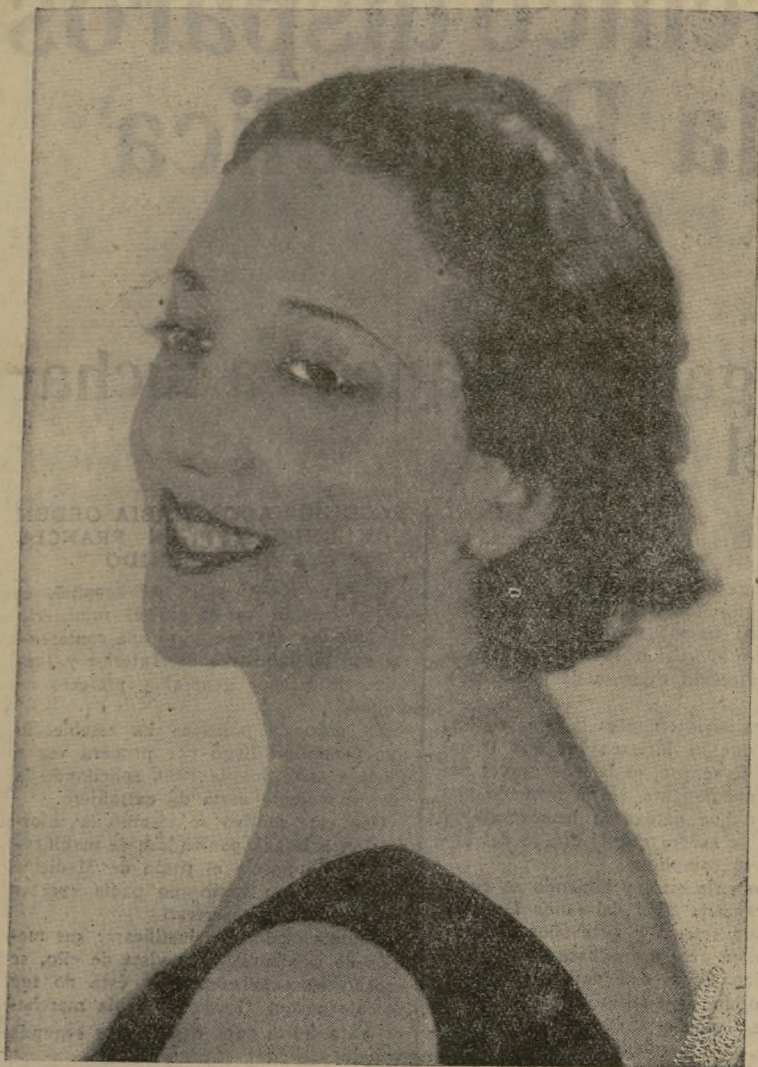
María Fernanda Ladrón de Guevara, eminente actriz y "estrella" española