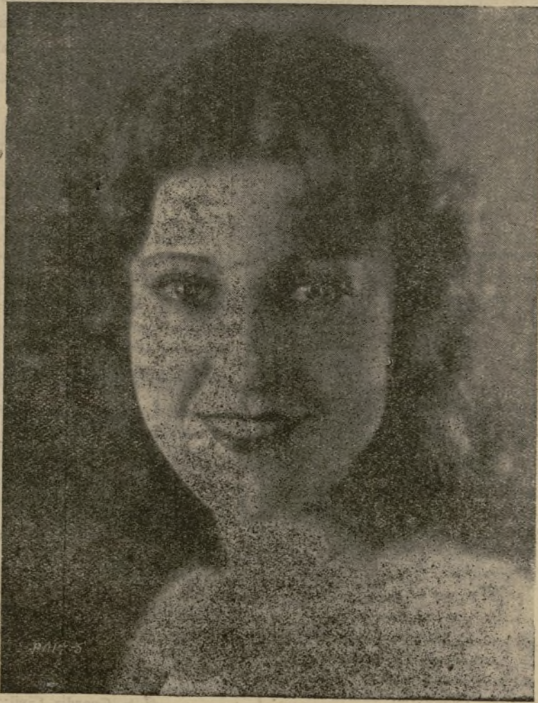
La notable estrella cinematográfica Jeannette Mac-Donald