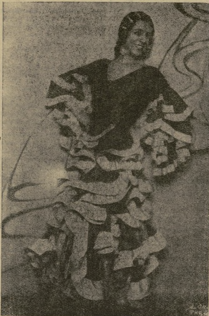
La gran bailarina española, Antonia Mercé, "La Argentina", que ha ac-tuado brillantemente en el Español