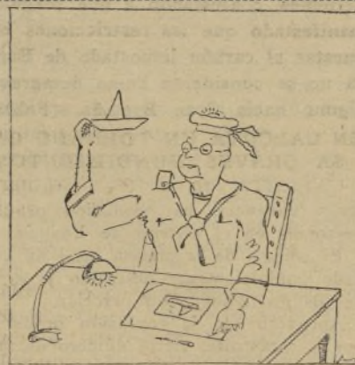
EL FARMACEUTICO GIRAL. — A mí que me tiran "además", pero que no me toquen a la marina.

En estos momentos en que una inmensa mayoría de españoles protesta airadamente contra el Estatuto catalán y en los que algunos periódicos piden concordia y serenidad en las discusiones parlamentarias quitándole importancia al fondo, francamente antipatriótico del famoso documento, conviene