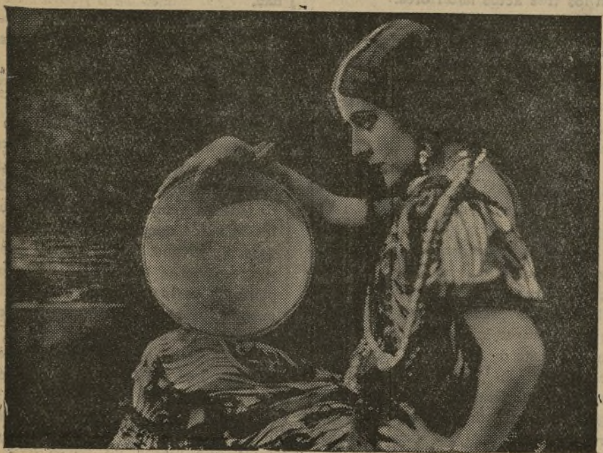
Imperio Argentina, admirable "estrella" cinematográfica española, que acaba de tener un desagradable incidente en Valencia con el público

Preparación especializada. Opciones Auxiliares, Gobernación, Bibliotecarios, Agricultura, Correos, Policía. Se admiten señores. Sueldos, 3.000 pesetas y 2.500 pesetas. San Bernardo, número 2, segundo. Teléfono 19236.