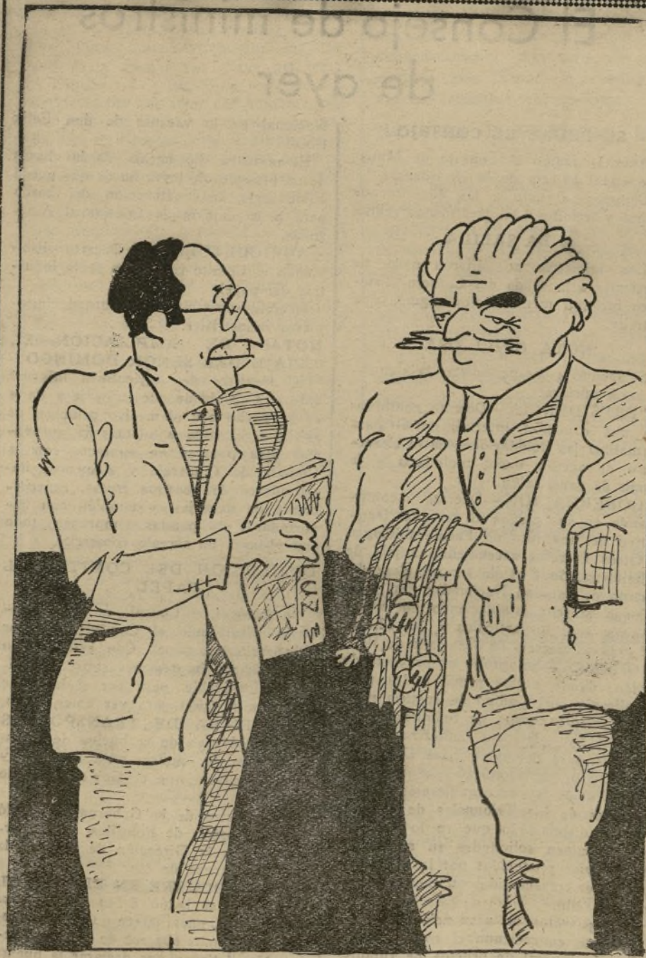
DIALOGO DE ACTUALIDAD

El acto resultó cordialísimo, y puso de manifiesto la penetración de la clase patronal con las autoridades superiores.