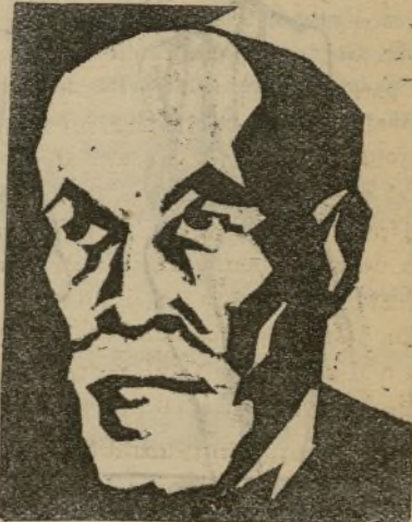
El barón Iunkai, presidente del Consejo de ministros japonés, recientemente asesinado