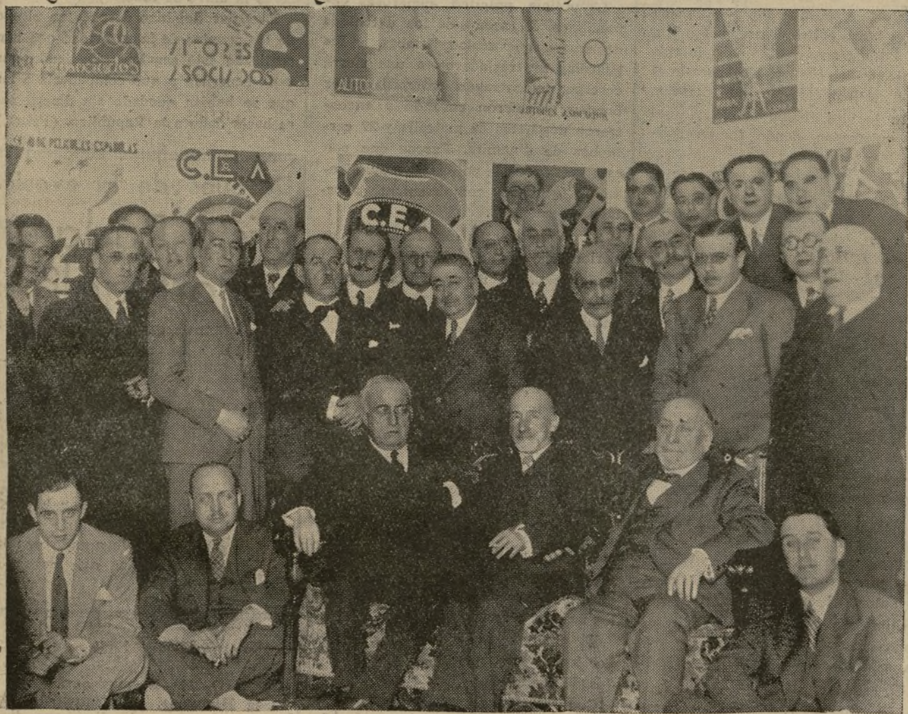
El Consejo de Administración de la «C. E. A.» (Cinematografía Española Americana.)

BARCELO.—6,45, 10,45, El rey del betún (astracanada, trucos, risas). Próximo estreno, Los hijos de la calle.