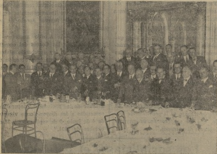
Banquete con que la C. E. A. ha celebrado la iniciación de sus trabajos

AVENIDA.—6,45 y 10,45, temporada de espectáculos arrevisados, Louis Douglas, con sus 50 artistas. Rosewa Skelton. La revista internacional Modern melodies. (Butaca, tarde, 2,50; noche, 3 pesetas.)