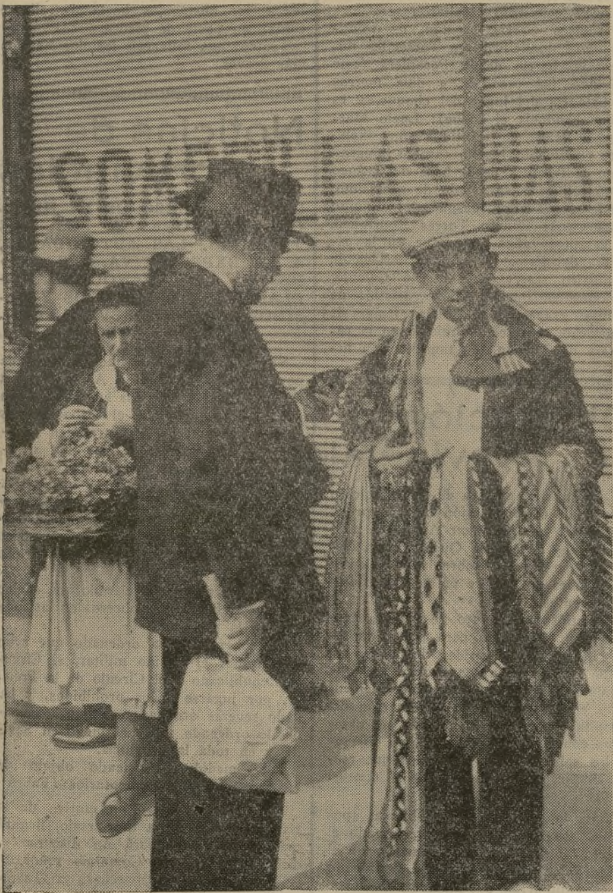
... son los mismos, con la misma variedad de mercancía expuesta sobre los hombros...

GOMAS HIGIENICAS LA IDEAL, Jardines 23 Envío reservado provincias