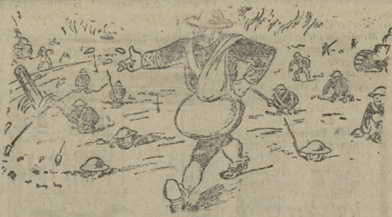
Las siembras de la Conferencia de la Paz

LE BOURGET, 7.—El señor La Cierva ha llegado, procedente de Colonia, pilotando su nuevo autogiro.