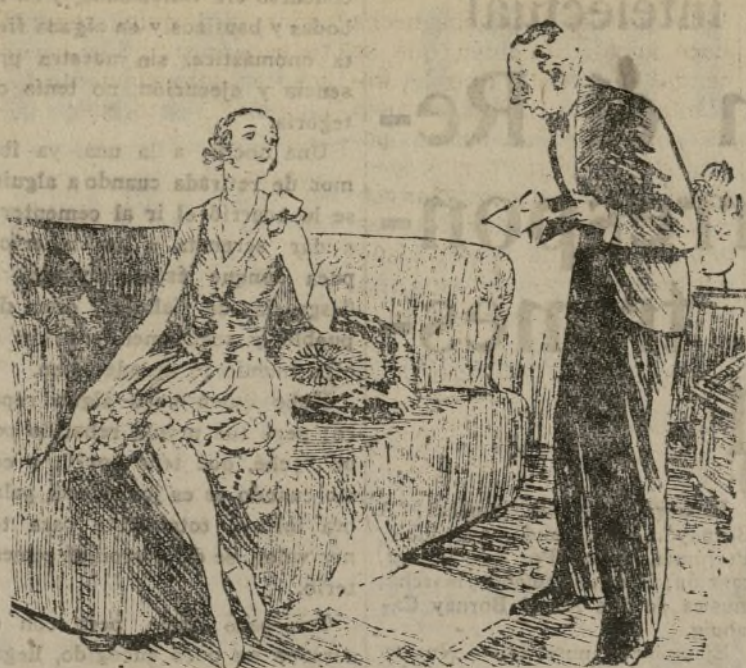
EL.—¿Todavía más cuentas? Te figuras que mi amistad con Cordero da para todos tus cachichos. ELLA.—Como decías que te enchufaban en la Azucarera del Pilar...