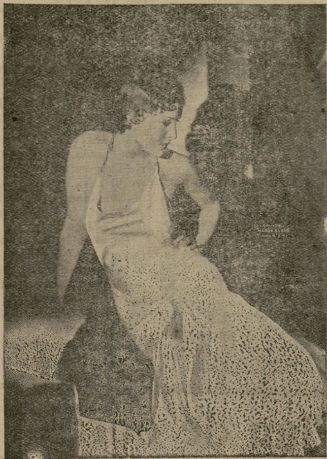
La bella y adorable artista de la M.G.M., MADGE EVANS

—Y Adolfo Menjou en "Fancy Free", con Joan Massh y Minna Gombell.