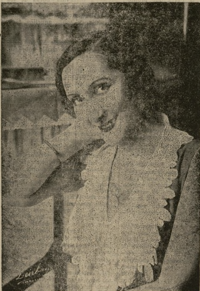
La bellísima y notable actriz Mercedes Prende.

No obstante el talento de Genina, no puede permanecer oculto, y a lo largo del film nos vemos sorprendidos por una serie de pequeños detalles que contribuyen eficazmente al conjunto, y que son los que sirven para poner a prueba un director.