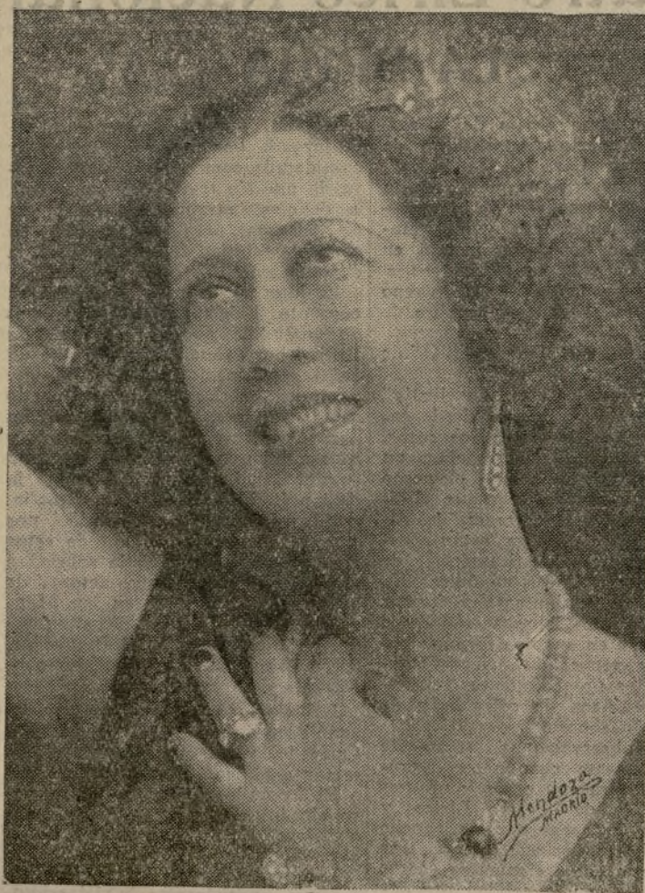
OFELIA DE ARAGON, la gran cantante, que se presentó el viernes en el Romea

Las conclusiones adoptadas en la reunión, serán sometidas a las asambleas de los respectivos sindicatos obrero y patronal.