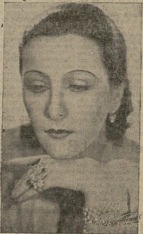
La eminente actriz del cine checo, Tchakanowa, a la que pronto admiraremos en un film realista.

Y para eso, terminamos, nos permitimos requerir el apoyo valioso la colaboración entusiasta, de los periódicos madrileños que sienten la dignidad profesional debida, para no ir demasiado a la trasera de las famosas carrozas triunfales.