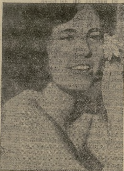
Una de las bellas veraneantes que se admiran este año en Alicante.

Todos los funcionarios de la aduana de Dairen han presentado su dimisión al Gobierno chino y han declarado que están dispuestos a asegurar el funcionamiento de la aduana, a las órdenes del Gobierno manchú (Fabra).