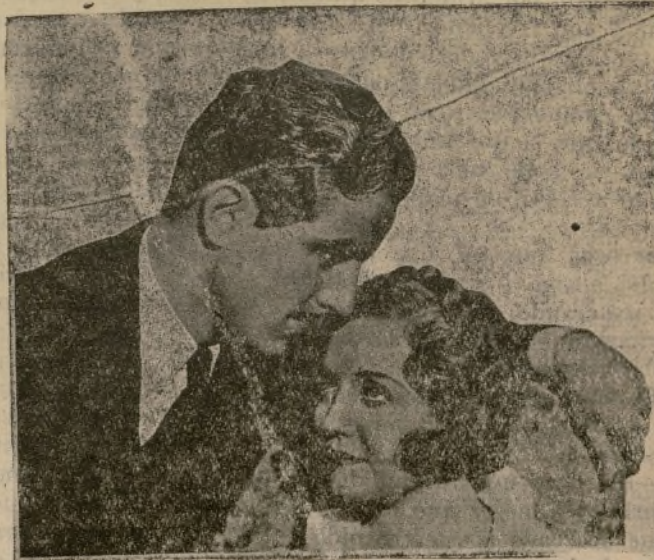
Philipp Holmes y Nancy Carroll, en «El hombre que mató».