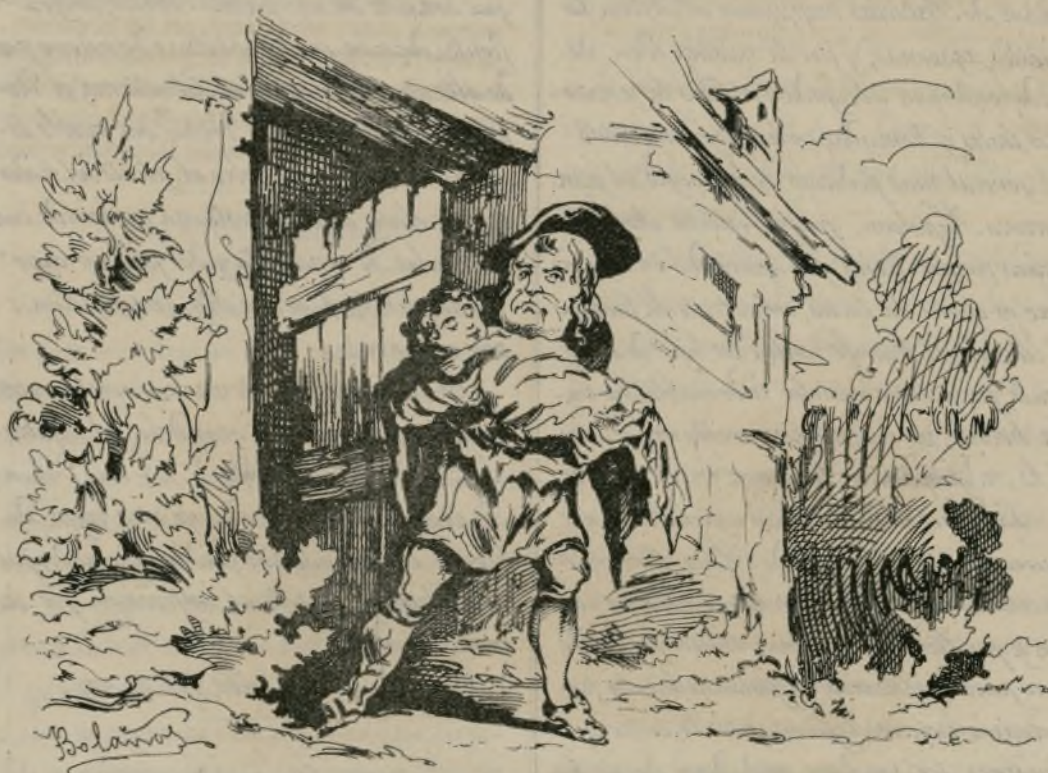
..... Salió de la cabaña..... (Pág. 141.)

—¡Ah, papá mio! contestó el niño con re-