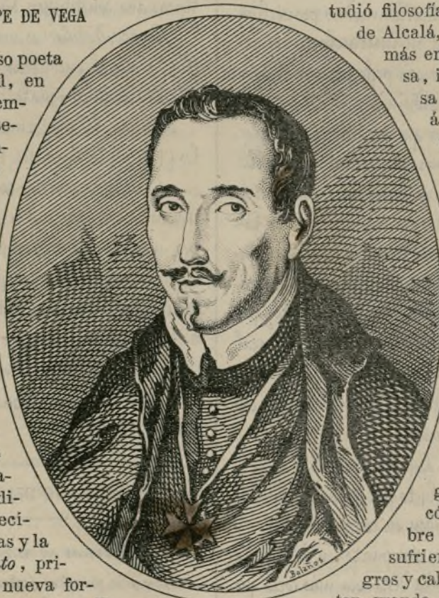
Frey Félix Lope de Vega.

Nació este famoso poeta español en Madrid, en 1526, á 25 de Noviembre, y hay quien asegura que á los cinco años componia versos, para demostrar sin duda que á la naturaleza más que al arte debia el ser poeta. Quedó á los doce años huérfano de padre, y su desgracia fué menor de lo que podía ser, por la protección del obispo de Ávila que lo llamó á su lado. Dedicóle Lope, agradecido, algunas églogas y la Pastoral de Jacinto , primer ensayo de la nueva forma que intentó dar al teatro. Es-