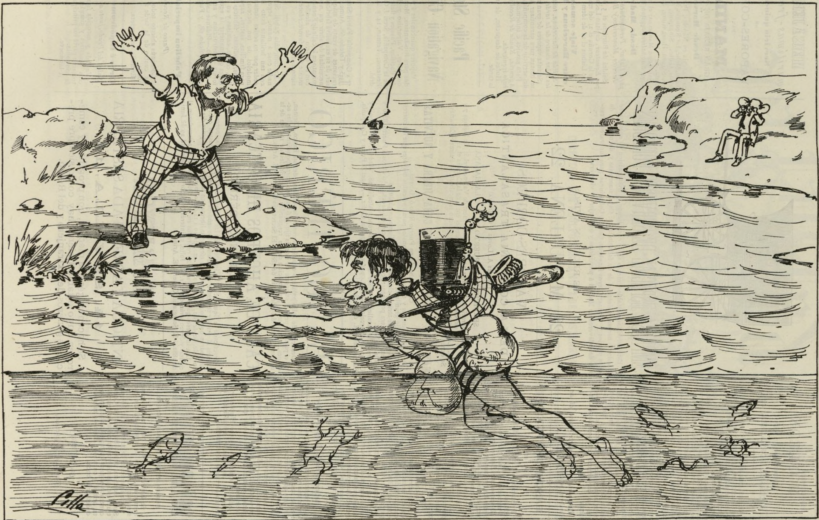
Nadar y guardar la ropa