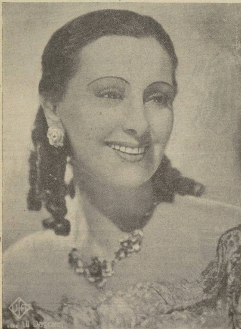
Lili Dagover, encantadora estrella «Ufa»

Basada en la novela de Mürger titulada «La Bohemia», en la que se inspiró el eminente compositor Giacomo Puccini para su gran ópera «La Bohème», se ha hecho un film que de no interpretarlo Martha Eggerth hubiera fracasado.