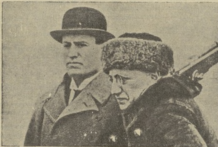
Roma.-Gabriel D'Annunzio, el ilustre poeta recientemente fallecido, acompañado del jefe del Gobierno italiano, Benito Mussolini

cío. Bajo una copa de árbol y en un espacio desmontado y ya endurecido, hay restos de ceniza y colillas de cigarro, cerca de tres piedras de hogar quemadas por el fuego y ennegrecidas por el humo.