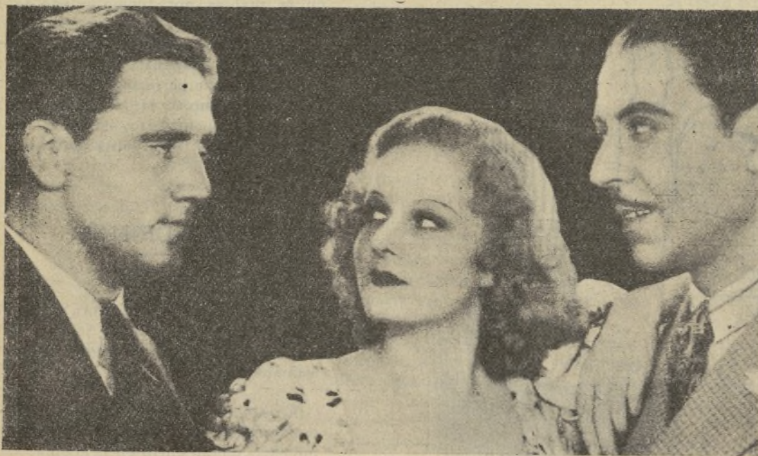
Una escena de la reciente producción «metro» de la malograda Jean Harlow, «Flor de Arrabal», con Spencer Tracy

Paso a otra encantadora actriz infantil, mayorcita que Shirley Temple, pero con unas características muy distintas: aquélla sugestionada por simpatía, ésta convence por interpretación. Su labor es más razonada y adquiere una gran trayectoria en satisfa-