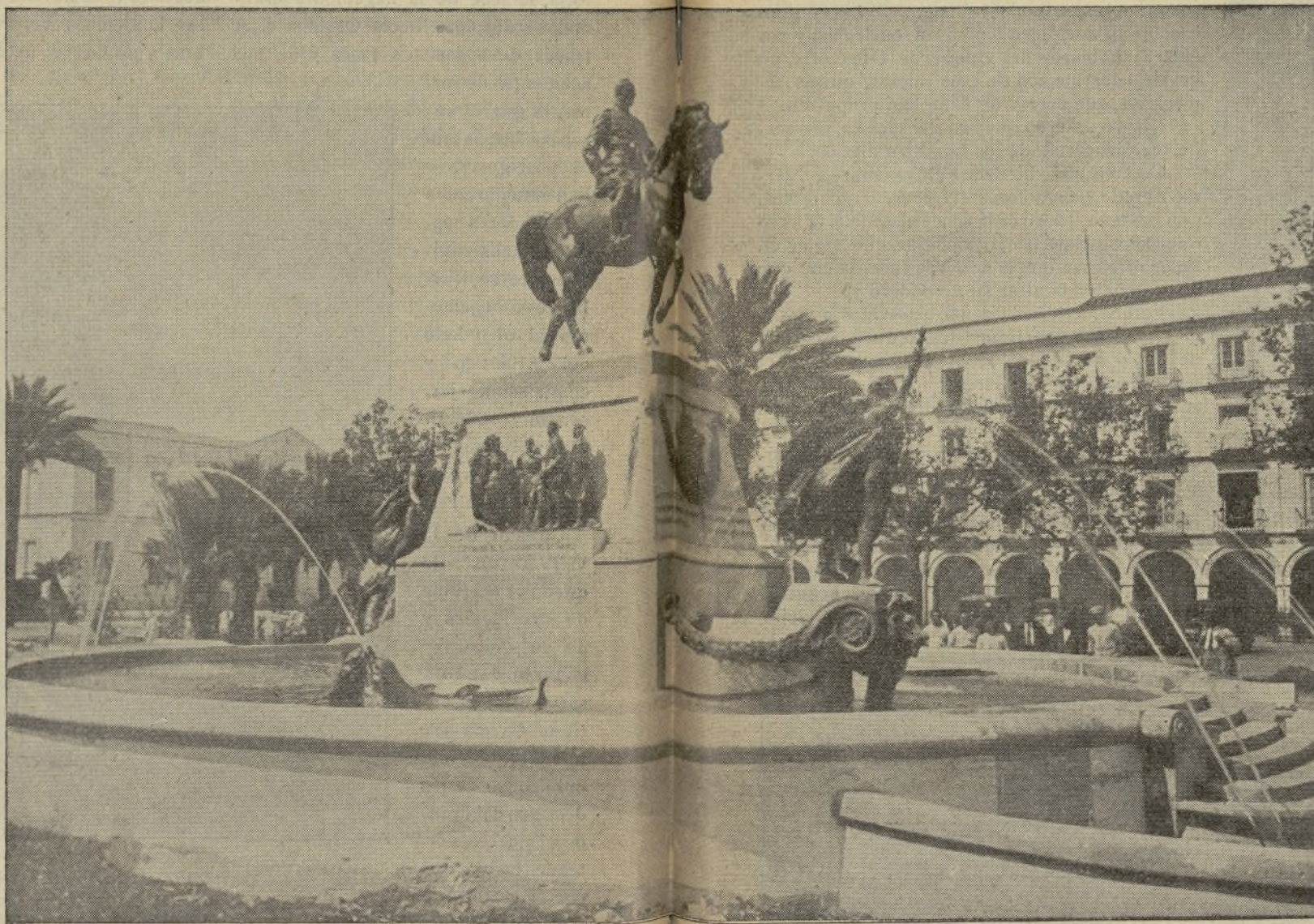
MONUMENTO AL GENERAL PRIMO DE RIVERA EN LA PLAZA DEL ARENAL

pacitados agregados comerciales y una red de oficinas de información en los consulados; aumentar el número de ellos y dotarlos más espléndidamente; fundar becas en nuestras Escuelas de Comercio para diplomados o estudiantes americanos, y gestionar reciprocidad para que pudieran ser enviados a aquellas escuelas y Facultades de comercio un buen número de estudiantes españoles, debidamente selecciona-