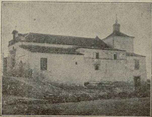
Jerez de la Frontera.--Ermita de San Telmo