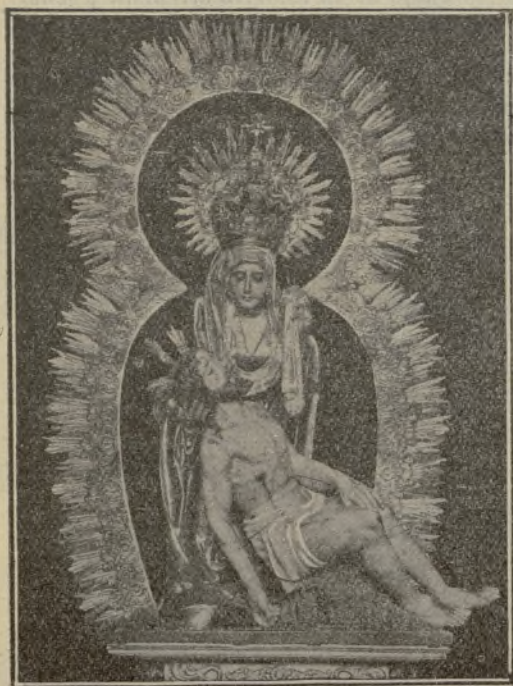
Imagen de Nuestra Señora de las Angustias, que se venera en la iglesia de su nombre