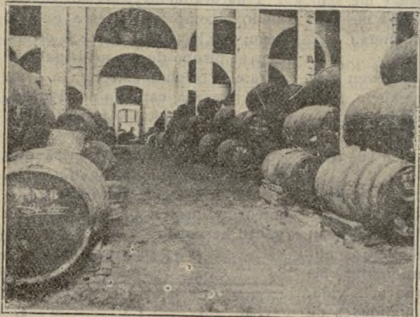
Jerez de la Frontera.--Una bodega

Pero ya que nos vemos privados de rendirle el justo homenaje a que es acreedor, por sus muchos merecimientos, debemos consignar, pues ello es axiomático, que la loable labor que está realizando al frente de aquel Ayuntamiento, dejará seguramente grato recuerdo para el futuro en el pueblo jerezano, ya que esa gran labor es reflejo de su espíritu altruista y generoso, de su talento y de su cultura, bien demostrada durante toda su vida, no sólo en la cátedra, sino también en el estudio y en el trabajo intelectual, de la que deja algunas veces en la prensa y en el libro muy preciadas muestras.