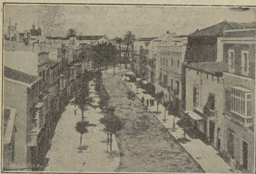
Calle del General Franco

Es una hacienda riquísima, tiene extensos olivares y