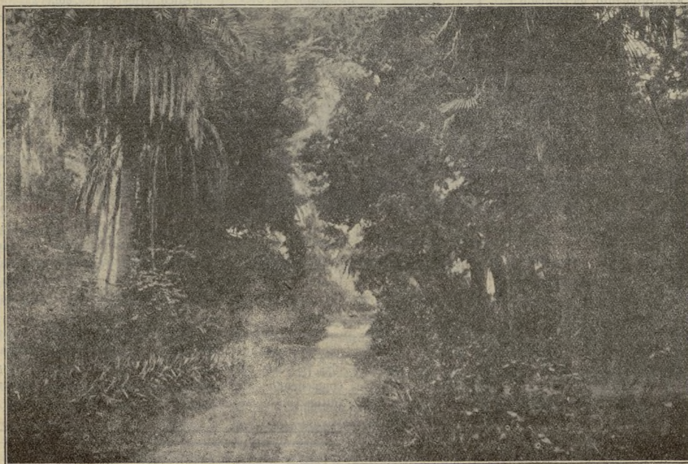
JARDINES DE TEMPUL

con una superficie de más de 142.000 hectáreas, se extiende por toda la cabecera de la provincia de Cádiz, casi