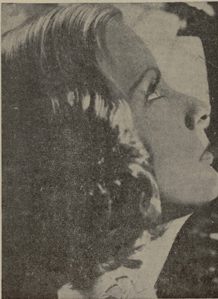
La insustituible Greta Garbo, la más famosa y popular de las artistas