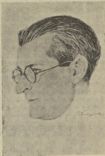
Andrés Vázquez de Sola notable poeta español

en sus cálices engarza. Más vale que siempre ignores dolor que tan hondo arraiga; pero, mira: ¡yo no quiero que te llamen «Fuente-Clara»! Entre las ásperas rocas de un rincón de la montaña desatando sus rumores una límpida fontana, por que no encienda su nieve, del claro sol se recata; mas si, rendidos al peso de abrumadora jornada, de su sed los caminantes quieren apagar las llamas, el venero les ofrece su fresca y bruñida plata: que así cumple su destino la pobre fuente, que aguarda como ayer ser hoy de todos y ser de todos mañana... Esa muda indiferencia