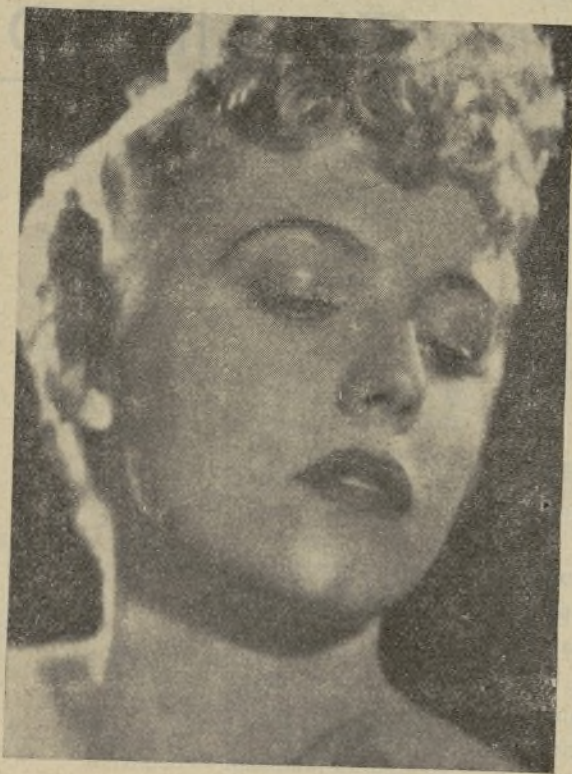
Mona Barrie, estrella Paramount