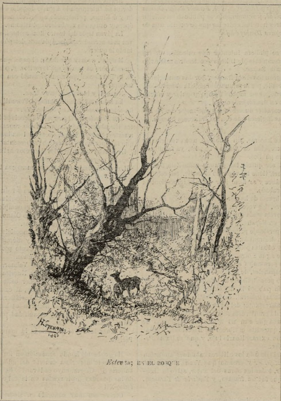
Estevan; EN EL BOSQUE