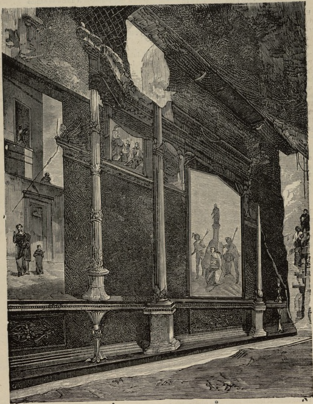
CASA DE LIVIA EN POMPEYA