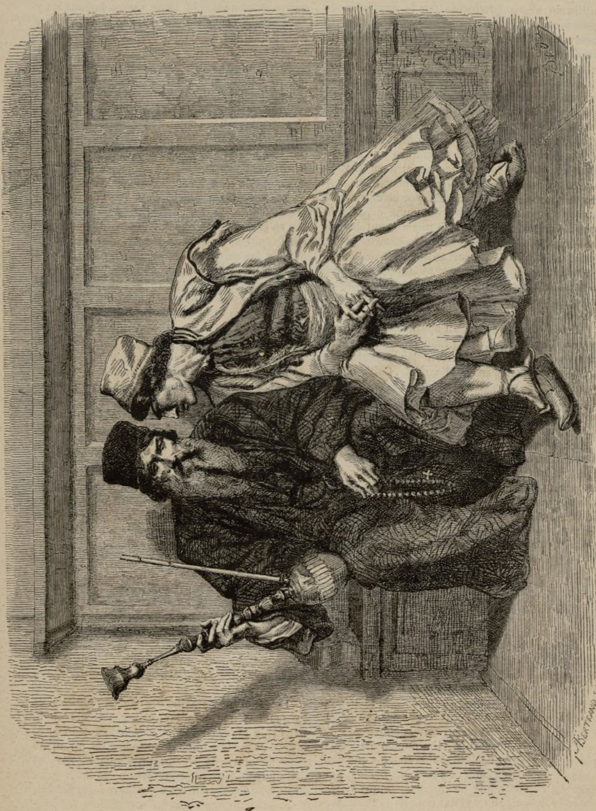
EN LA ANTESALA (Beltrand).