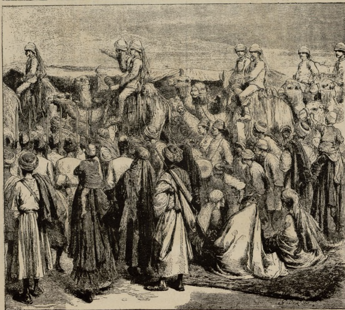
LA EXPLOSION DEL FERRO-CARRIL METROPOLITANO (LÓNDRES.)—UN DRAMA.—EL EJÉRCITO DE HIRKS PACHÁ