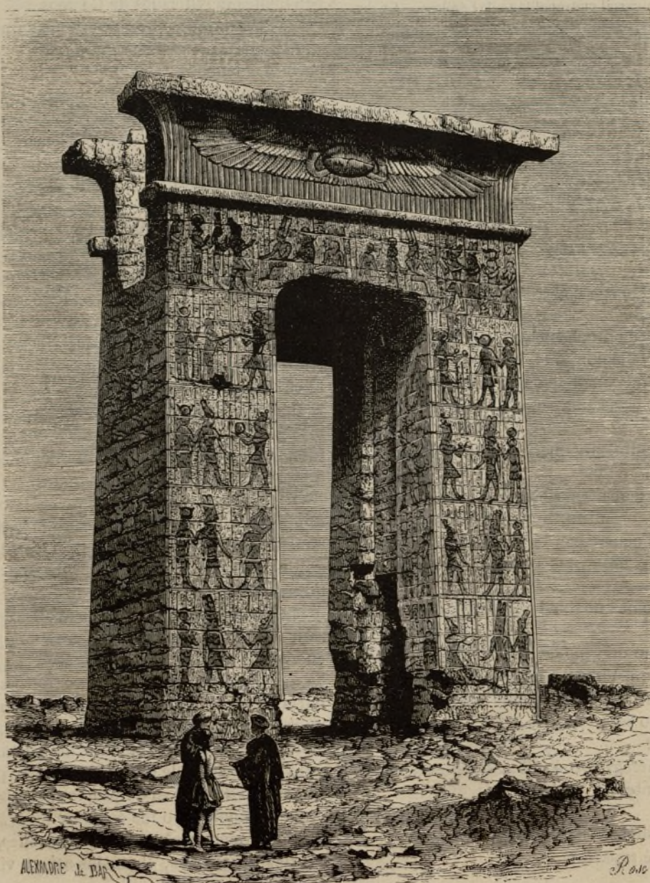
EL ANTIGUO EGIPTO.—RUINAS DE UN TEMPLO