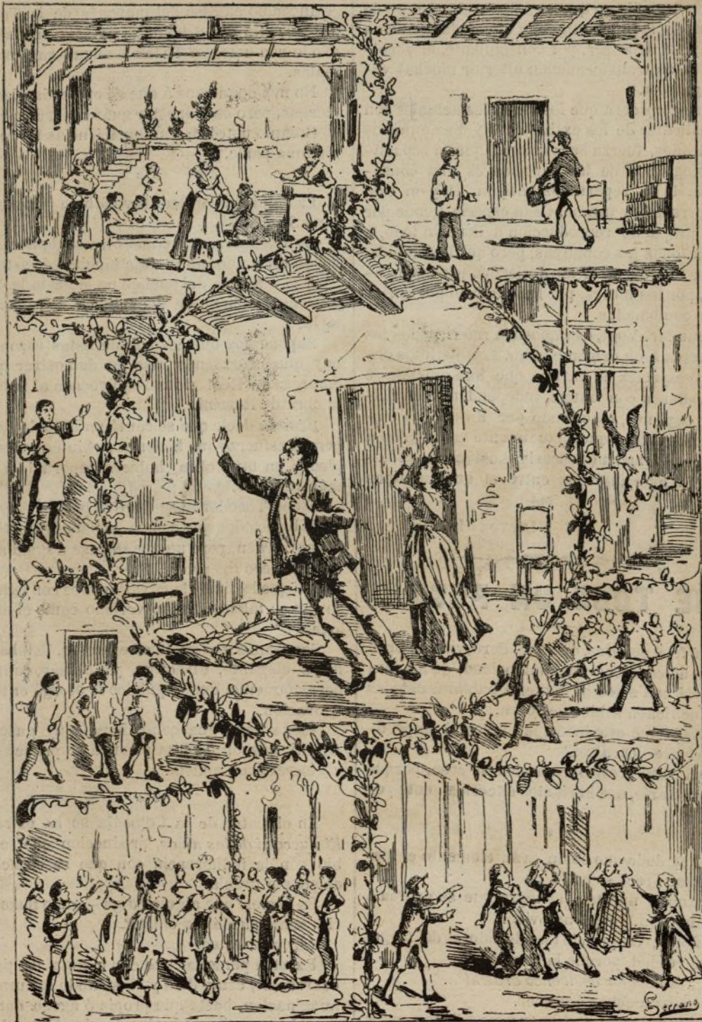
TEATRO DE NOVEDADES: L'Assommoir .