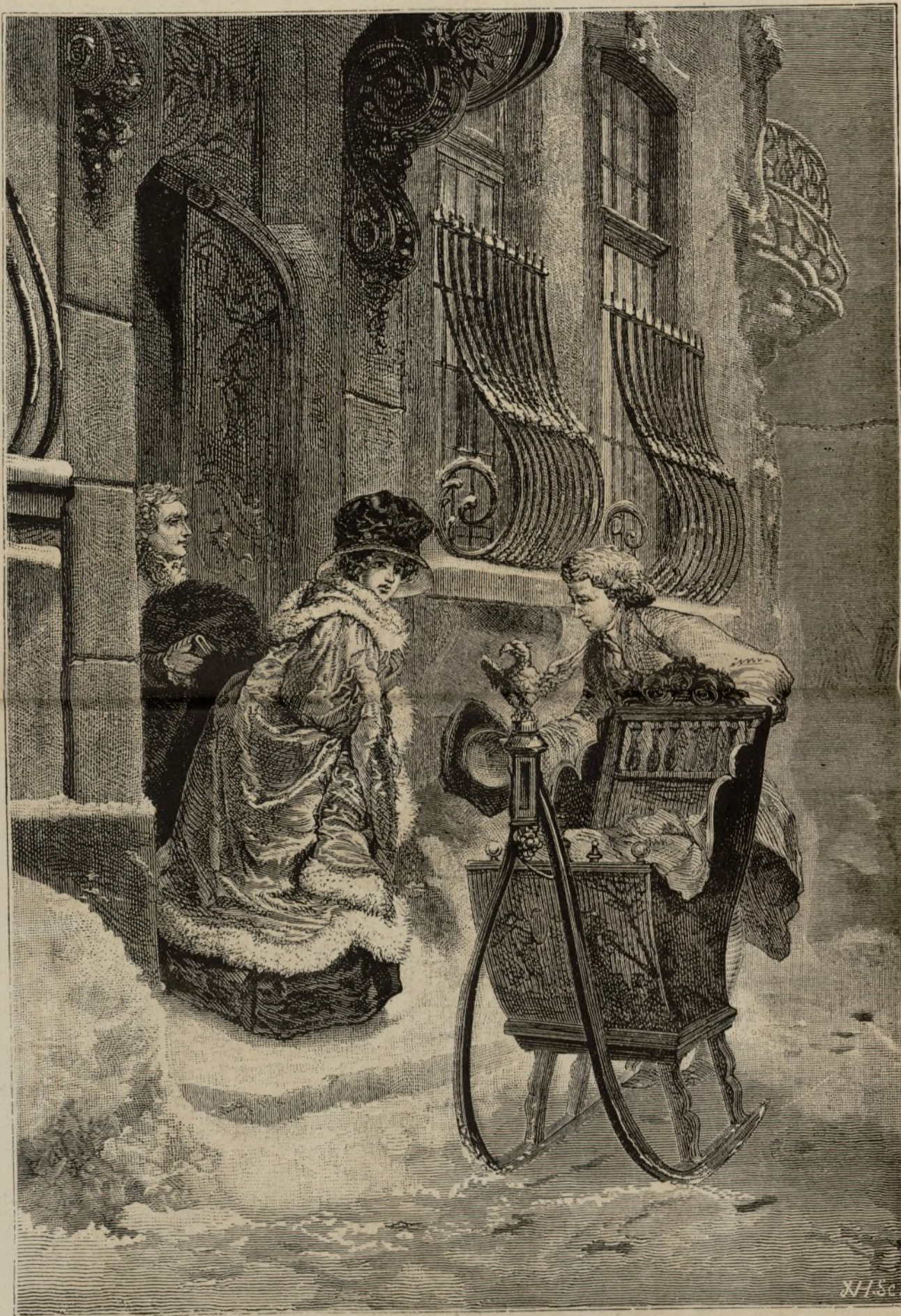
EL INVIERNO.—EN EL TRINEO